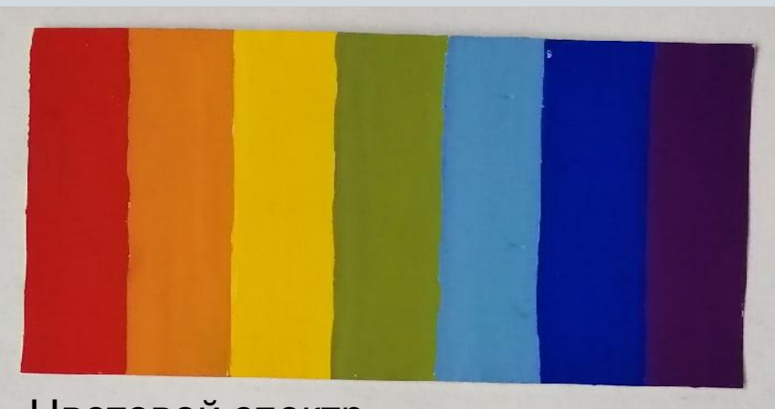
Цветовой спектр. Гуашь.