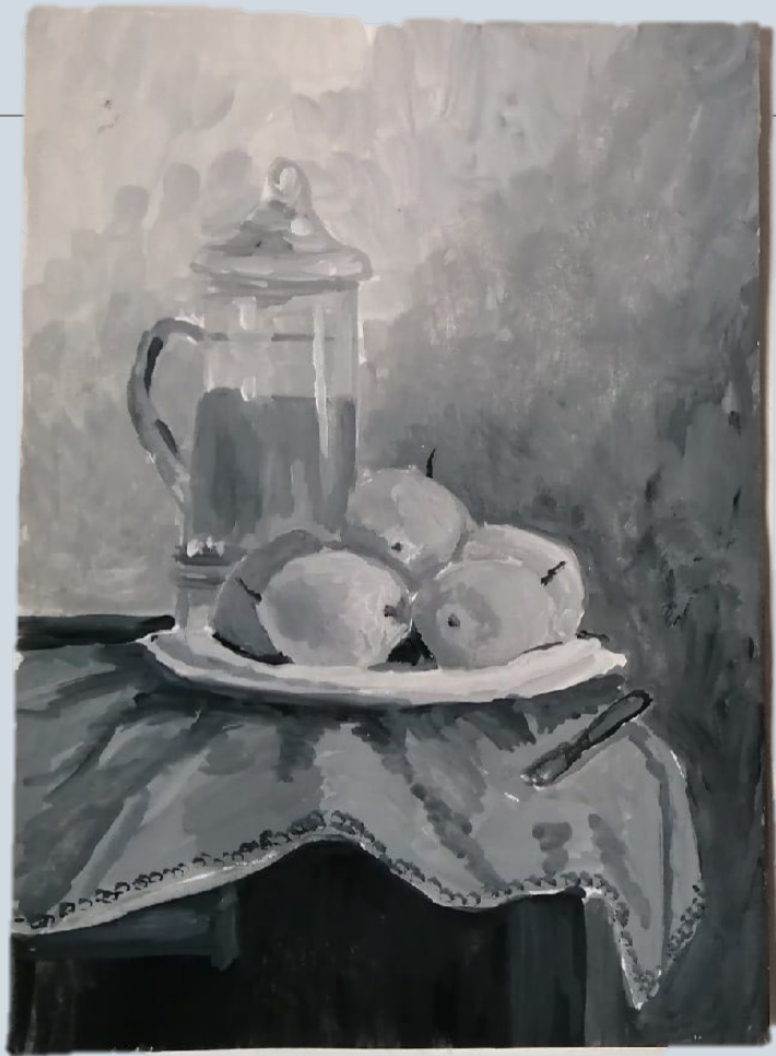
Ахроматический натюрморт. Гуашь.