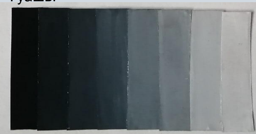
Ахроматический спектр. Гуашь.