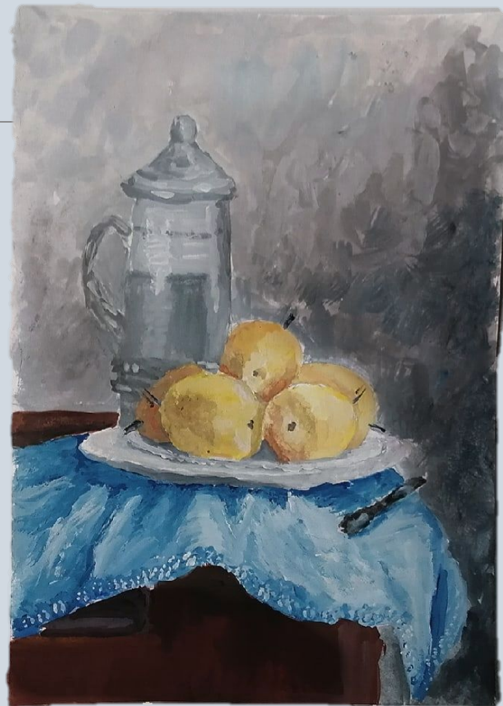
Копия натюрморта. Гуашь.