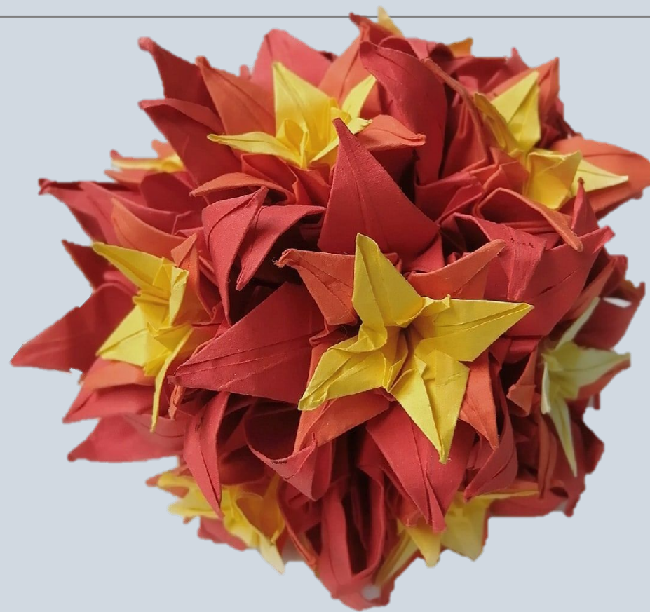
Цветочная кусудاما. Цветная бумага.