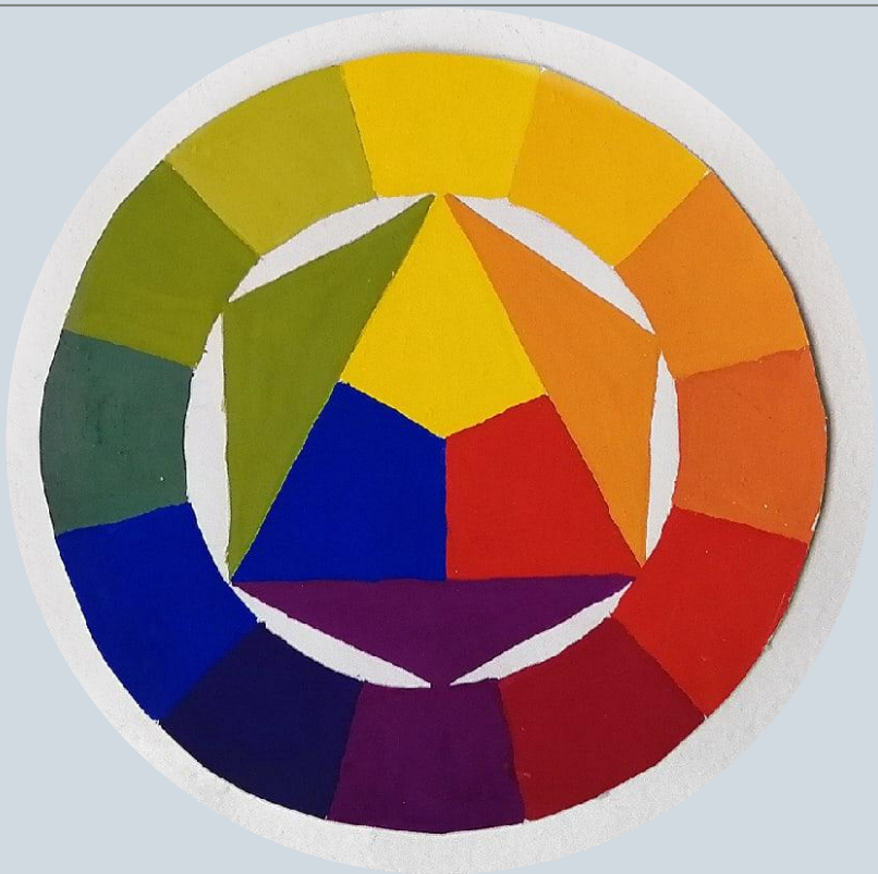
Цветовой круг Иттена. Гуашь.