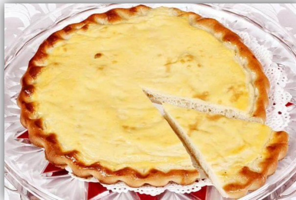
Пуремеч — разновидность ватрушки с творогом