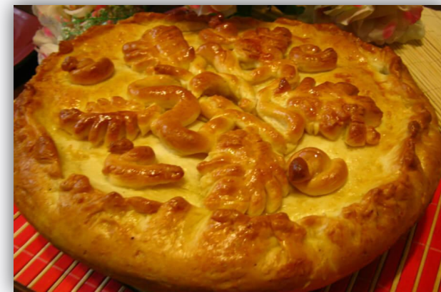
Хуплу — дрожжевой пирог с картофельно-мясной начинкой.