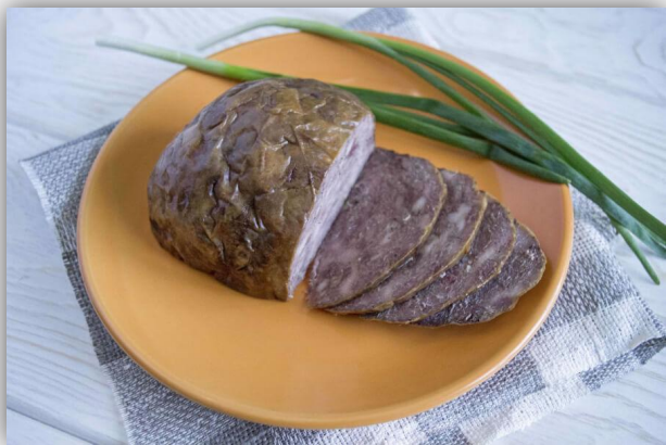
Шартан — чувашское блюдо из мяса.

Чувашская кухня испытала влияние русской, татарской, удмуртской кухни, марийской, но, несмотря на это, она сохранила национальные черты.