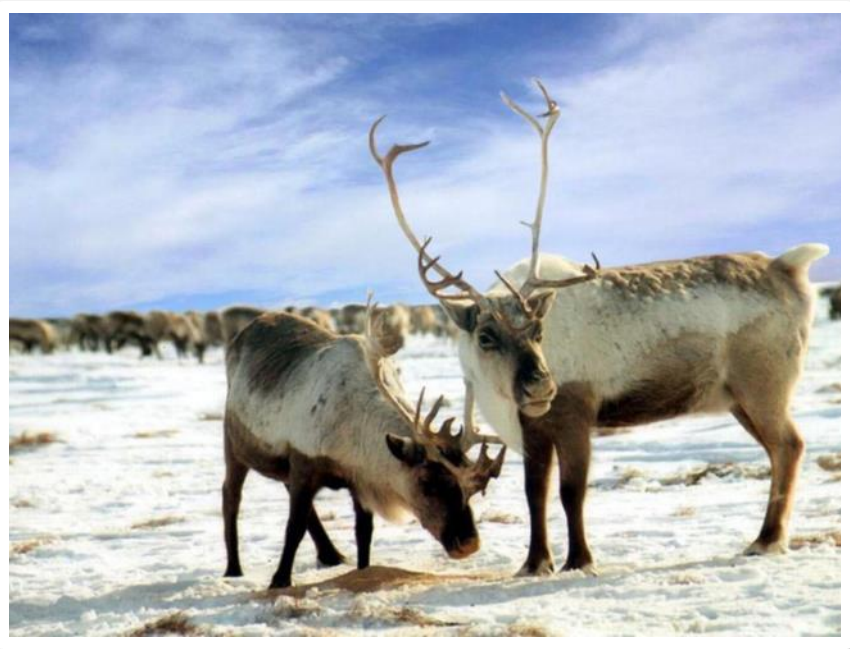
Основные районы оленоводства: