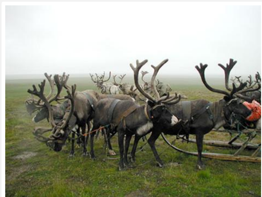
Крайний север Сибири и Дальнего Востока