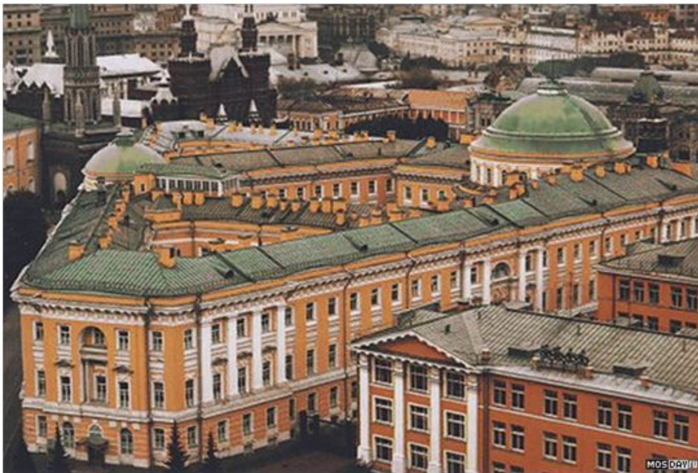
Здание Сената в Кремле. Архитектор Казаков