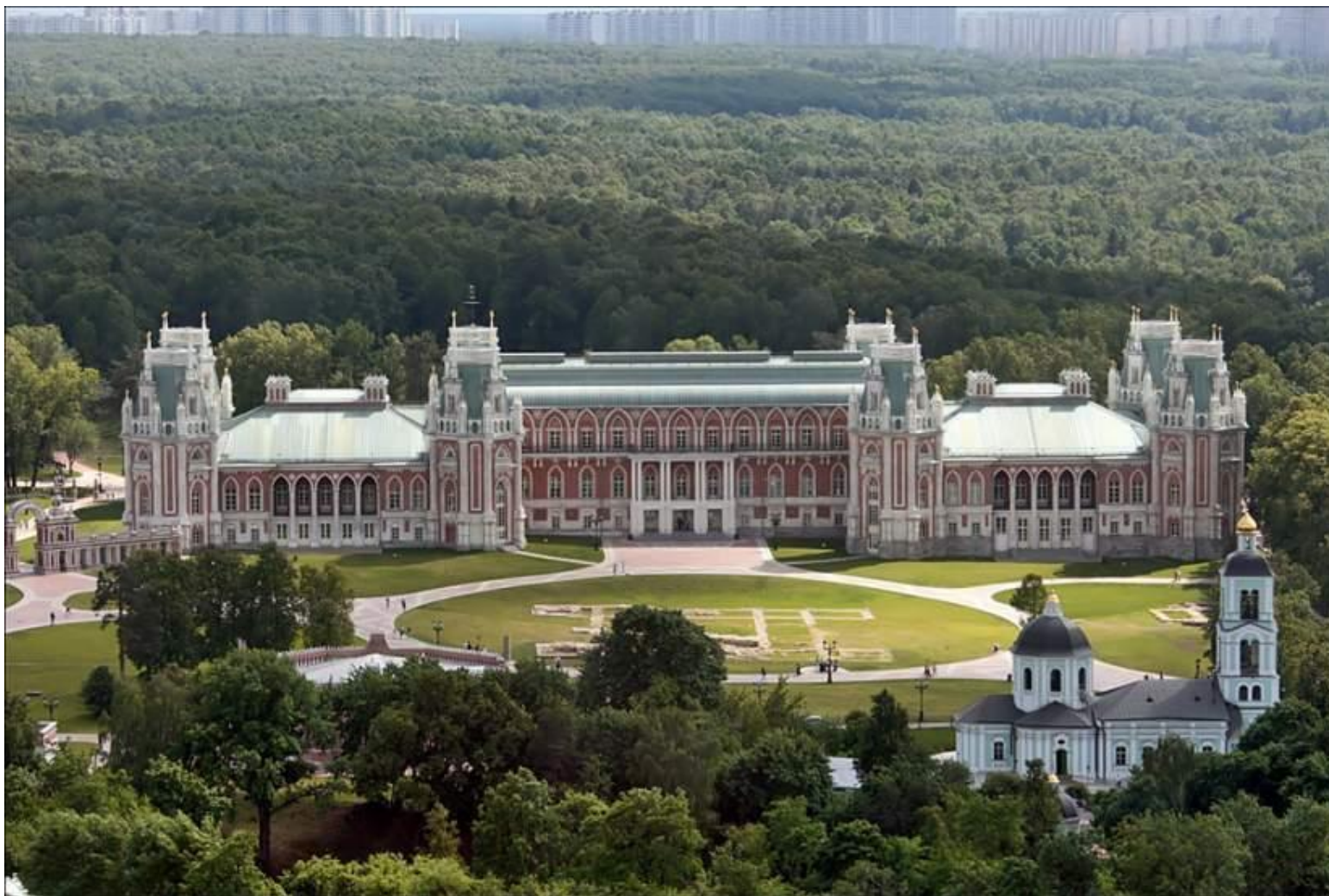
Царицынский дворцовый ансамбль