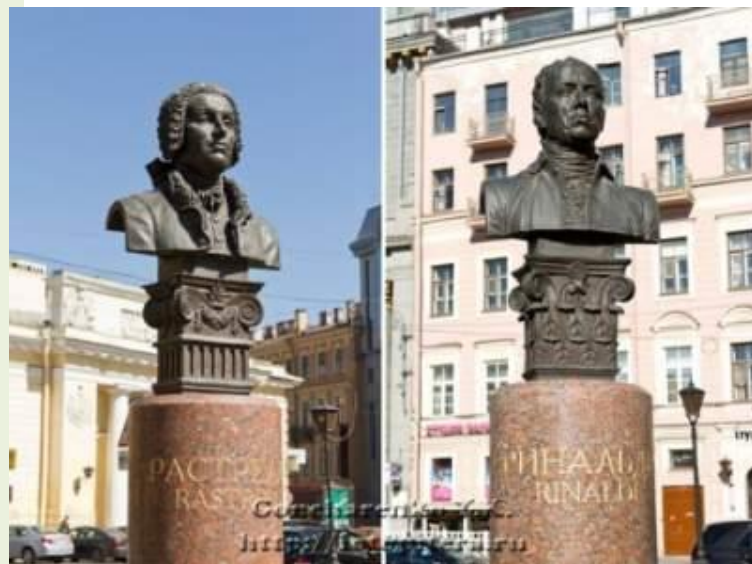
Б.Ф. Растрелли и А. Ринальди