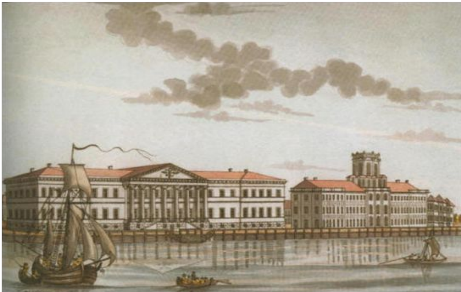
Здание Академии наук, архитектор Дж. Кваренги, Санкт-Петербург, 1783-1789 гг