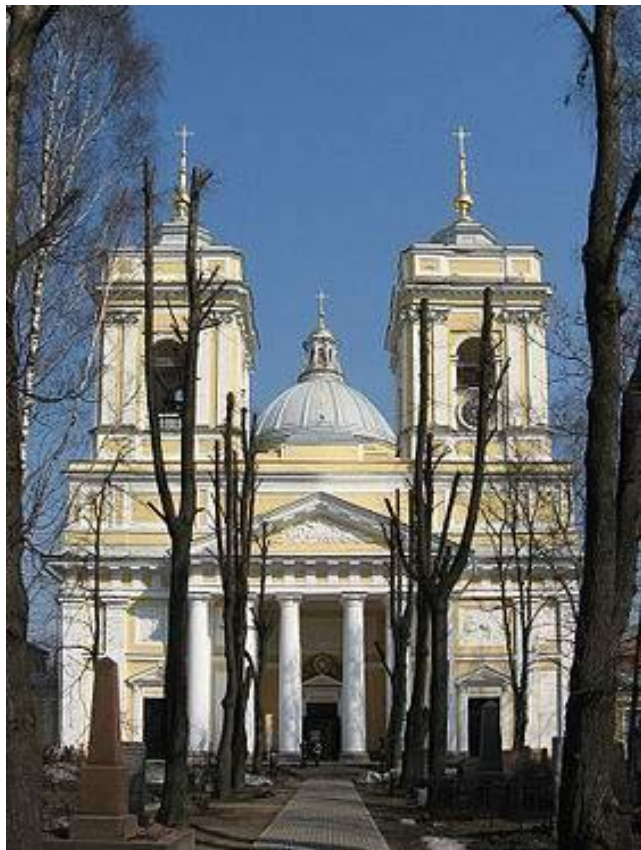
Троицкий собор в Александро- Невской лавре