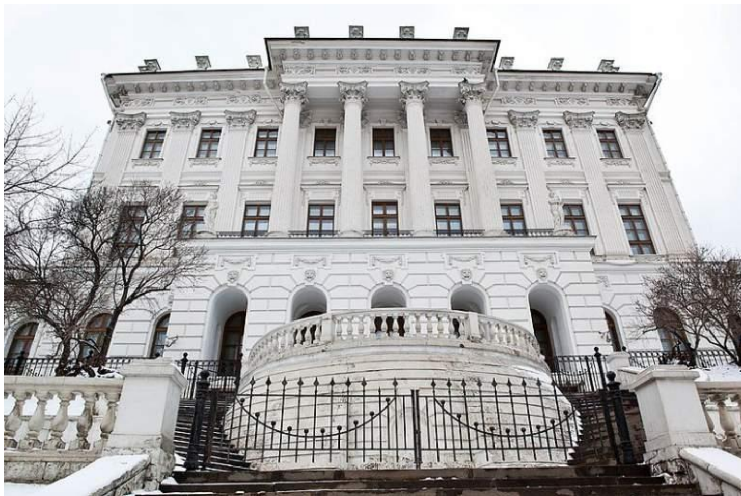
Дом Пашковых в Москве