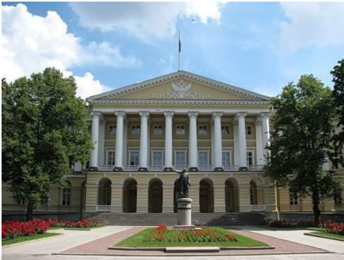
Смольный, архитектор Дж. Кваренги,