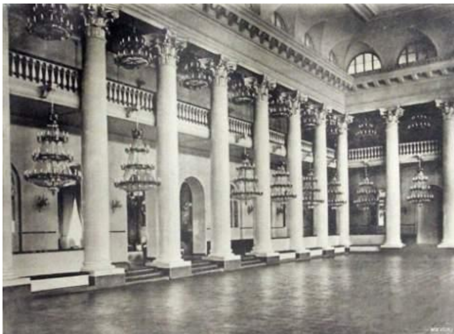
Благородное собрание (1775)