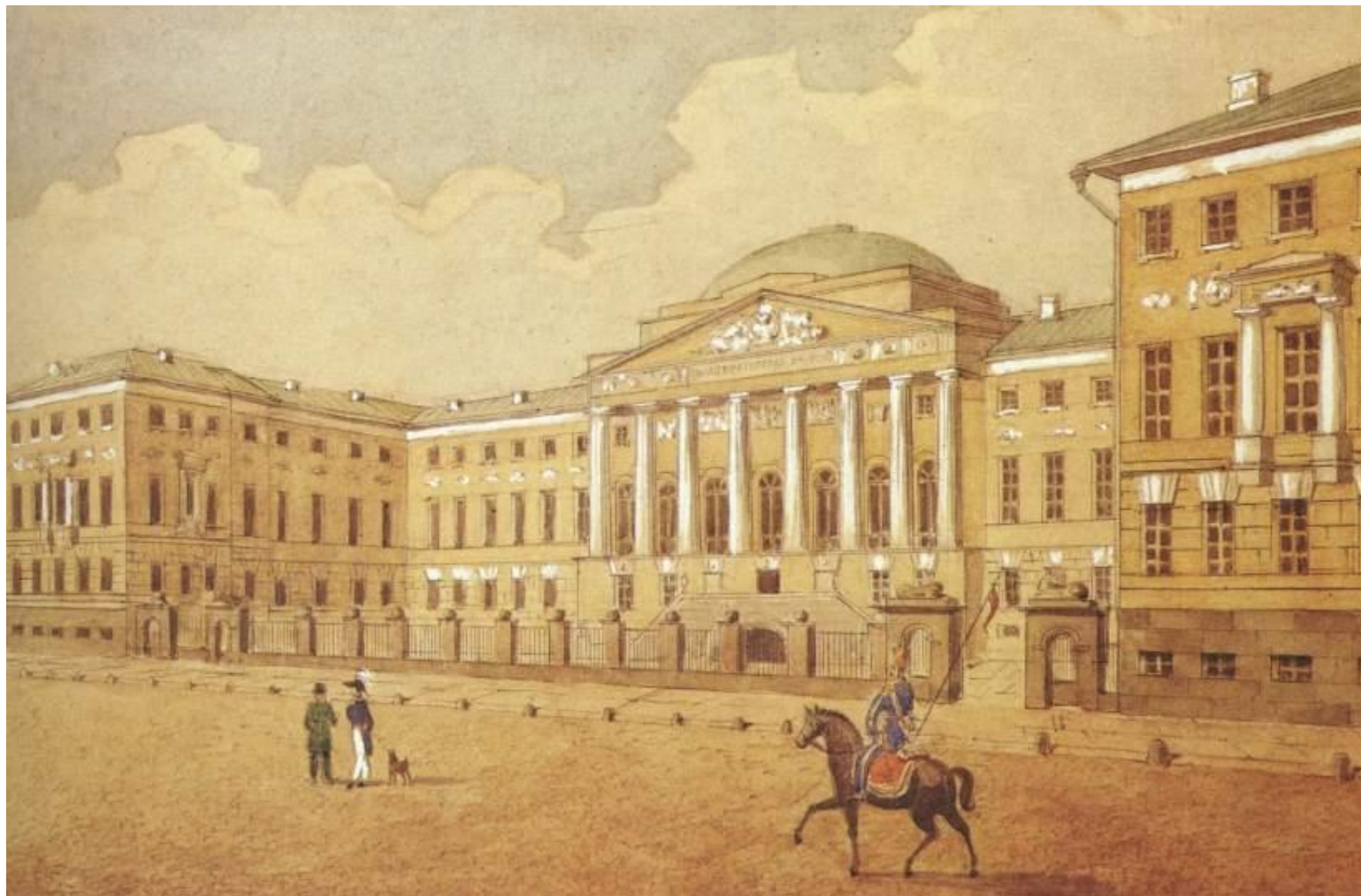
Здание Московского университета