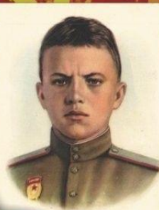
МАТРОСОВ Александр Матвеевич (1924-1943)

Военный лётчик, капитан, командир эскадрильи. Погиб 26 июня 1941 года совершая огненный таран: направил горящую машину на механизированную колонну врага.