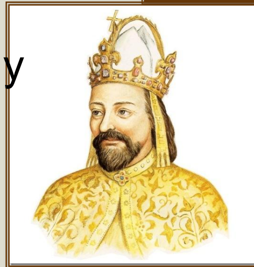
Імператор священної Римської імперії Карл