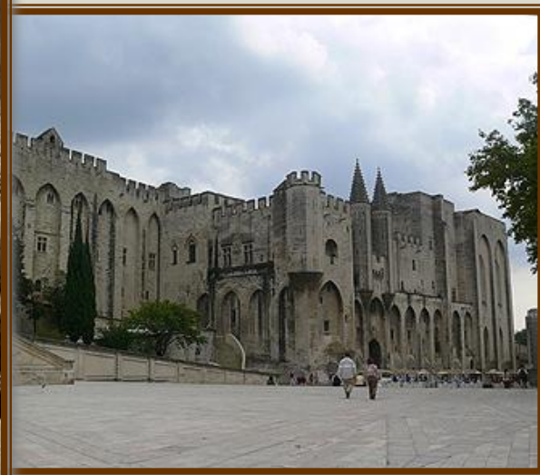
Авіньйон , де Петрарка ру