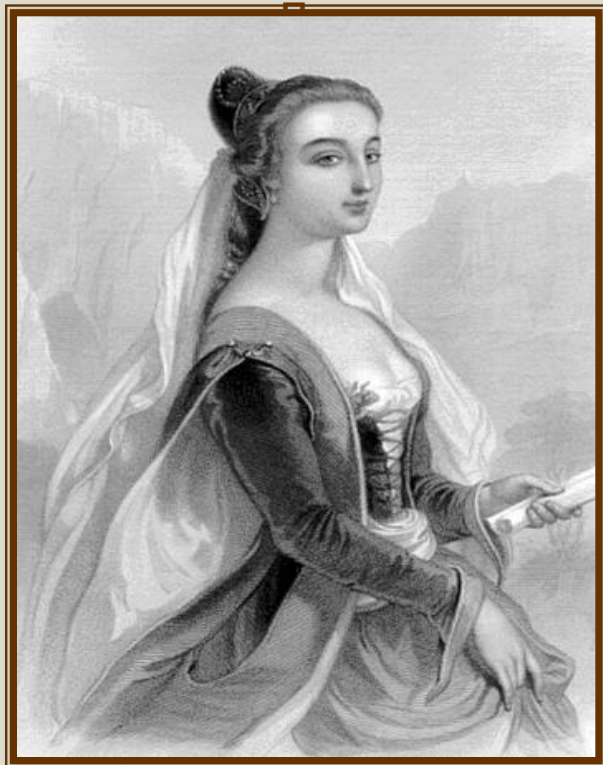
Laure De Noves

Петрарка ідеалізує Лауру, робить її осередком всяких досконалостей, констатує очищає й облагороджує дію її краси на його психіку.