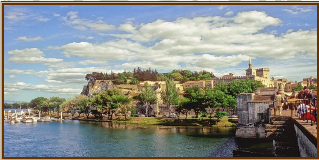
Місто Франческо и