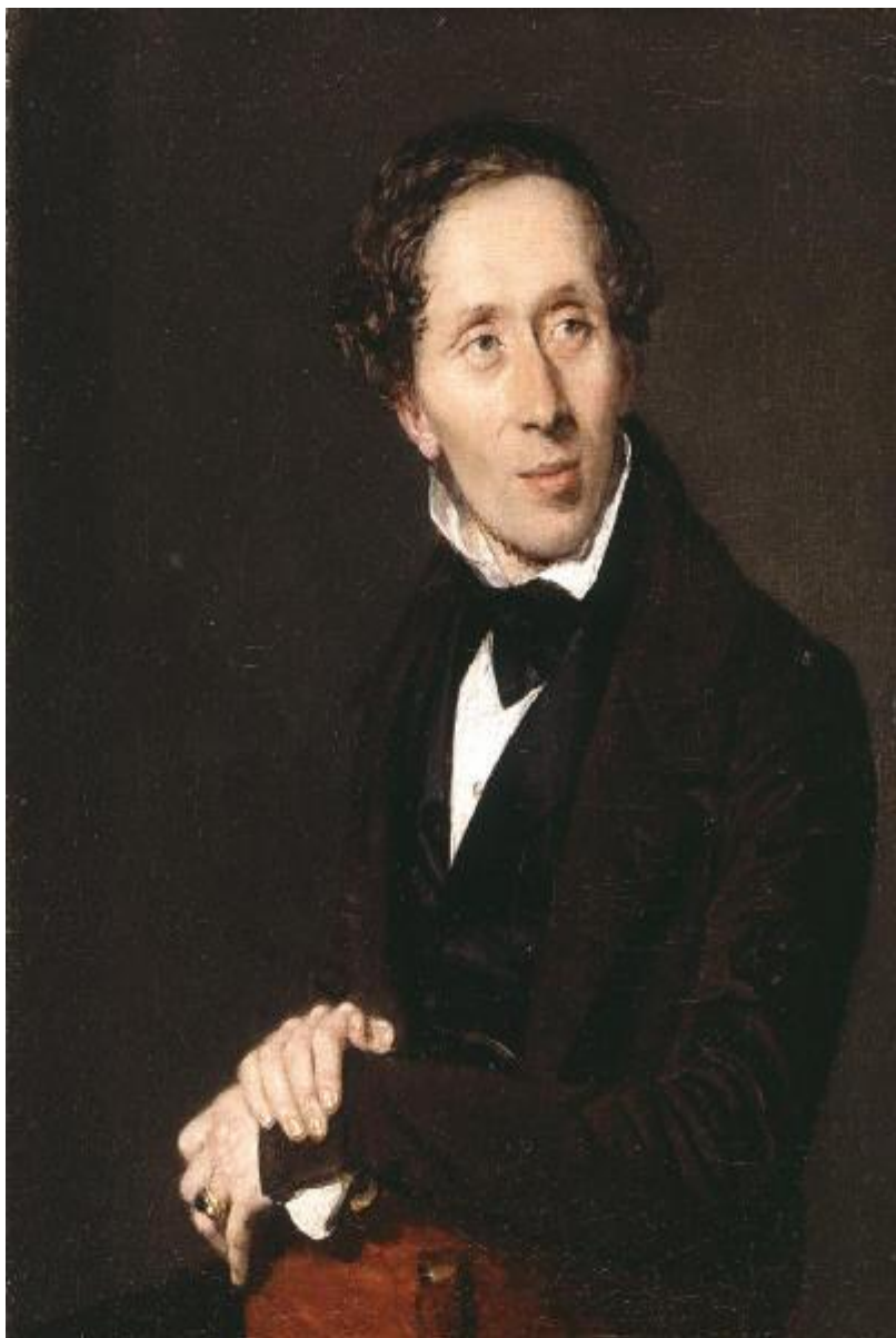
Ганс Христиан Андерсен 1805 -1875 г.