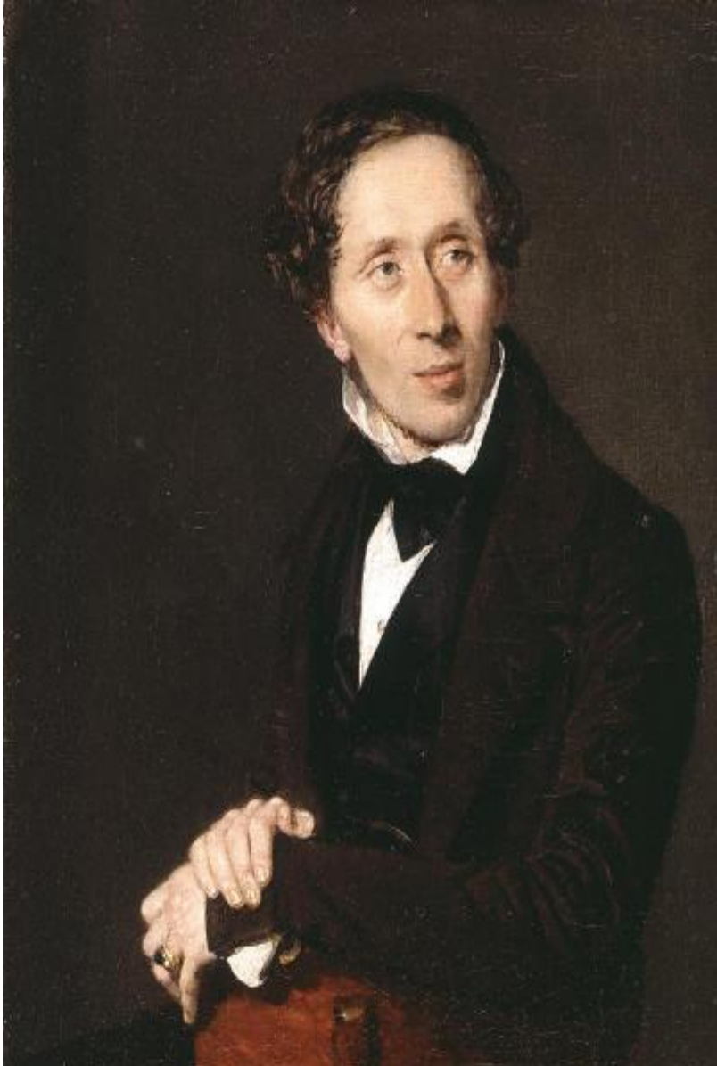
Ганс Христиан Андерсен 1805 -1875 г.