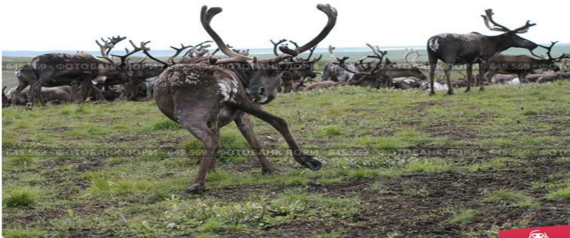
Стадо северных оленей пасущихся в тундре

Болотистые пастбища используются в северных районах нашей страны или лесотундре.