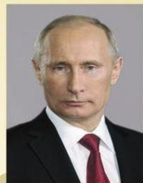
Президент Российской Федерации - Путин Владимир Владимирович

Славься, Отечество наше свободное - Братских народов союз вековой. Предками данная мудрость народная. Славься, страна! Мы гордимся тобой!