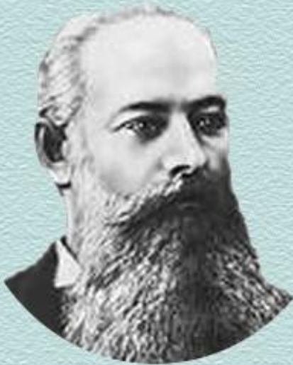
Василий Васильевич Докучаев

Долгое время существовало мнение, что почва – это горная порода.