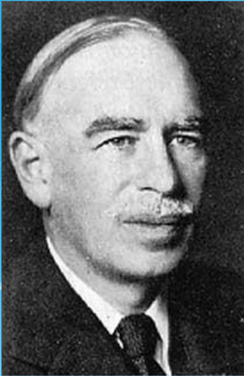
Джон М. Кейнс английский ЭКОНОМИСТ