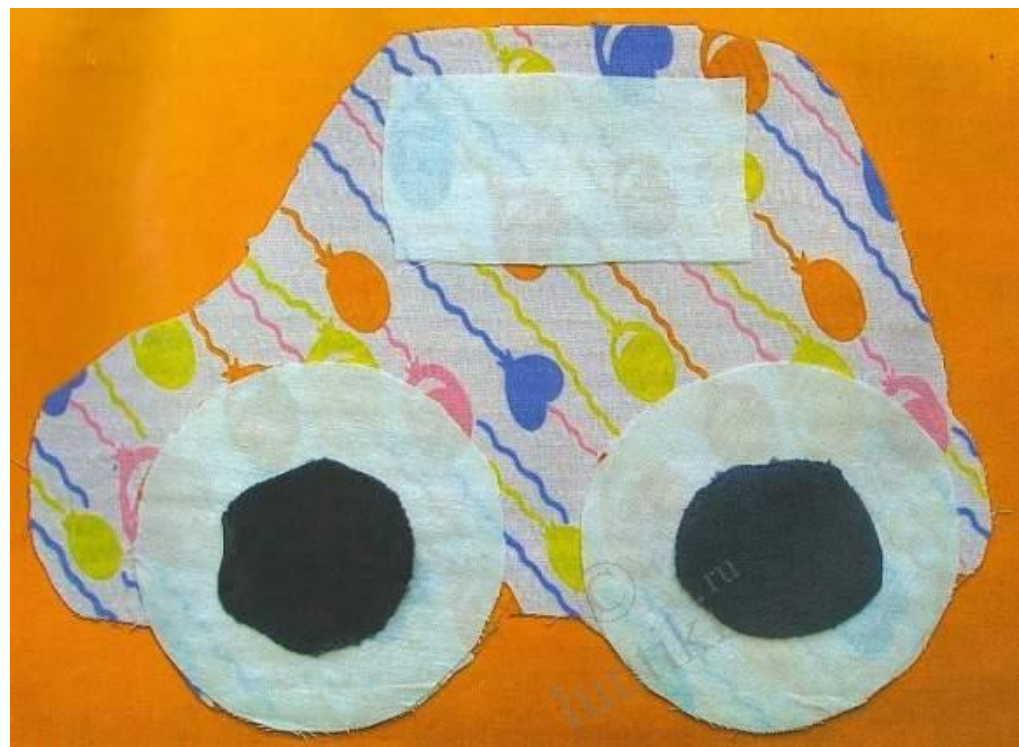
Вариант с машиной