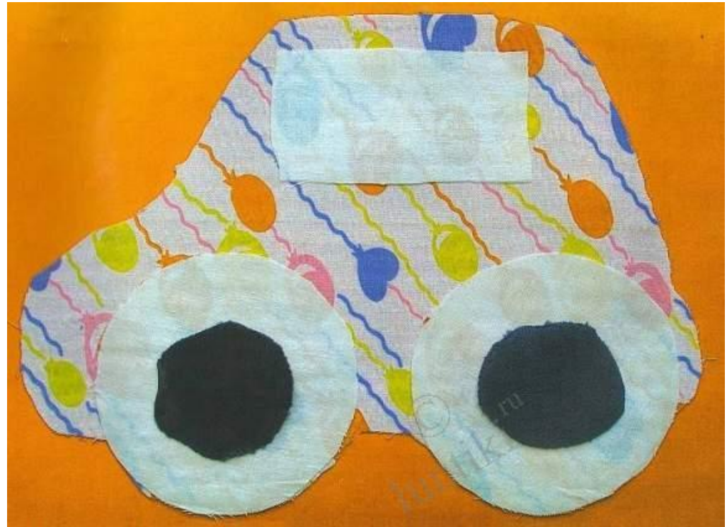
Вариант с машиной