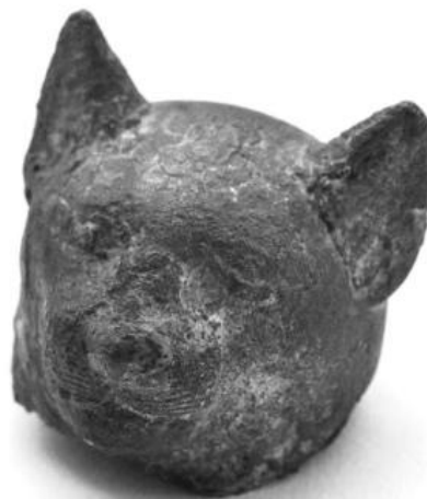
Фрагмент статуэтки кошки (бронза), I-е тысячелетие до нашей эры. Любимый экспонат ученого кота Марсика.

Другой не менее загадочный экспонат представляет собой деревянную статуэтку