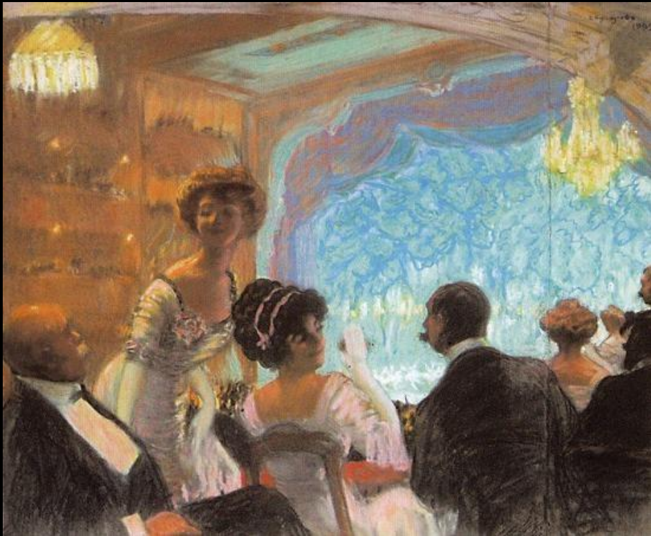
Помпезная аристократия вплоть до конца XIX века