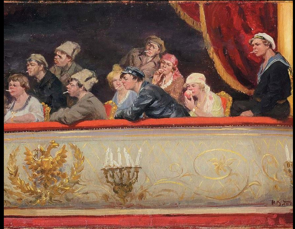
«Широкая публика» или как тебя видит артист во время спектакля