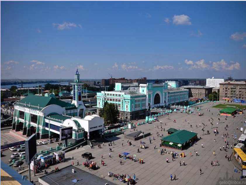
Площадь в Новосибирске им. Гарина Михайловского

НОВОСИБИРЦЫ УВЕКОВЕЧИЛИ ПАМЯТЬ О Н. Г. ГАРИНЕ-МИХАЙЛОВСКОМ, ПРИСВОИВ ЕГО ИМЯ ПРИВОКЗАЛЬНОЙ ПЛОЩАДИ, СТАНЦИИ МЕТРО, ШКОЛЕ, ОДНОЙ ИЗ БИБЛИОТЕК ГОРОДА.