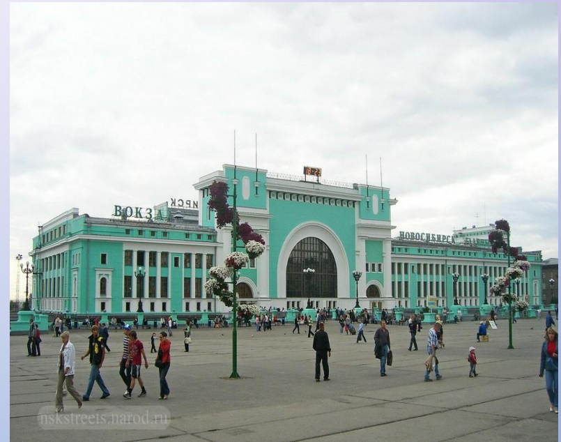
Железнодорожный вокзал Им. Гарина-Михайловского