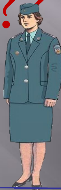
ИФНС (2,4,5 ОЧЕРЕДЬ)