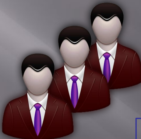
ТЕКУЩИЕ КРЕДИТОРЫ (3 ОЧЕРЕДЬ)