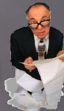
ТЕКУЩИЕ КРЕДИТОРЫ (2 ОЧЕРЕДЬ)