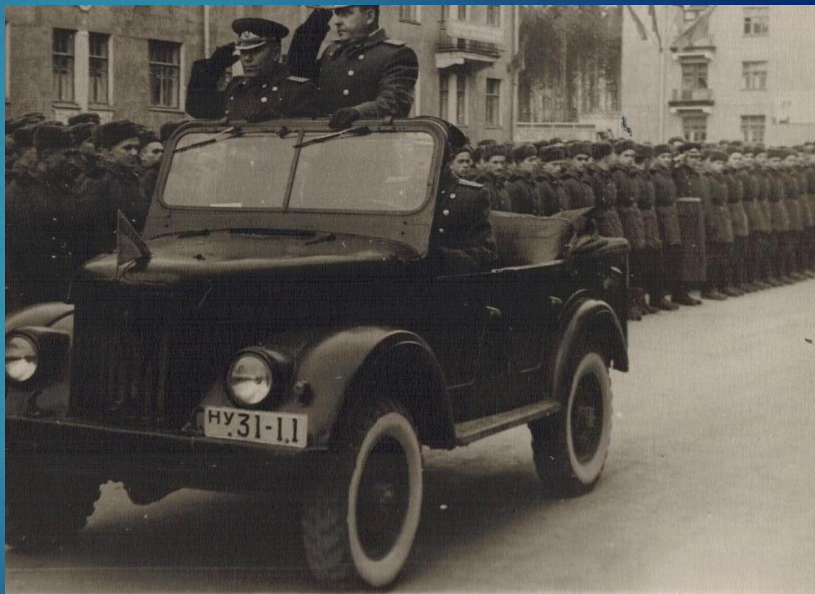
Парад военных строителей 1 мая 1960 года