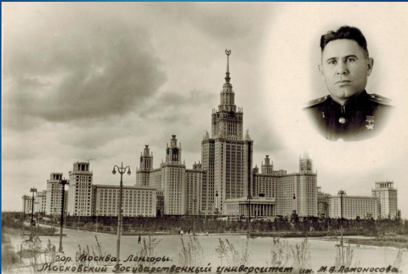
гор. Москва. Ленгоры. Московский Государственный университет им. М.В.Ломоносова.