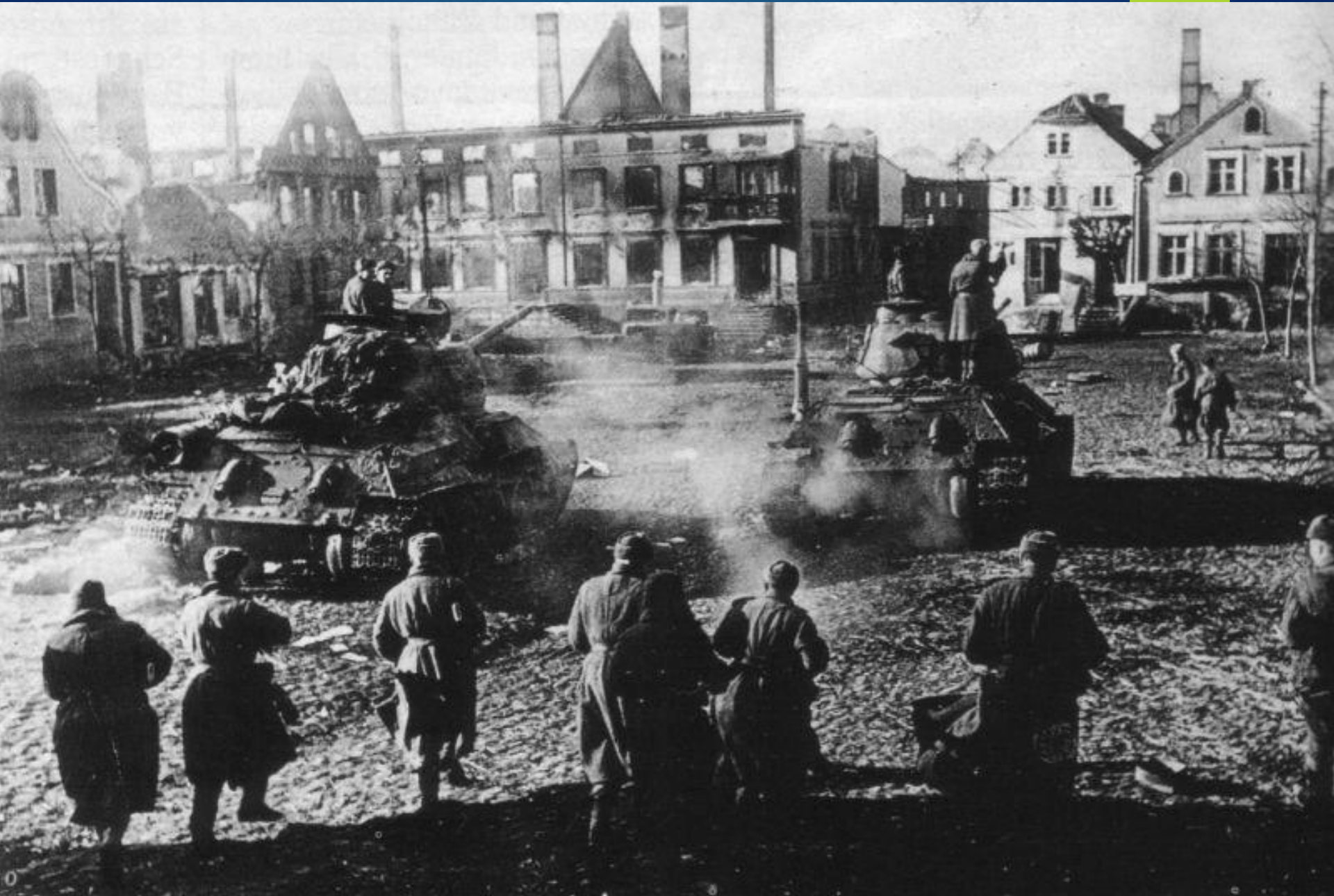
Советские войска входят в город Фрауенбург