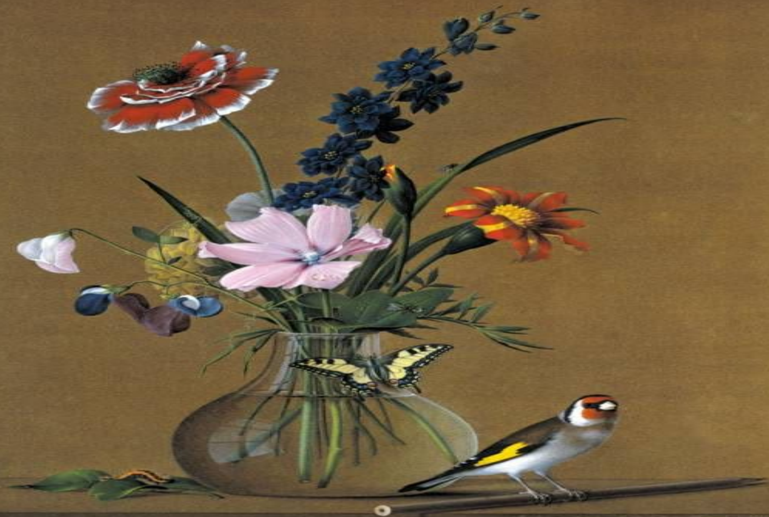
«Букет цветов, бабочка и птичка» (Ф. П. Толстой)