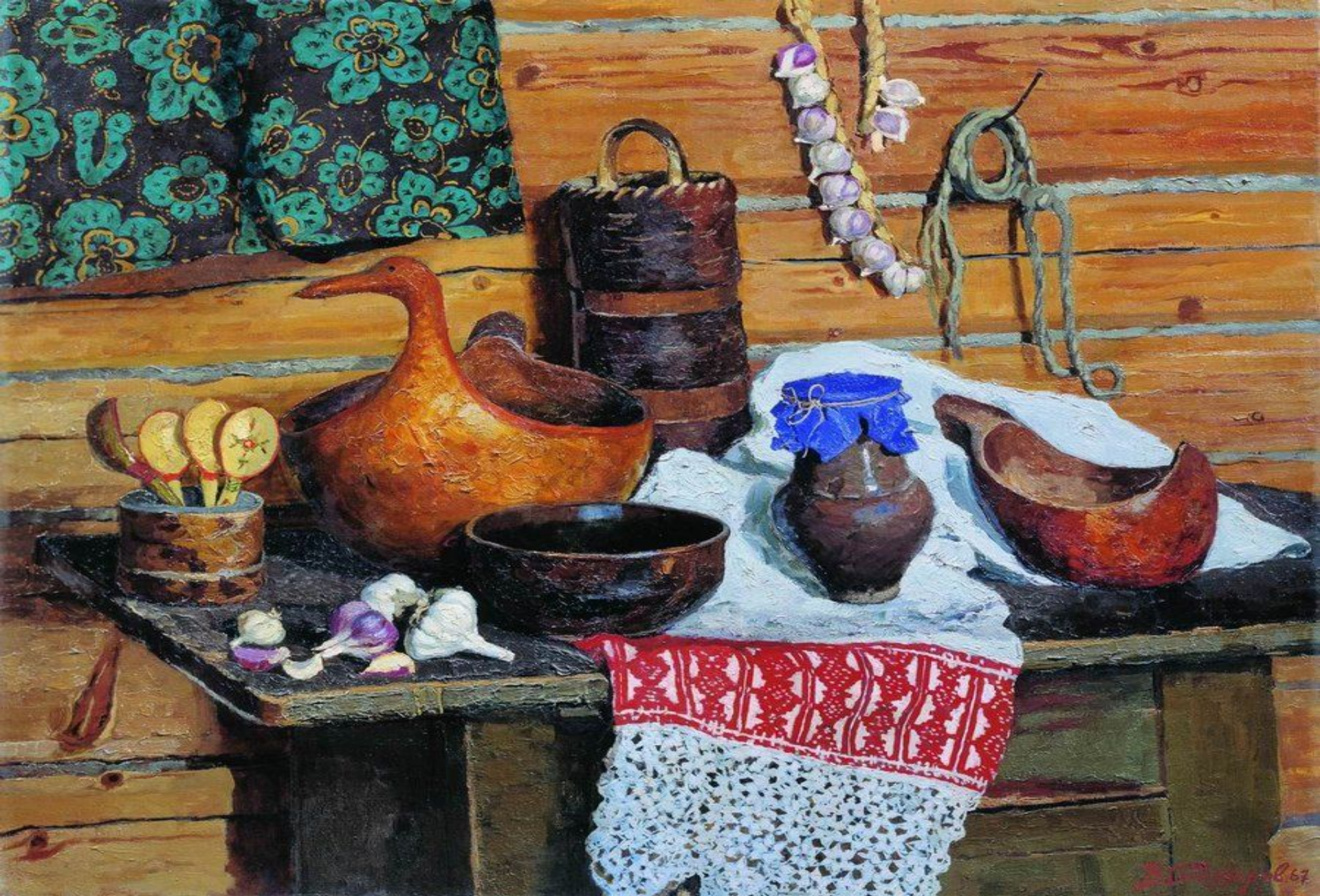
«Натюрморт. Квас» (В. Ф. Стожаров)