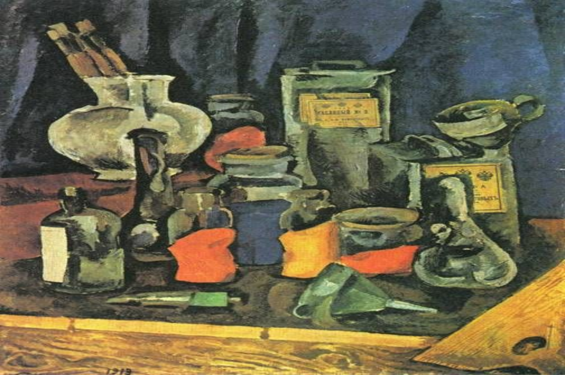
«Сухие краски» (П. П. Кончаловский)