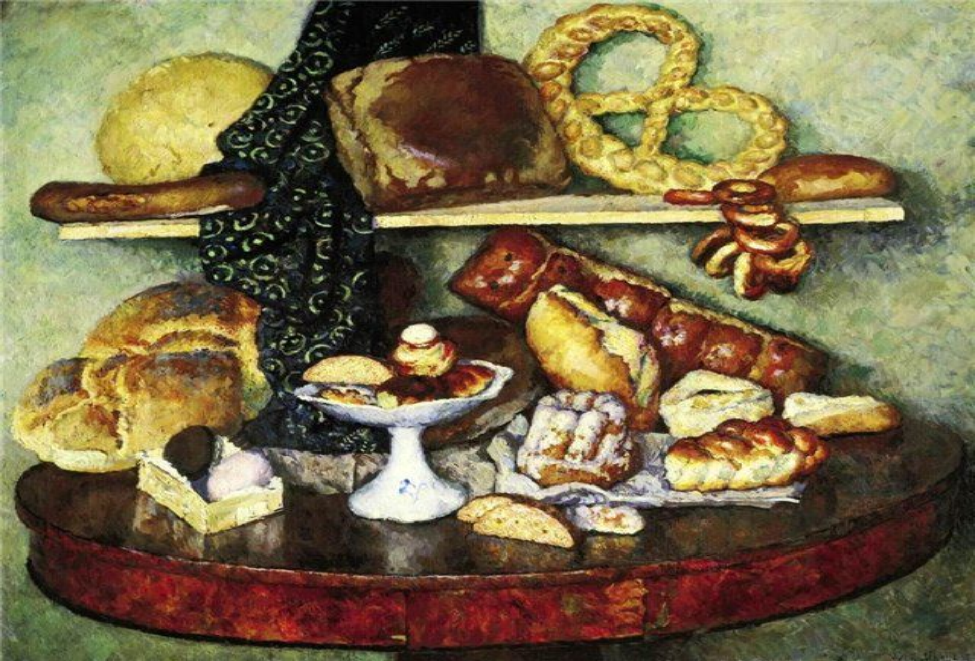
«Снедь московская: хлебы» (И. И. Машков)