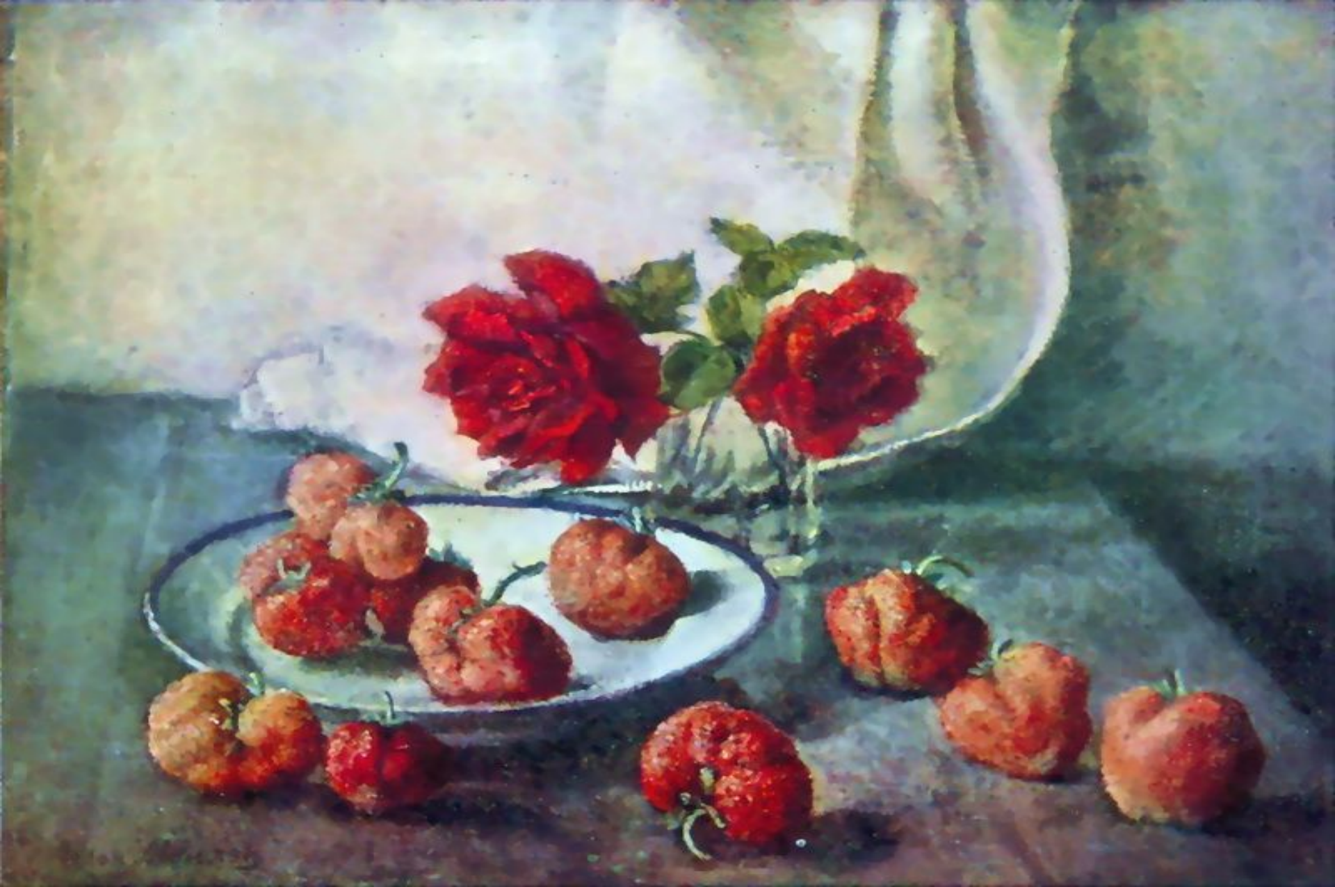
«Две темные розы и тарелка с клубникой»(И. И. Машков)