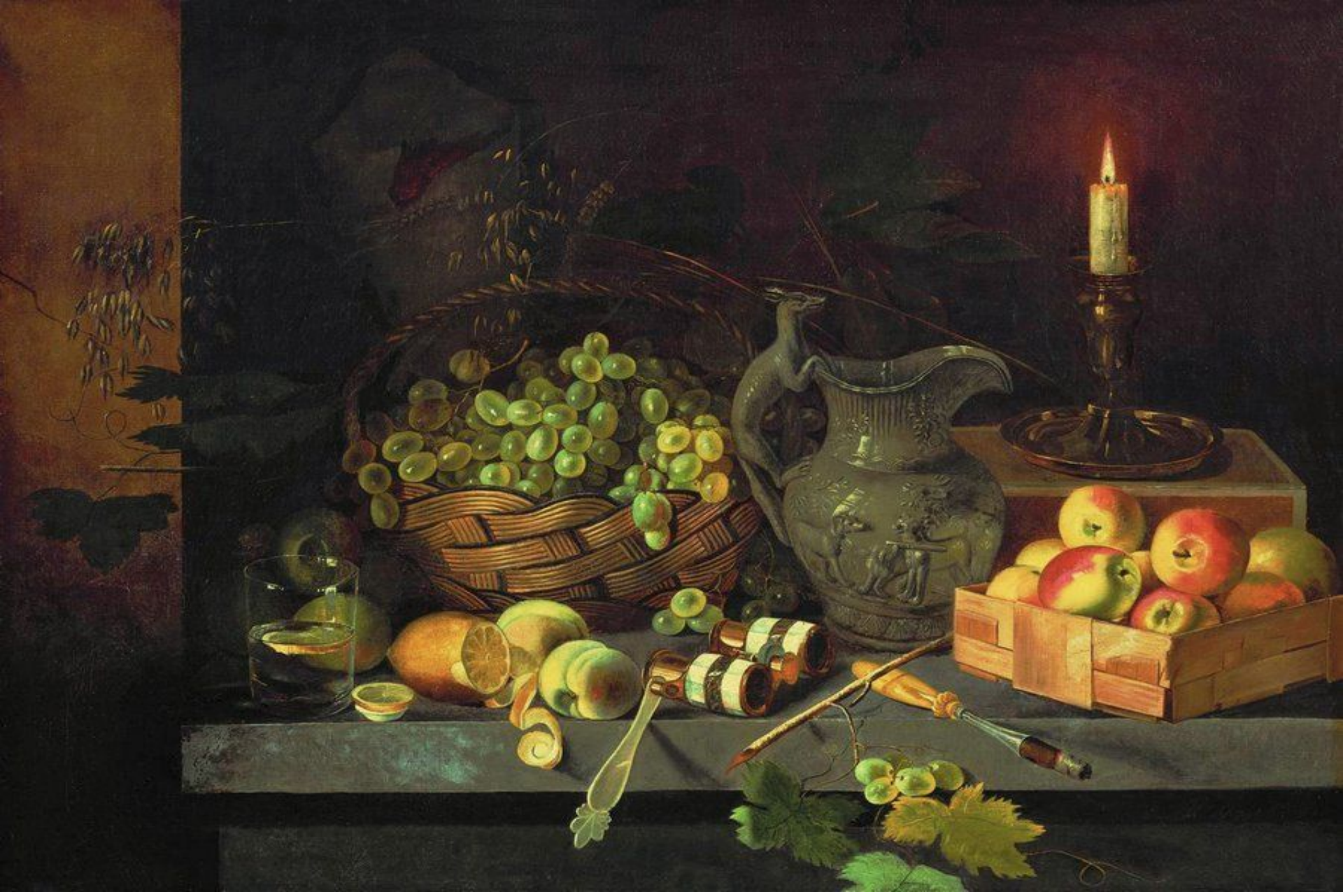
«Натюрморт со свечой» (И. Т. Хруцкий)