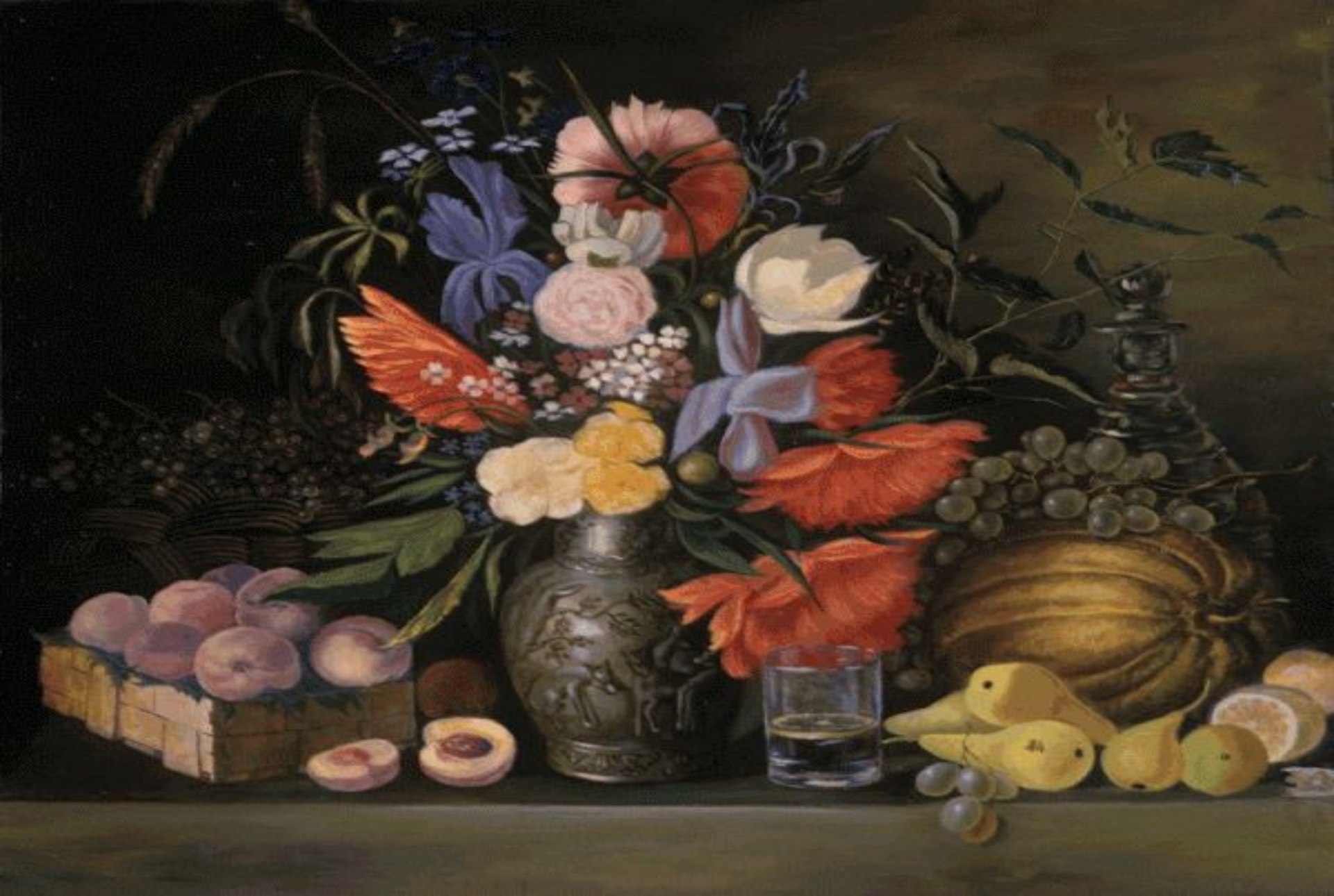
«Цветы и плоды» (И. Т. Хруцкий)