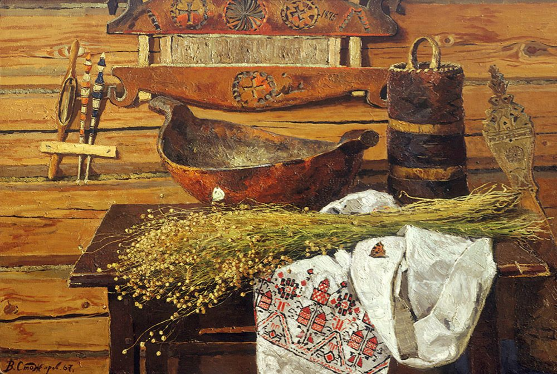
«Лён» (В.Ф. Стожаров)