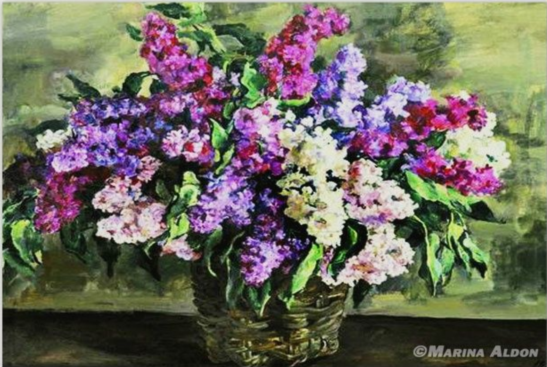
«Сирень в корзине» (П.П. Кончаловский)