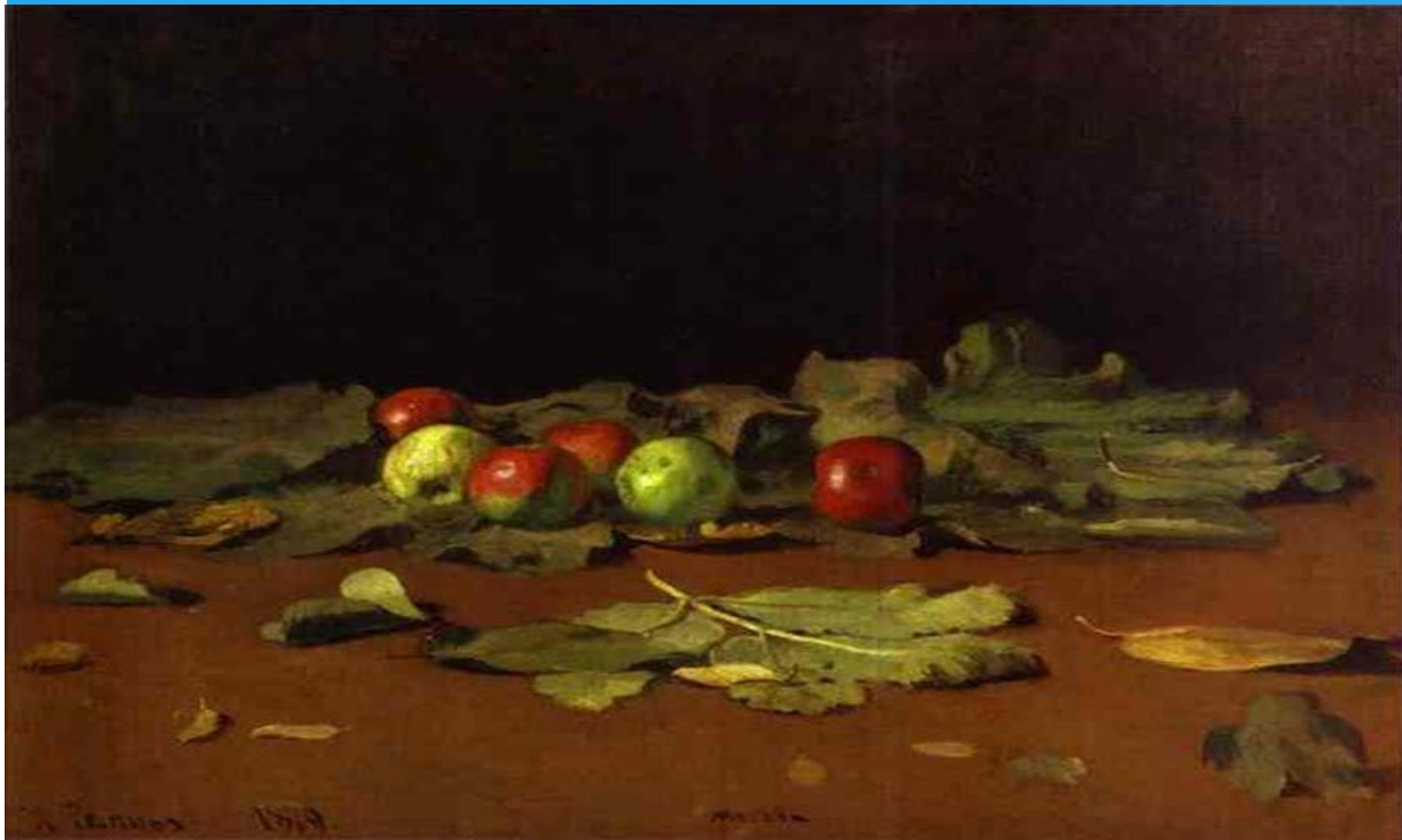
«Яблоки и листья» (И. Е. Репин)