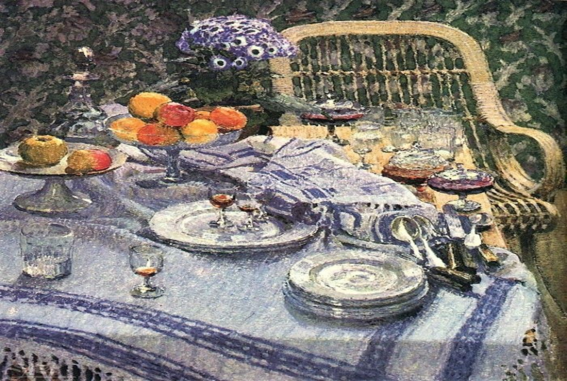
«Неприбранный стол» (И. Э. Грабарь)