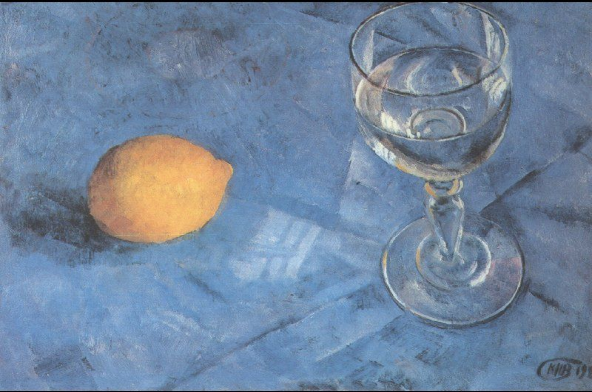
«Бокал и лимон» (К. С. Петров – Водкин)