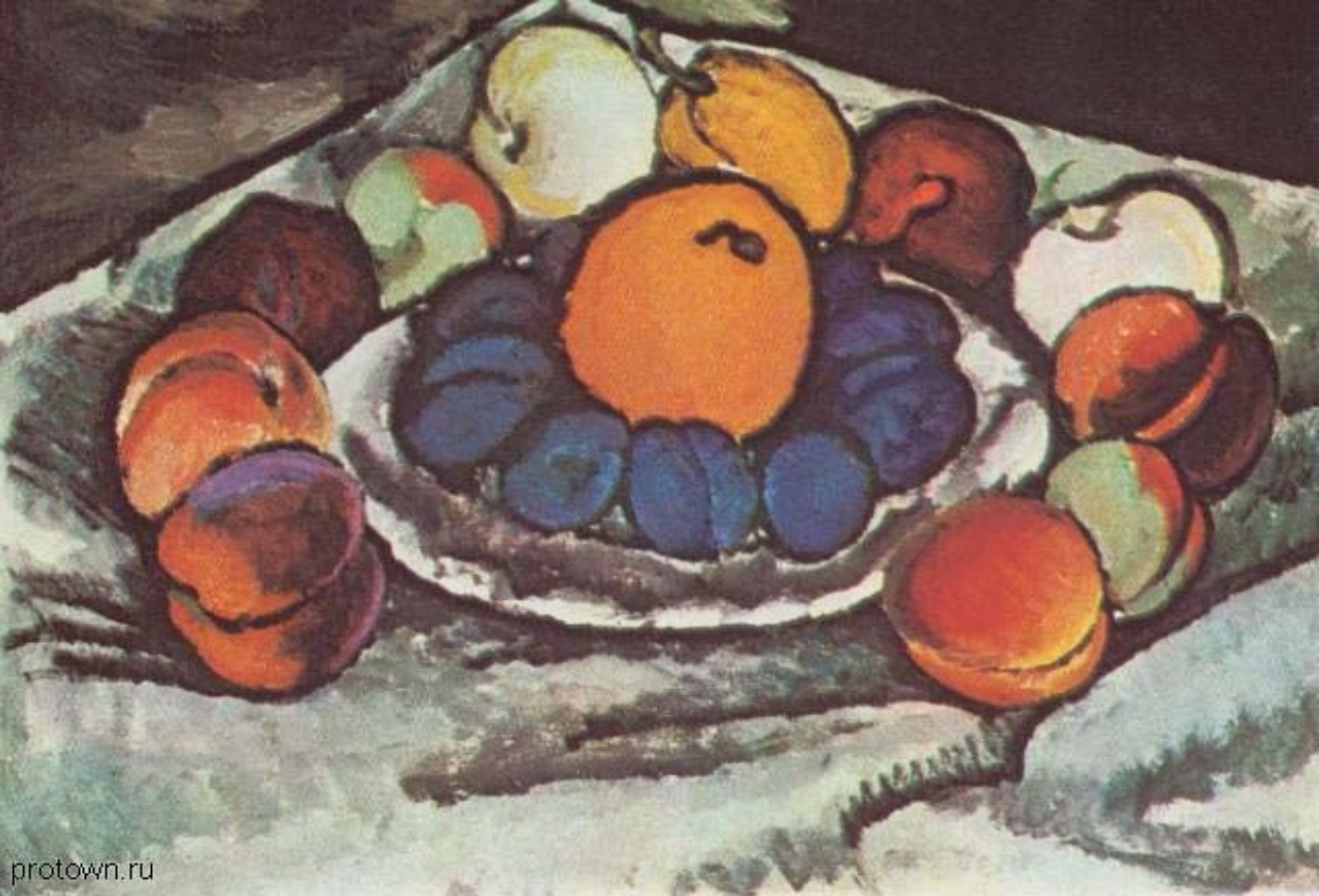
«Натюрморт. Синие сливы» (И. И. Машков)