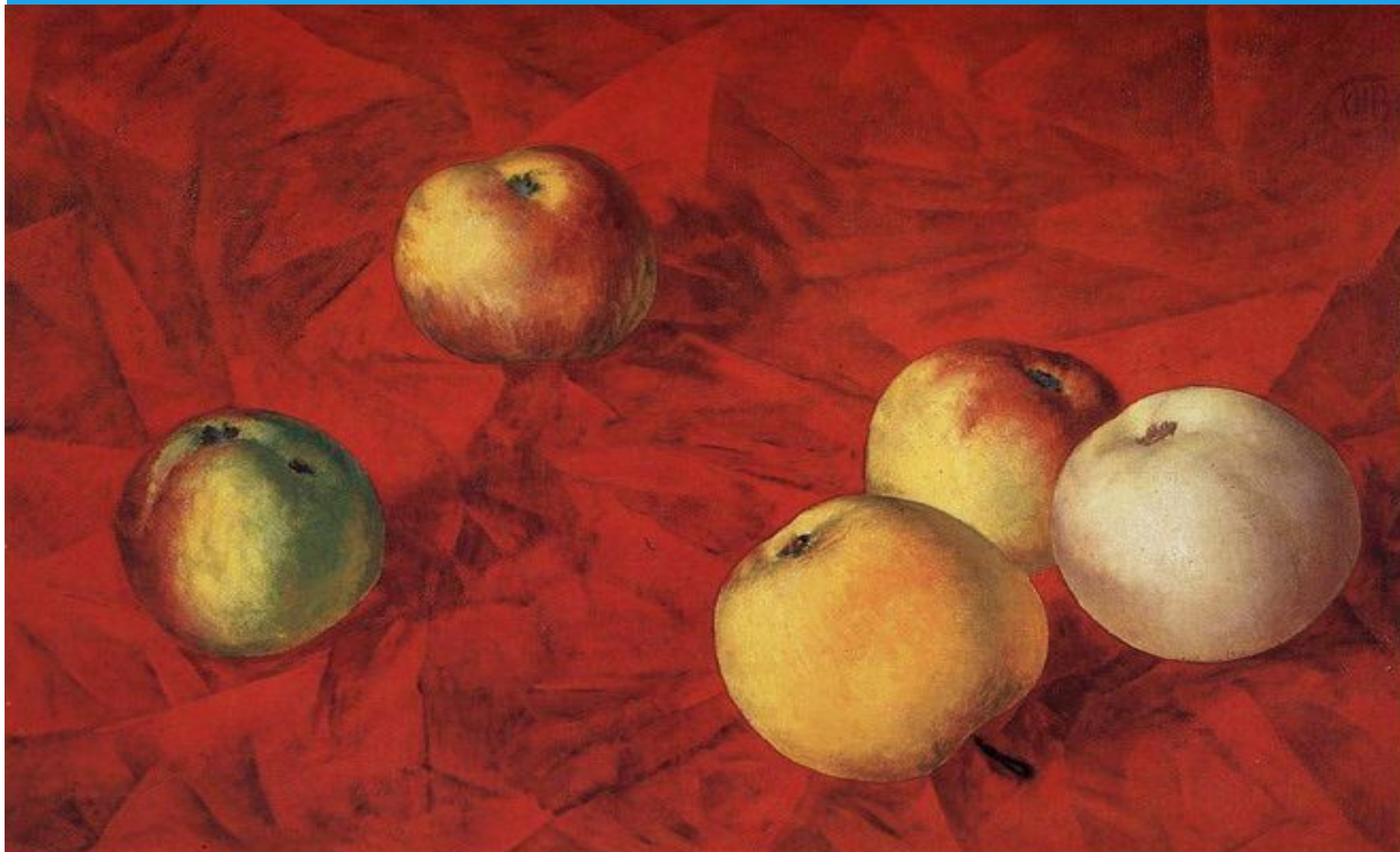
«Яблоки на красном фоне» (К.С. Петров-Водкин)