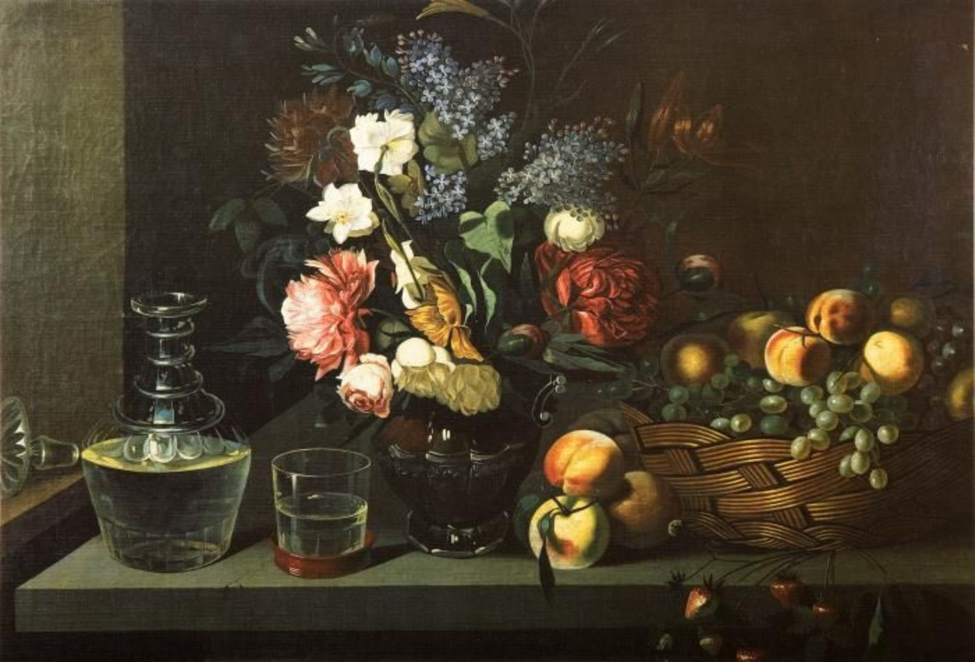
«Натюрморт» (фрагмент) (И. Т. Хруцкий)