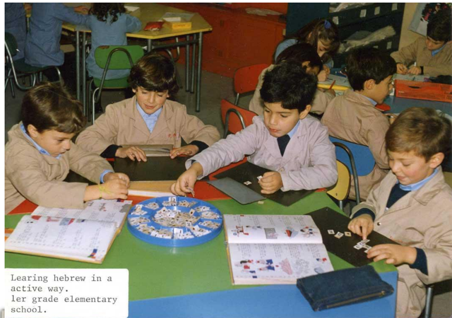
Learning hebrew in a active way. ler grade elementary school.

Какие приемы активизации используете Вы?