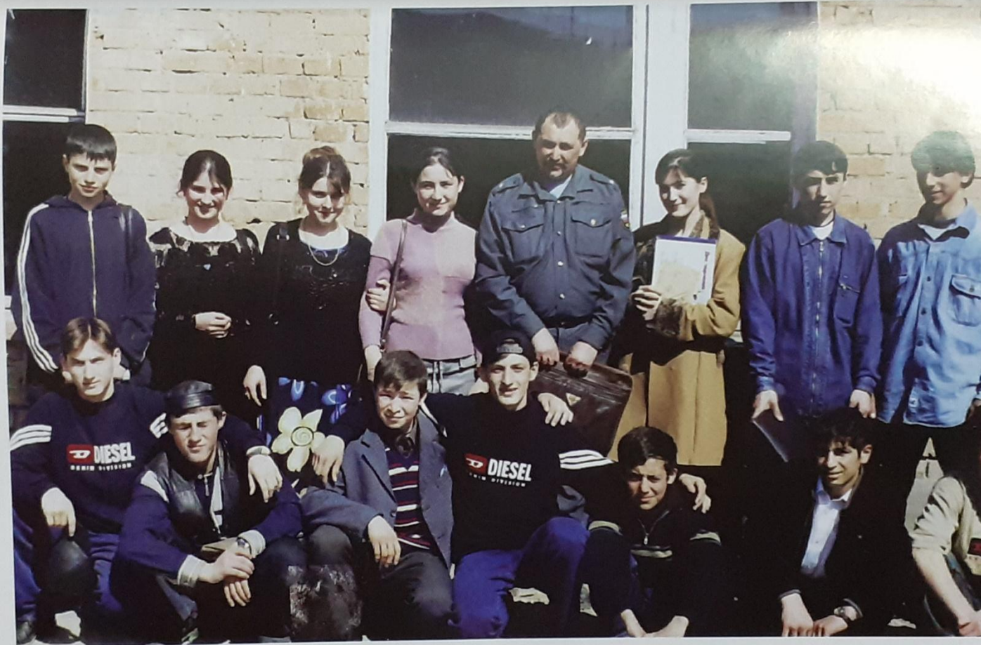
Фото на память с 9-м классом местной школы. После беседы

В последствии неоднократно приходил в школу, проводил встречи со старшеклассниками и педагогами.