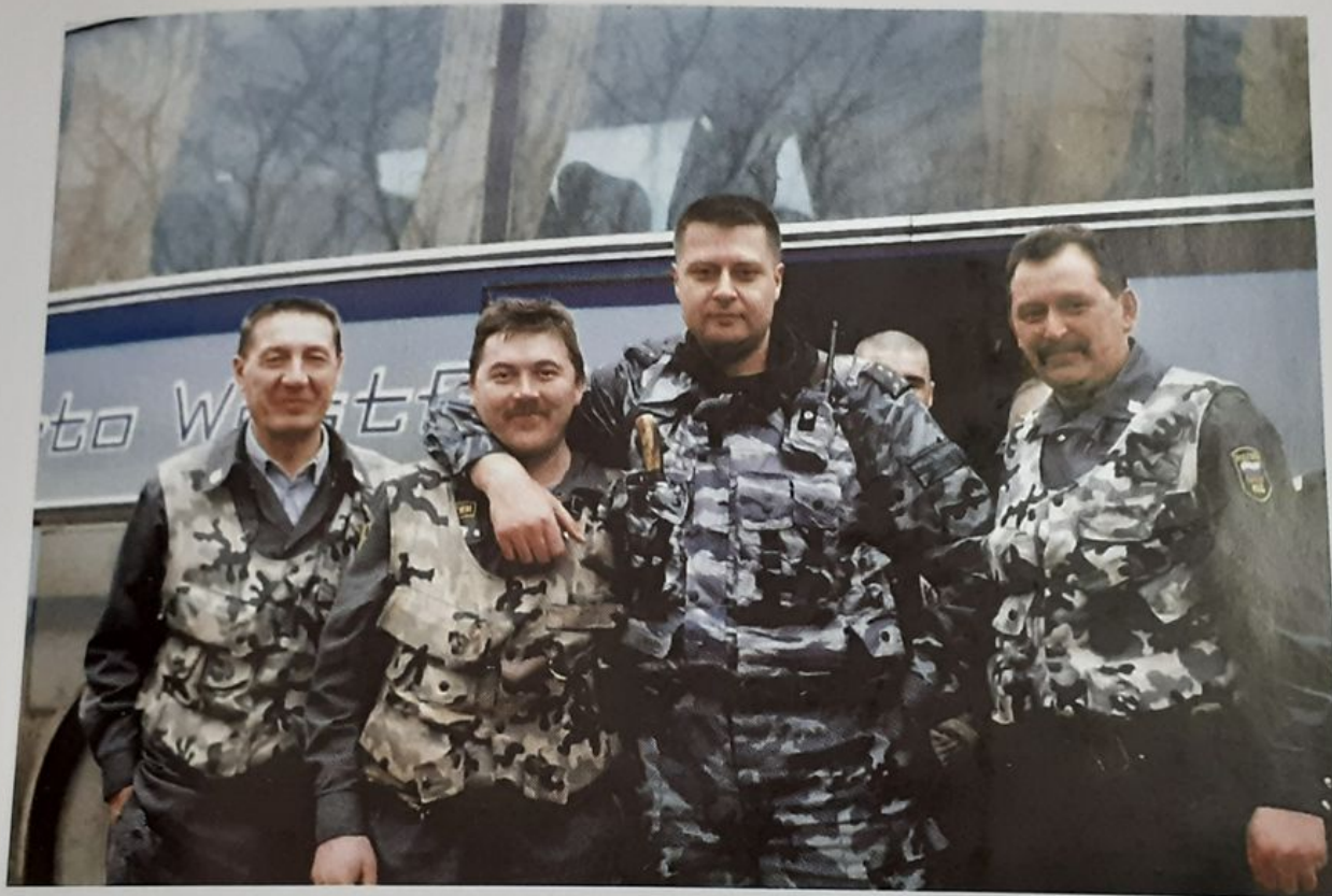
Фото с командиром. Один из привалов по пути в Чечню

В книге автор подробно повествует о том как сводный отряд милиции особого назначения был отправлен для выполнения контртеррористической операции на территории Чечни.