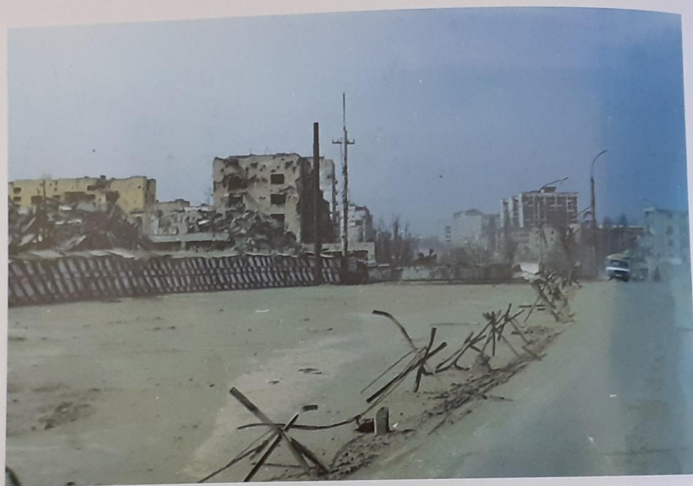
Проскакиваем площадь Минутка. Это здесь мы шагали пешком