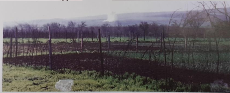
Мгновение. Впереди – разорвавшийся снаряд

Читая книгу, даже людям далёким от армии, зачастую не понимая всех военных терминов, всё равно можно прочувствовать весь ужас той войны, весь масштаб военных действий, то вечное напряжение в котором находились бойцы, бойцы, боясь наверное шальной пули, чувствуя холодок по спине от недоброго, злобного взгляда горцев.