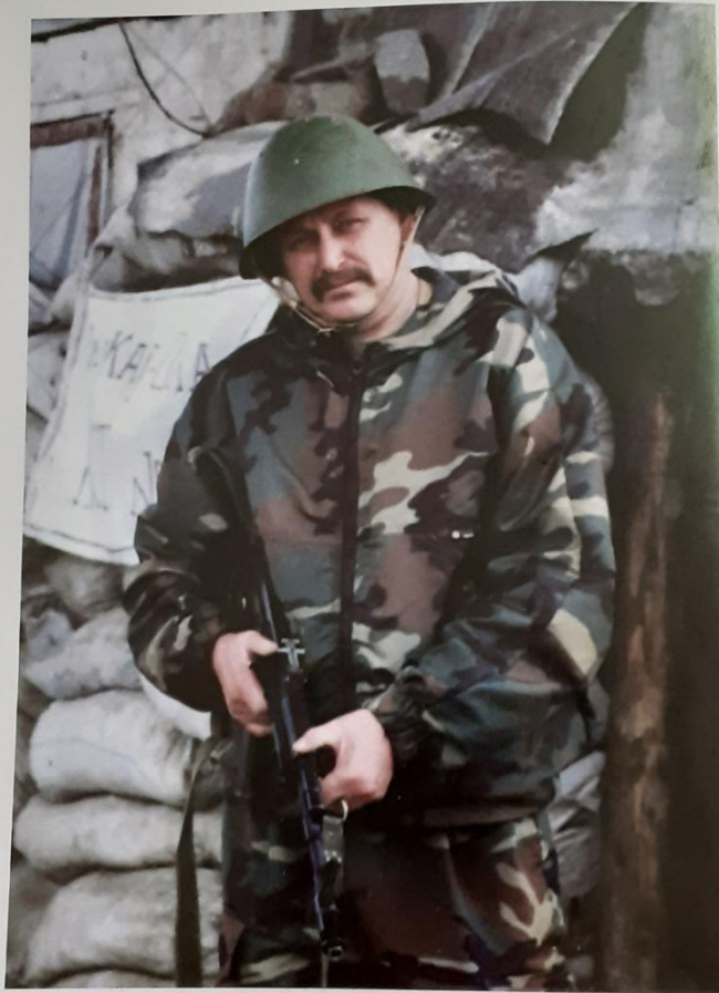
Перед боевым заданием

Я вновь в твоих объятиях, мой Кавказ, А ты такой же грозный, как и прежде. Пришел к тебе я выполнить приказ, Пришел к тебе, но только не из мести.