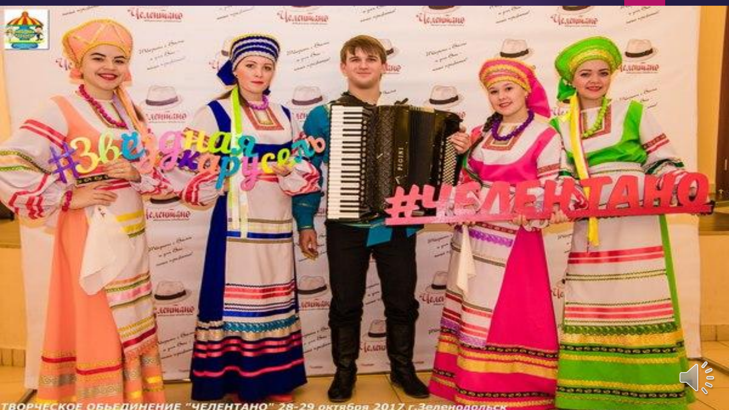
ТВОРЧЕСКОЕ ОБЪЕДИНЕНИЕ "ЧЕЛЕНТАНО" 28-29 октября 2017 г. Зеленодольск