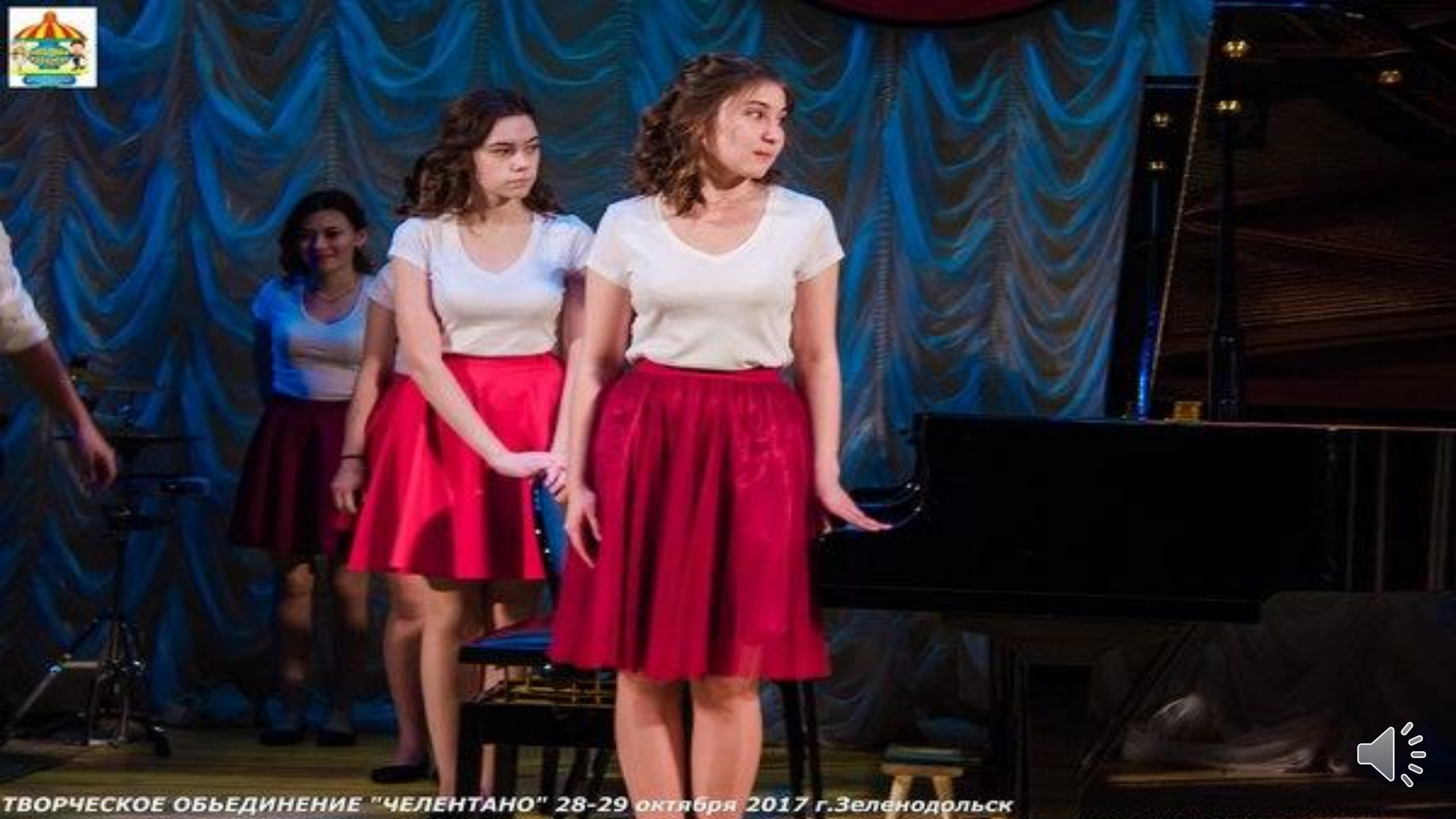
ТВОРЧЕСКОЕ ОБЪЕДИНЕНИЕ "ЧЕЛЕНТАНО" 28-29 октября 2017 г. Зеленодольск