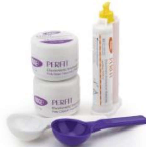
Trial Kit 01