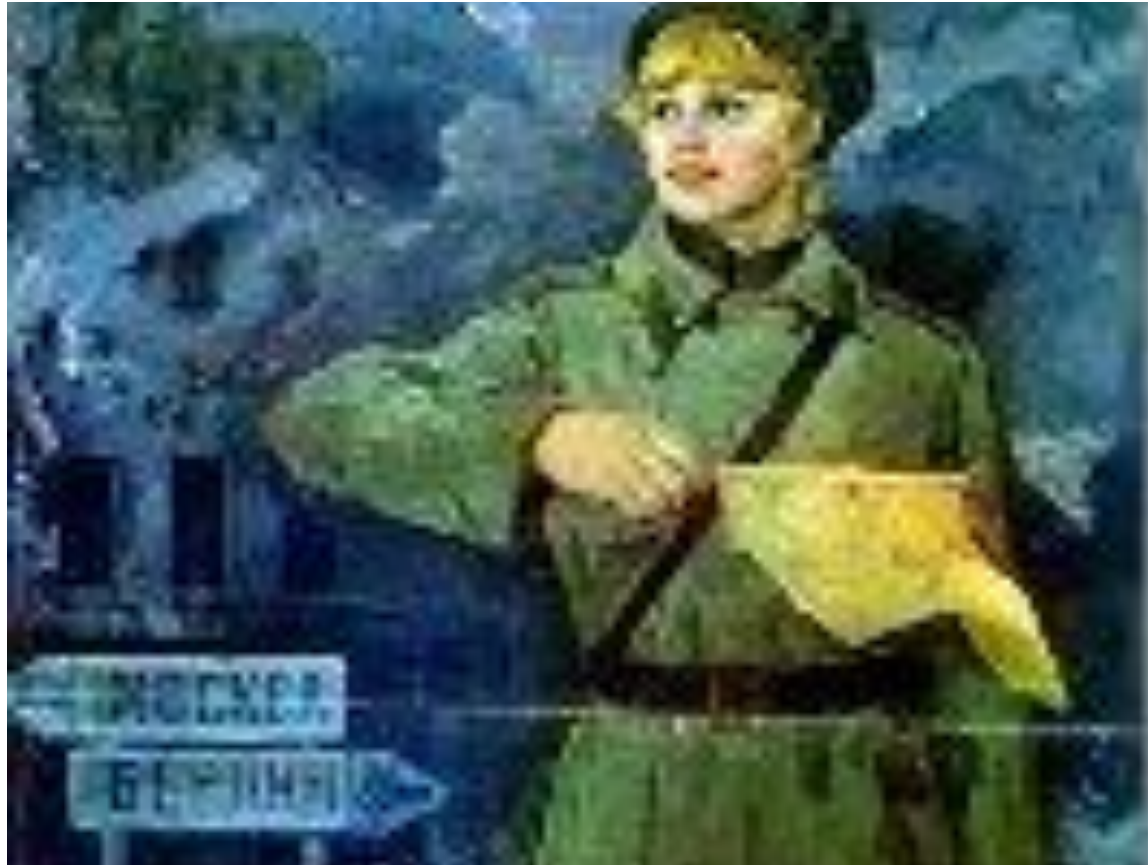
Дорога на Берлин