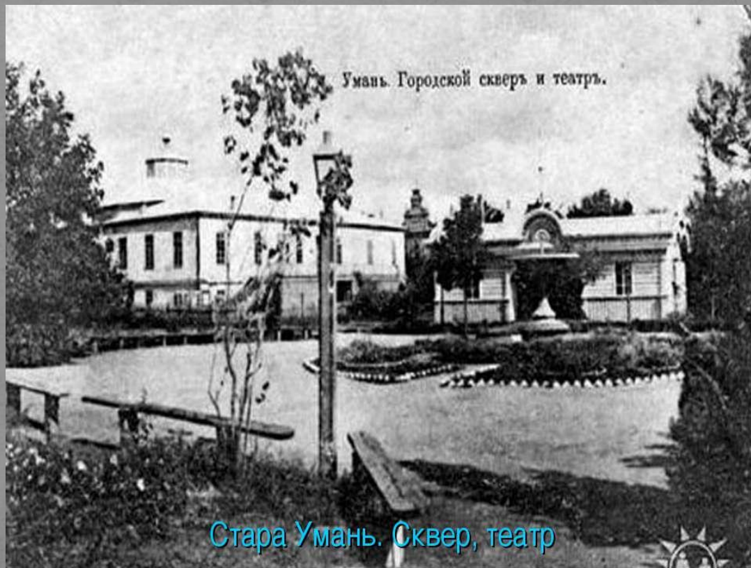
Стара Умань. Сквер, театр

Спочатку театр мав назву «Зимовий», тому що, певно, ще продовжував своє існування і літній театр. Його було споруджено на перехресті Київської і Костельної вулиць, до нього приєднувався міський сквер.