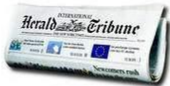
THE WORLD'S DAILY NEWSPAPER