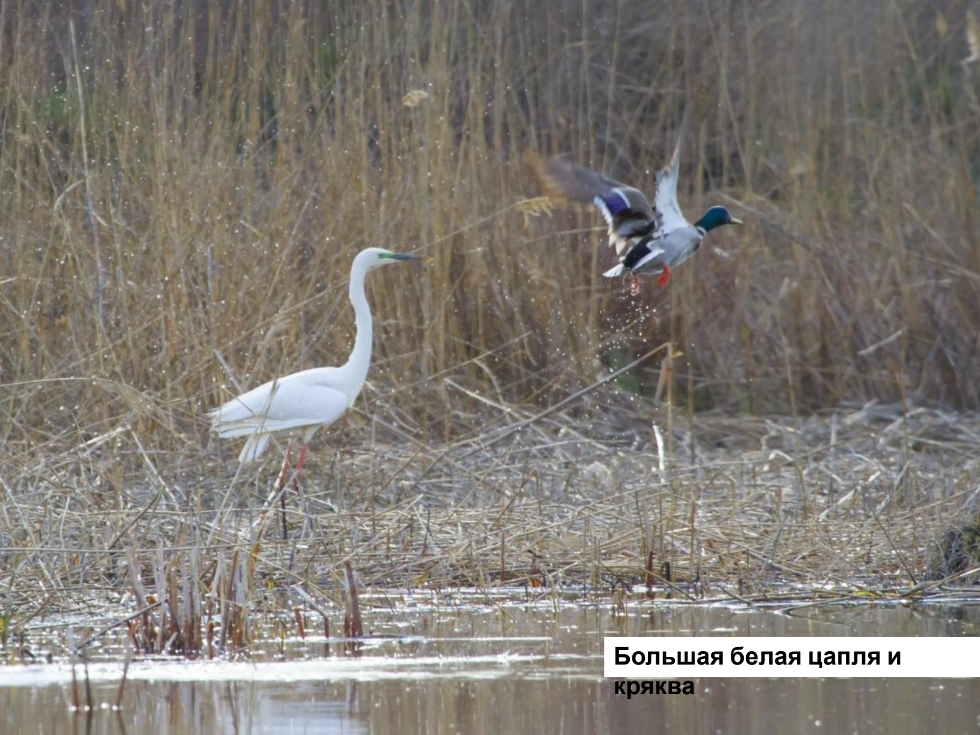
Большая белая цапля и кряква