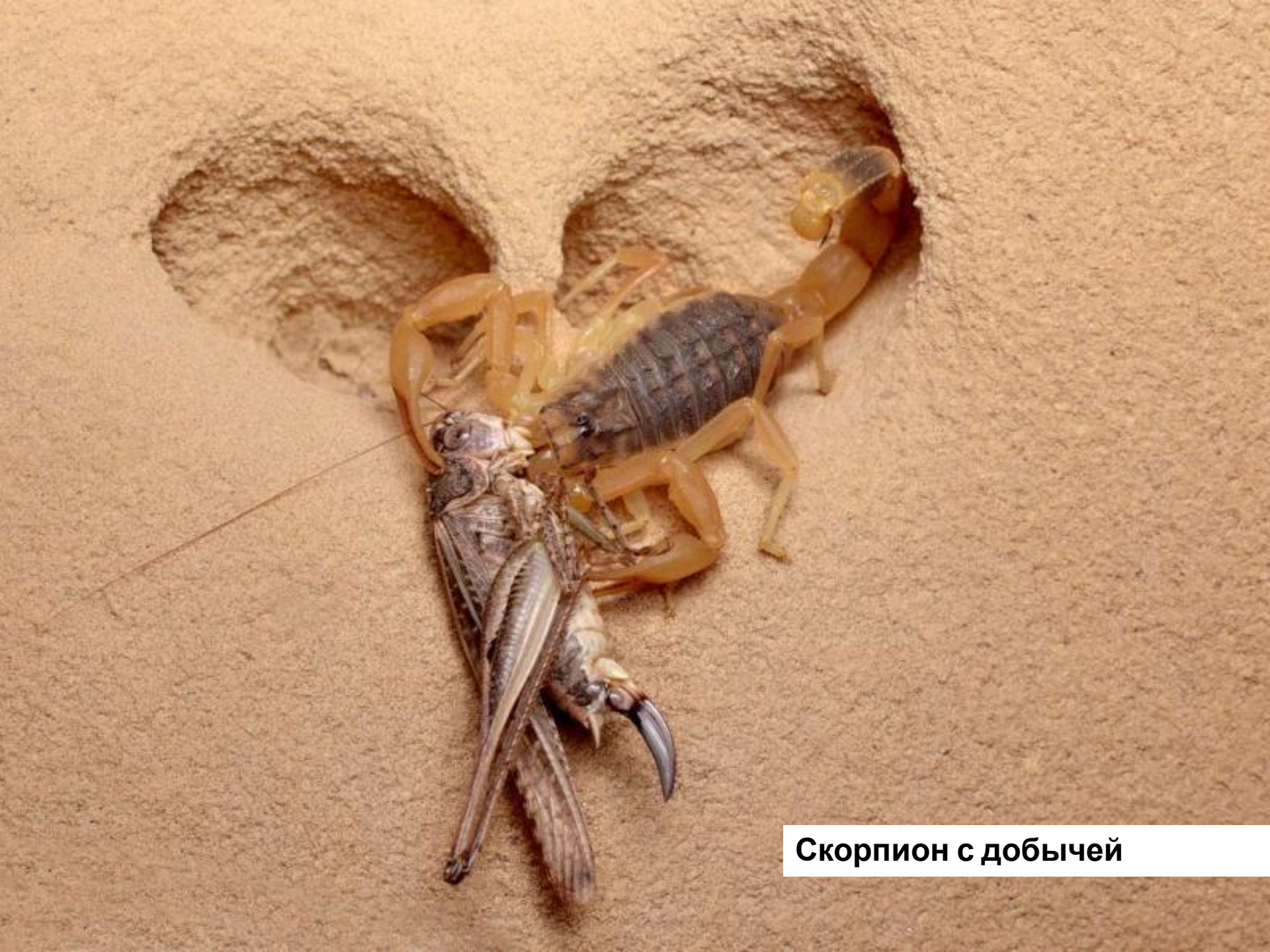
Скорпион с добычей