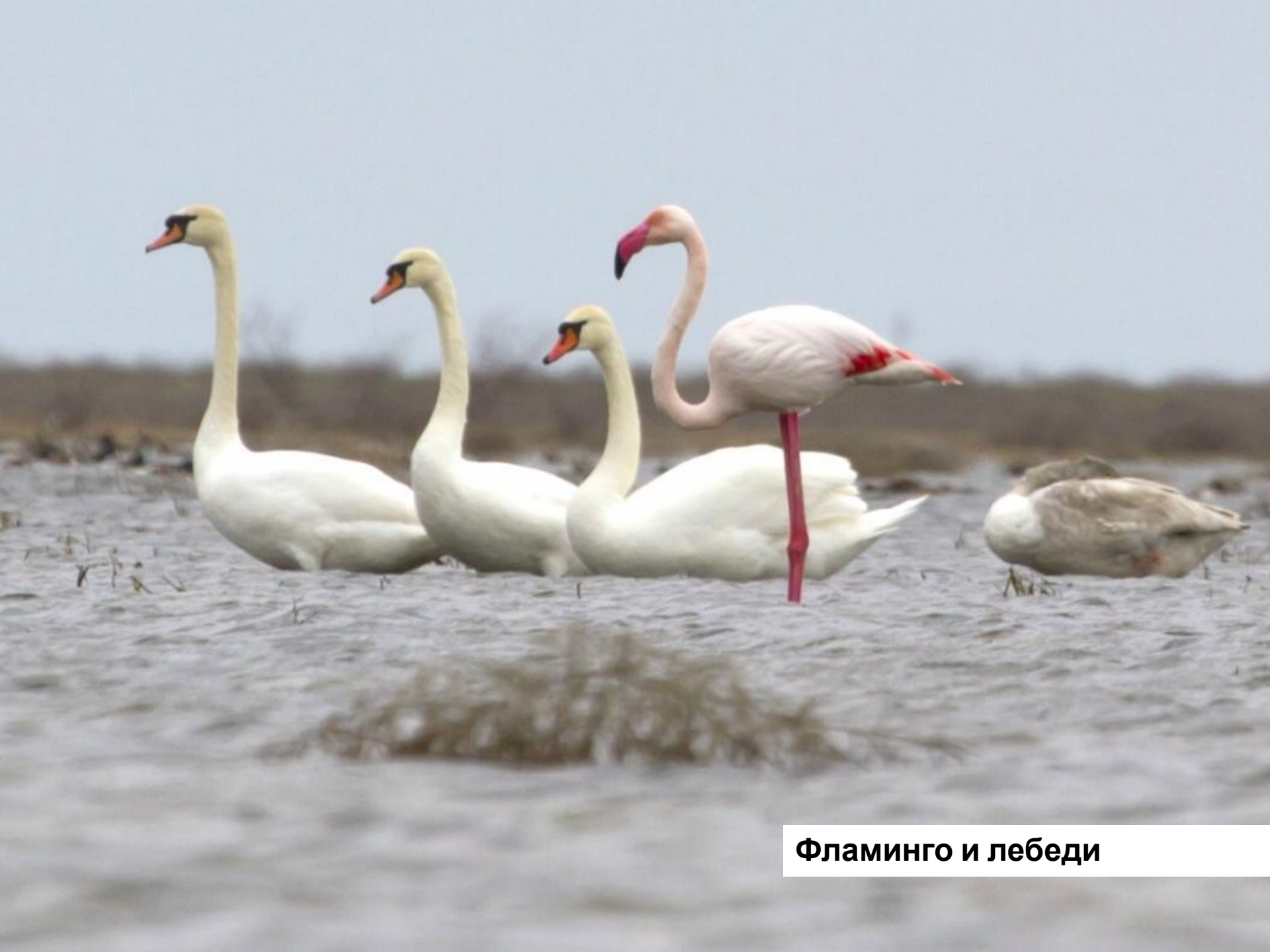
Фламинго и лебеди