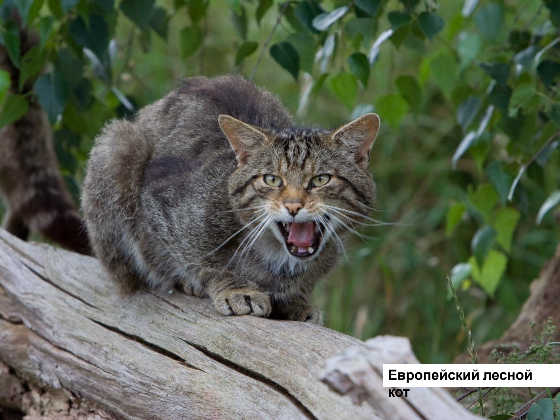
Европейский лесной КОТ