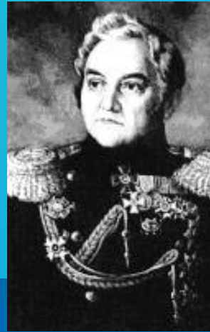
Лазарев Михаил Петрович (3 (14).11.1788. — 11 (23).04.1851).