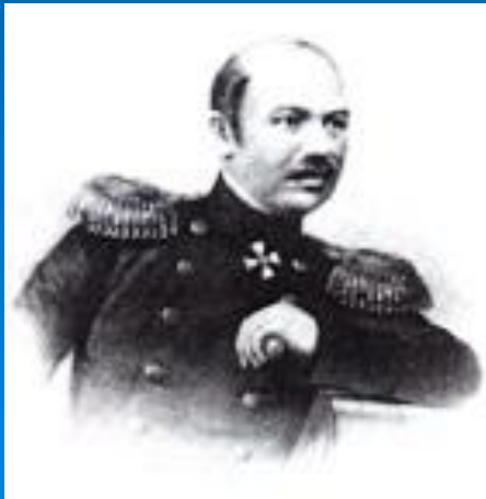
Истомин Владимир Иванович (6(18).03.1809 г. — 7(19).03.1855 г.).