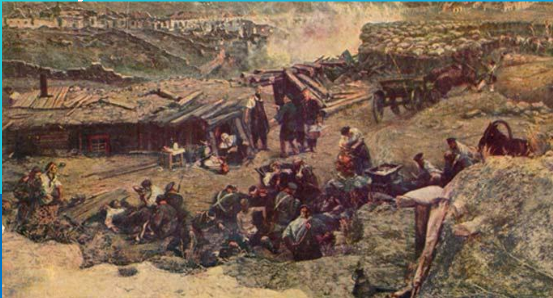
Оборона Севастополя. Фрагмент панорамы. Худ. Ф. Рубо.