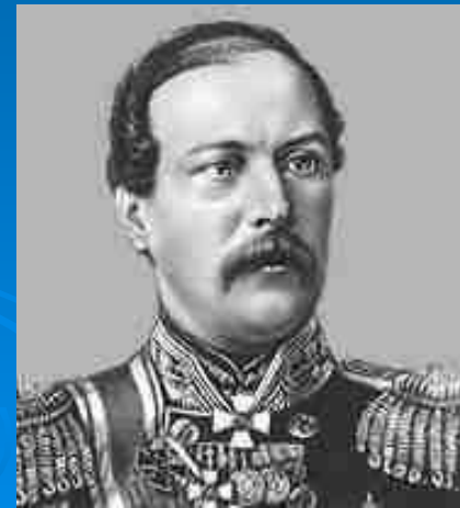
Тотлебен Эдуард Иванович (8(20).5.1818, — 19.6(1.7).1884).