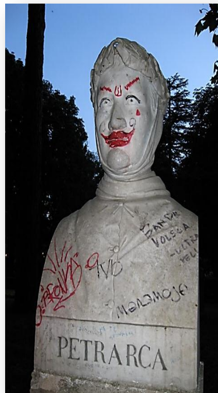
СОВРЕМЕНН ЫЙ ВАНДАЛИЗМ