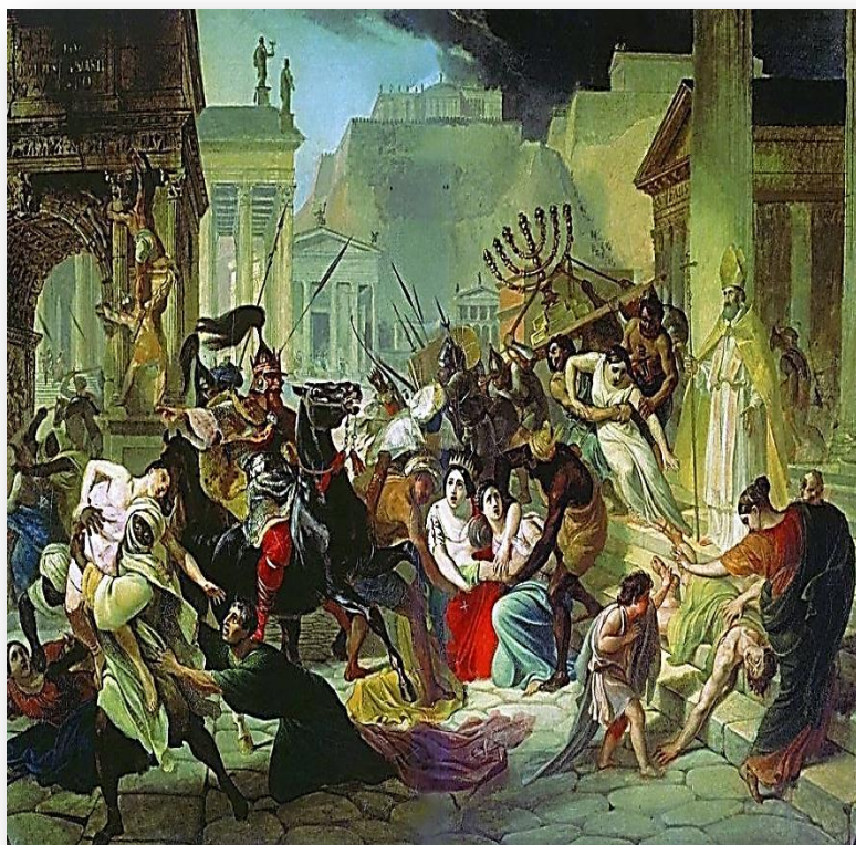
ВАНДАЛЫ В РИМЕ

Антикультура – бездуховность, пренебрежение гуманистическими ценностями, вандализм.