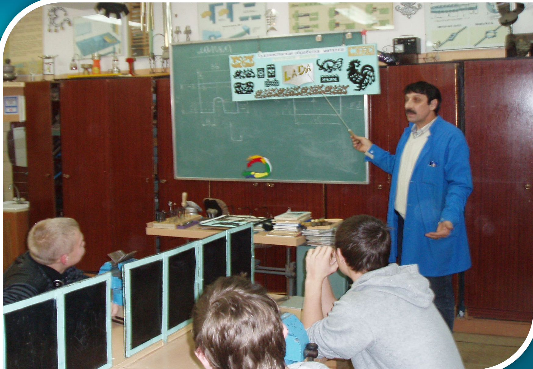
Знакомство учащихся с видом художественной обработки металла - просечкой