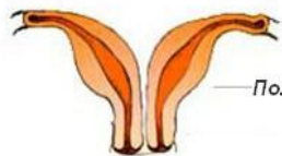
— Полное удвоение матки