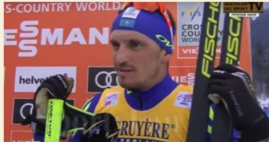
Блиц интервью лыжника Алексея Полторанина после соревнований