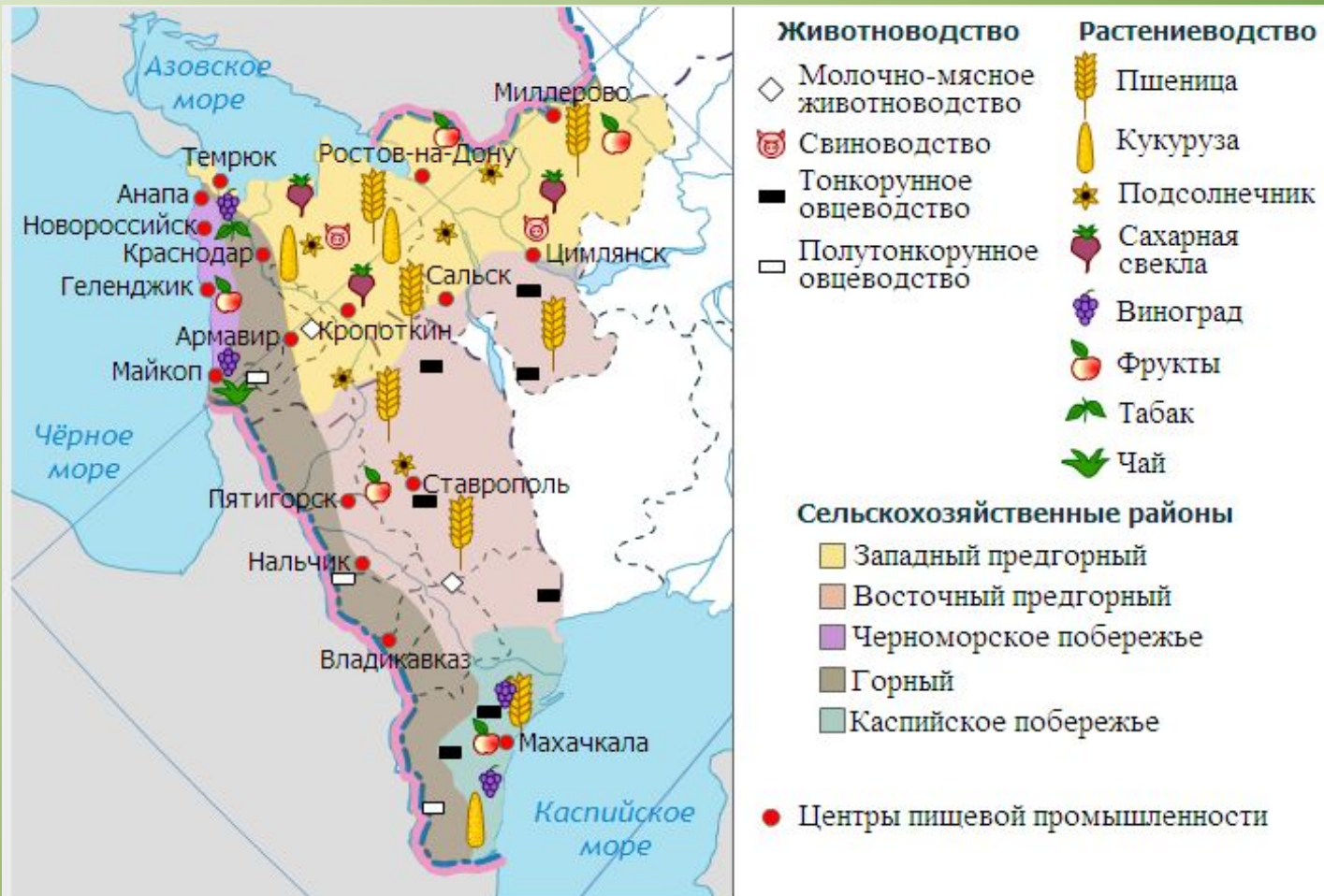
Рис. 2. Агропромышленный комплекс Юга России