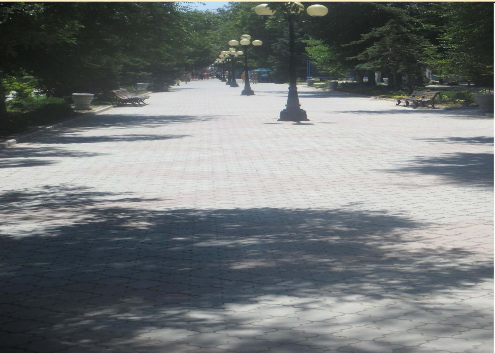
Центральная аллея парка Фрунзе г.Евпатория