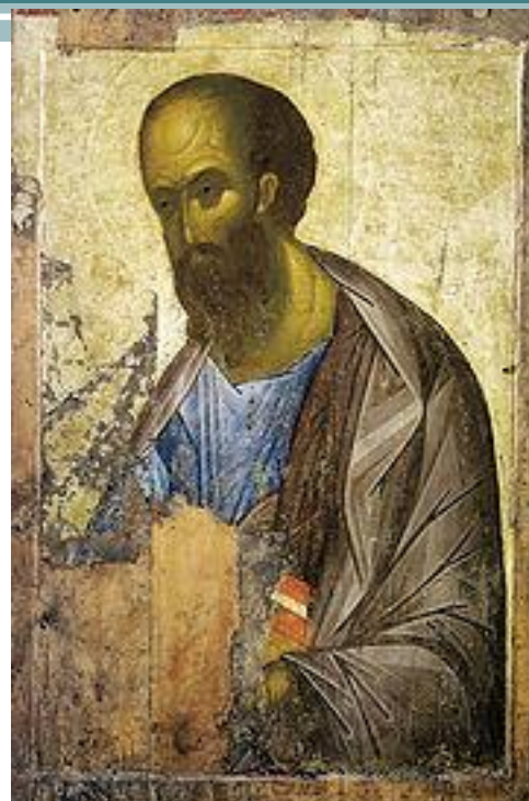
Архангел Михаил. Спас, икона Андрея Рублёва. Апостол Павел

С Успенским собором связаны одни из самых знаменитых древнерусских икон, приписываемых кисти Андрея Рублёва. В 1918 году вместе с проведением реставрации настенной живописи собора здесь были найдены три иконы, входившие некогда в состав поясного деисусного чина: Спас Вседержитель, Архангел Михаил, Апостол Павел. В настоящее время они хранятся в собрании Третьяковской галереи.