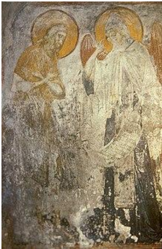
Ангел вручает преподобному Пахомию общежительный монашеский устав