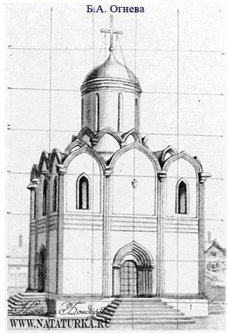
Успенский собор. Реконструкция Б.А. Огнева