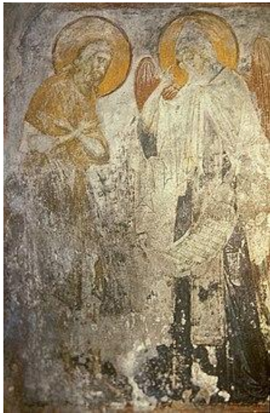
Ангел вручает преподобному Пахомию общежительный монашеский устав