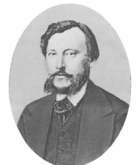
К. Н. ЛЕОНТЬЕВ Фотография 1867 года