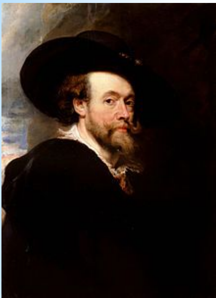
Питер Пауль Рубенс