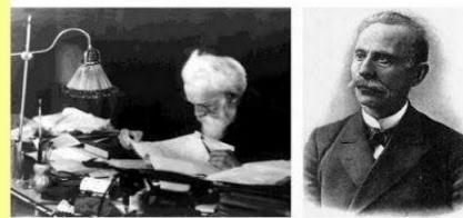
В.И.Вернадский, академик, основоположник учения о биосфере