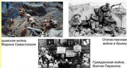
рымская война. Хорона Севастополя

250 лет мы жили вместе с Россией общей судьбой. Наша земля помнит великие и трагические события. Русско-Турецкие войны, Революцию, Гражданскую войну, Великую Отечественную войну, распад Советского Союза.