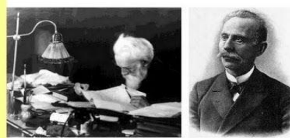
В.И.Вернадский, академик, основоположник учения о биосфере