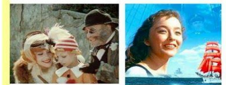
Фильм «Приключения Буратино» Режиссер Л.Нечаев

Снимали любимые фильмы «Приключения Буратино», «Алые паруса», «Остров сокровищ», «Приключения капитана Гранта», «Кавказская пленница», «Человек с бульвара Капуцинов».