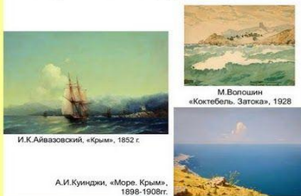
И.К.Айвазовский, «Крым», 1852 г.