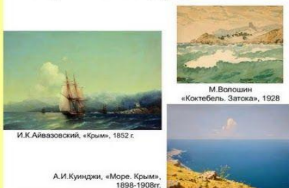
И.К.Айвазовский, «Крым», 1852 г.