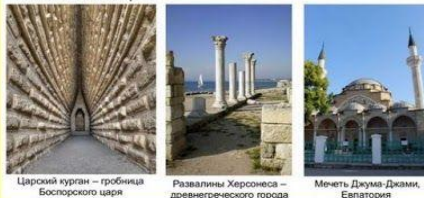
Царский курган – гробница Боспорского царя

На его благодатной земле издавна селились разные народы и образовывались разные государства. Крым в древности был частью Великого Боспорского царства, потом Византийской империи, потом нескольких кочевых империй, затем Крымского ханства, пока, наконец, не вошел в состав Российской империи.