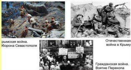
Крымская война. Хорона Севастополя

250 лет мы жили вместе с Россией общей судьбою. Наша земля помнит великие и трагические события. Русско-Турецкие войны, Революцию, Гражданскую войну, Великую Отечественную войну, распад Советского Союза.