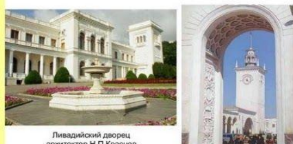
Ливадийский дворец архитектор Н.П.Краснов