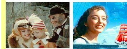
Фильм «Приключения Буратино» Режиссер Л.Нечаев

Снимали любимые фильмы «Приключения Буратино», «Алые паруса», «Остров сокровищ», «Приключения капитана Гранта», «Кавказская пленница», «Человек с бульвара Капуцинов».