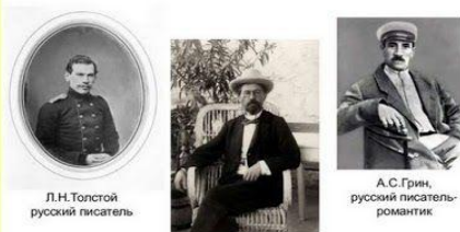
Л.Н.Толстой русский писатель