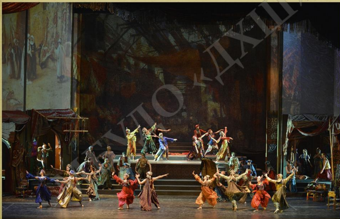
Фестиваль искусств в Ливане

В синтетических видах искусства (зрелищные) – происходит синтез (слияние), объединение свойств пространственных и временных видов искусства, их мы видим и слышим, для их восприятия нужно определенное время (театр, опера, танец, кино, цирк, телевидение, компьютерные искусства).