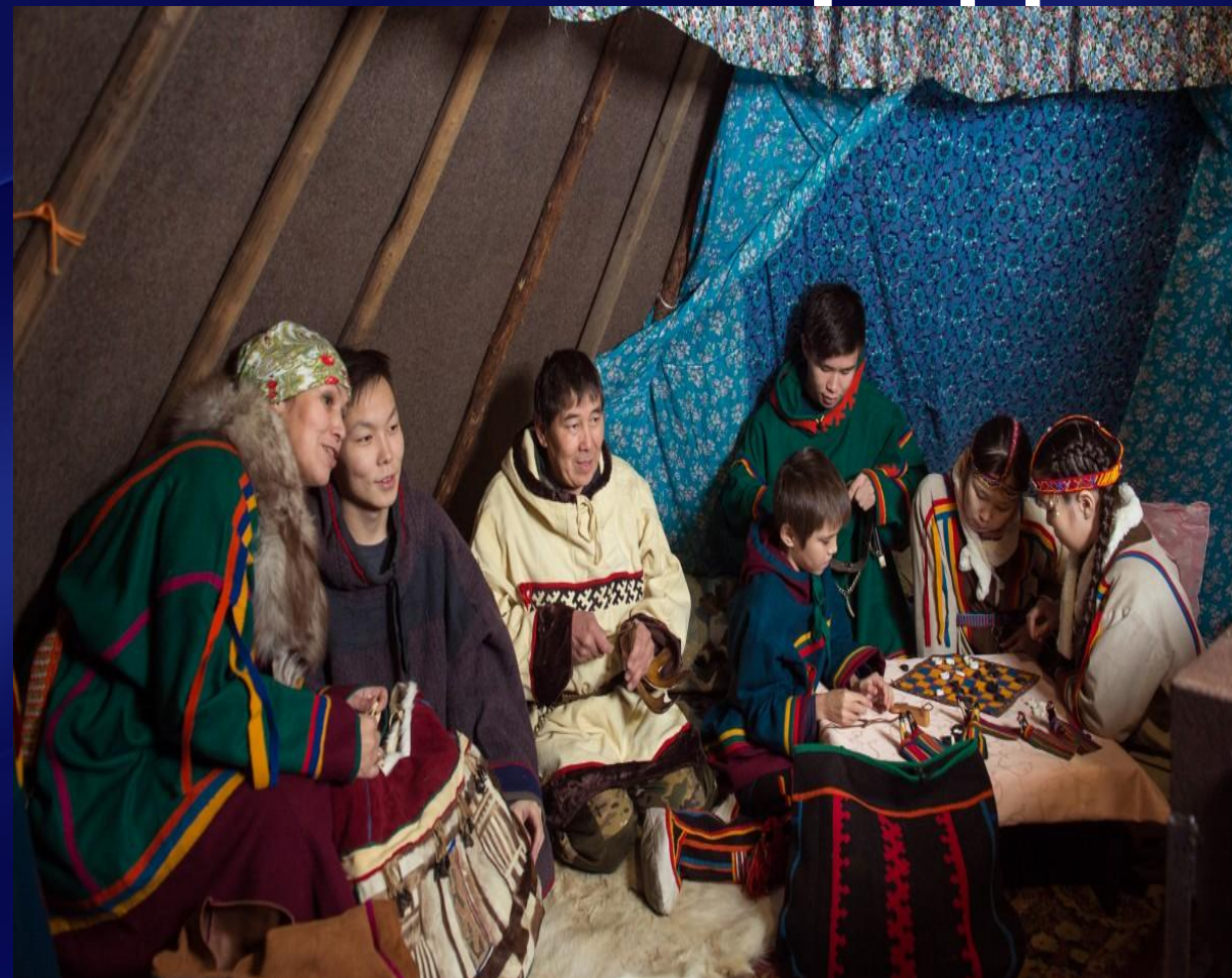
Представительство Ямало-Ненецкого автономного округа в Тюменской области