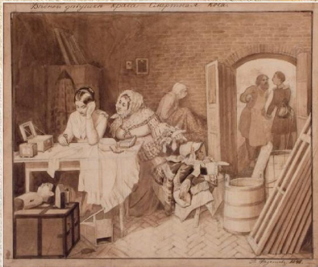
П.А. Федотов «Бедной девушке краса – смертная коса» (1846)