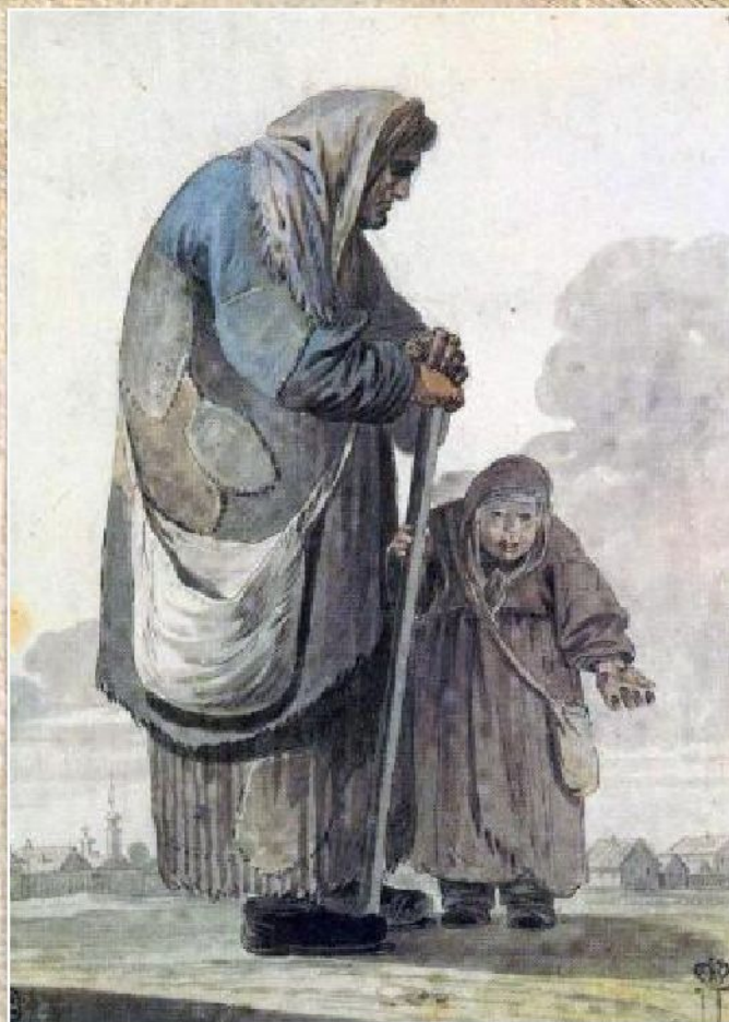
И.А. Ерменёв «Нищая с девочкой-поводырем» (из серии «Нищие», ок. 1775)