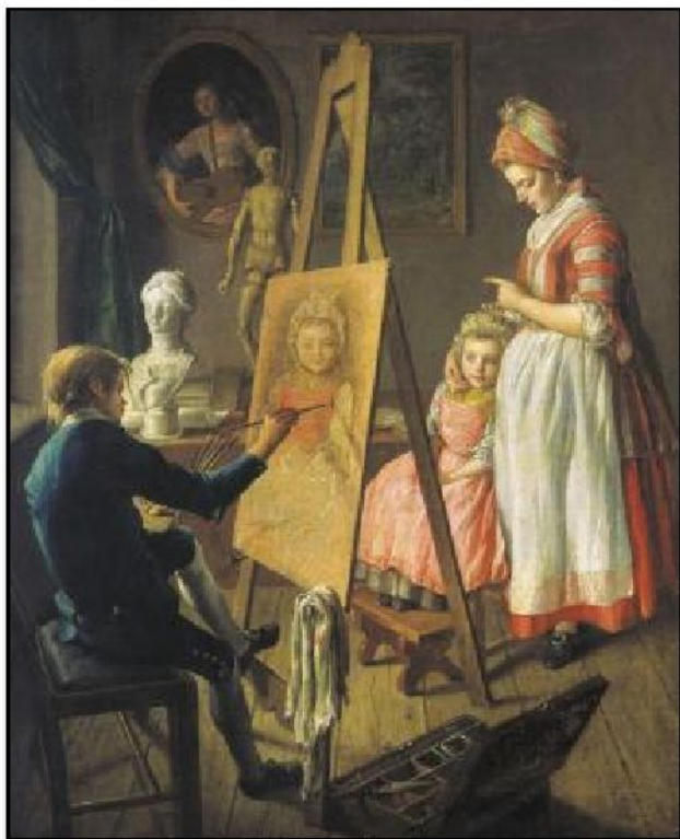
И.И. Фирсов «Юный живописец» (1765-1770)

Академия художеств рассматривала бытовой жанр как низший по сравнению с историческим жанром.