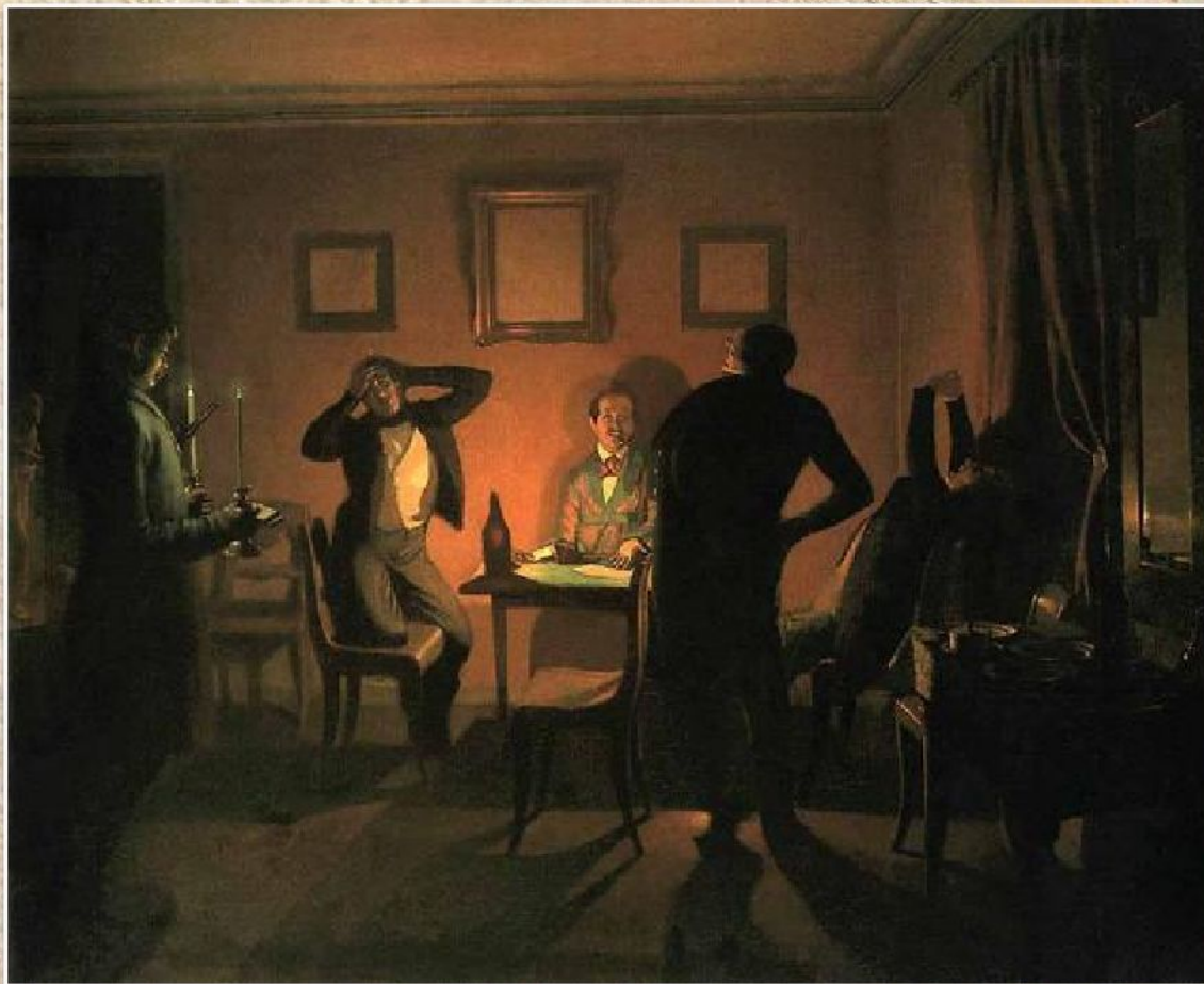
П.А. Федотов «Игроки» (1852)