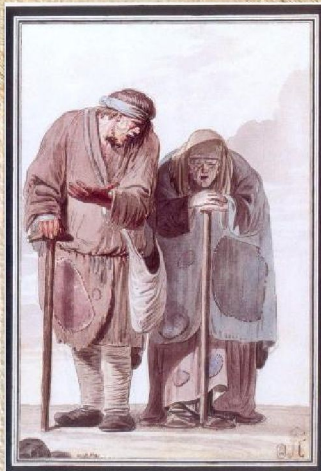
И.А. Ерменёв «Нищий и нищая» (из серии «Нищие», ок. 1775)