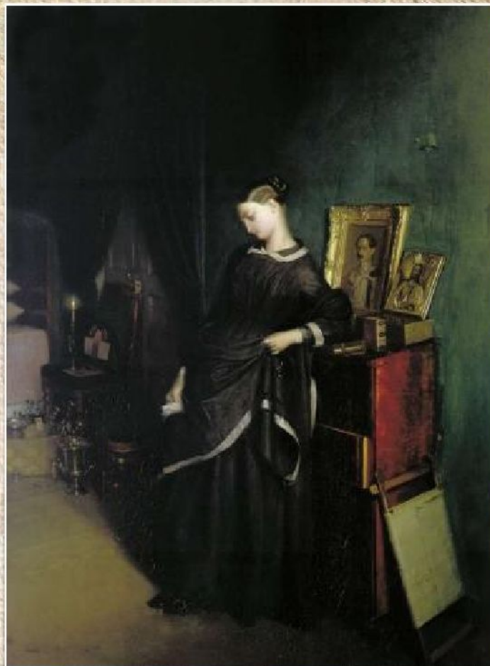
П.А. Федотов «Вдовушка» (1851-1852)