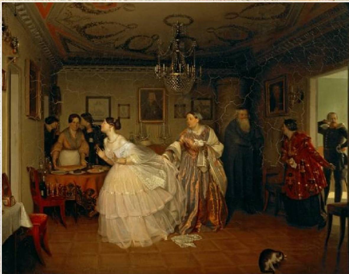
П.А. Федотов «Сватовство майора» (1848)