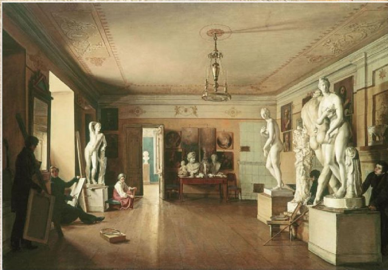
А.А. Алексеев «Мастерская художника А.Г. Венецианова в Петербурге» (1827)