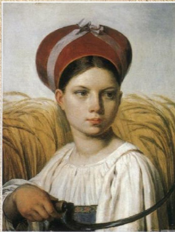
А.Г. Венецианов «Жница» (ок. 1820)