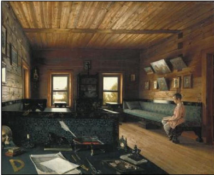
Григорий Сорока «Кабинет дома в Островках» (1844)

В 1820-е годы Венецианов организовал в своем имении в деревне Сафонково художественную школу. За 20 лет здесь прошли обучение свыше 70 человек. Ученики работали преимущественно в «крестьянском» жанре, также писали городские и сельские пейзажи, интерьеры, натюрморты.