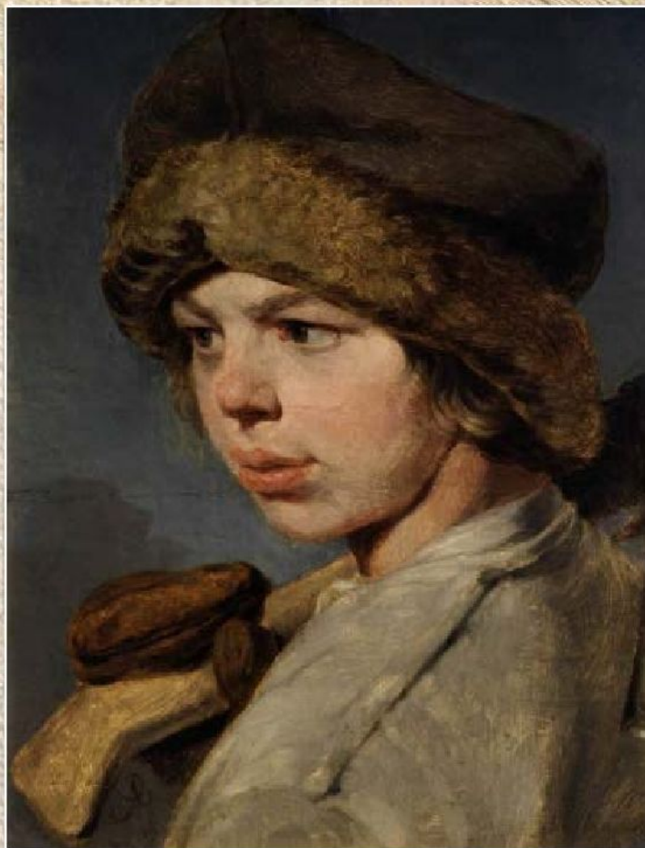
А.Г. Венецианов «Захарка» (1825)