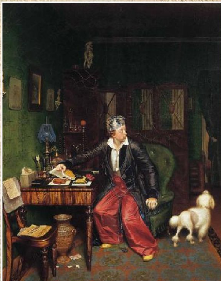
П.А. Федотов «Завтрак аристократа» (1849 - 1850)