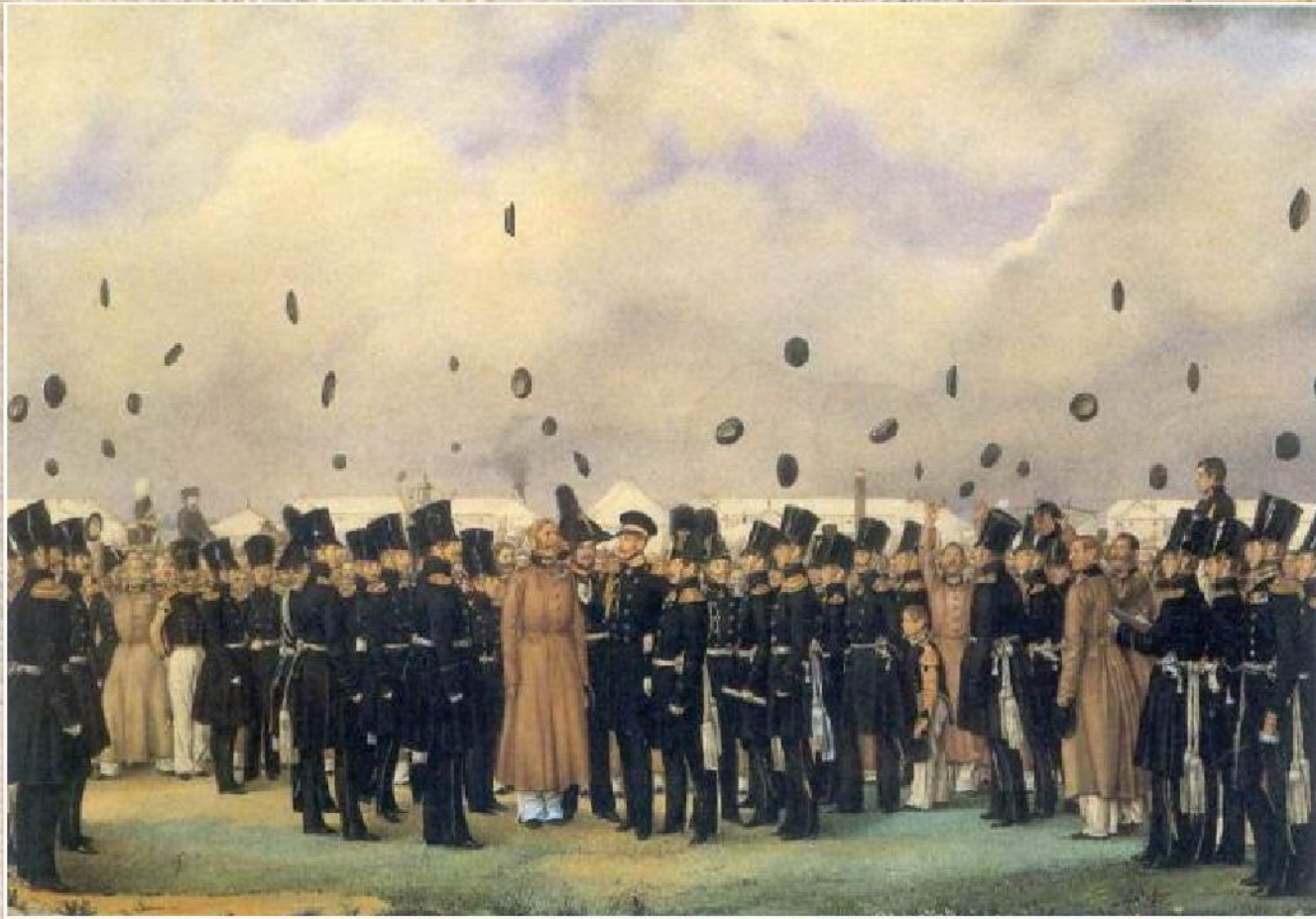
П.А. Федотов «Встреча великого князя» (1838)