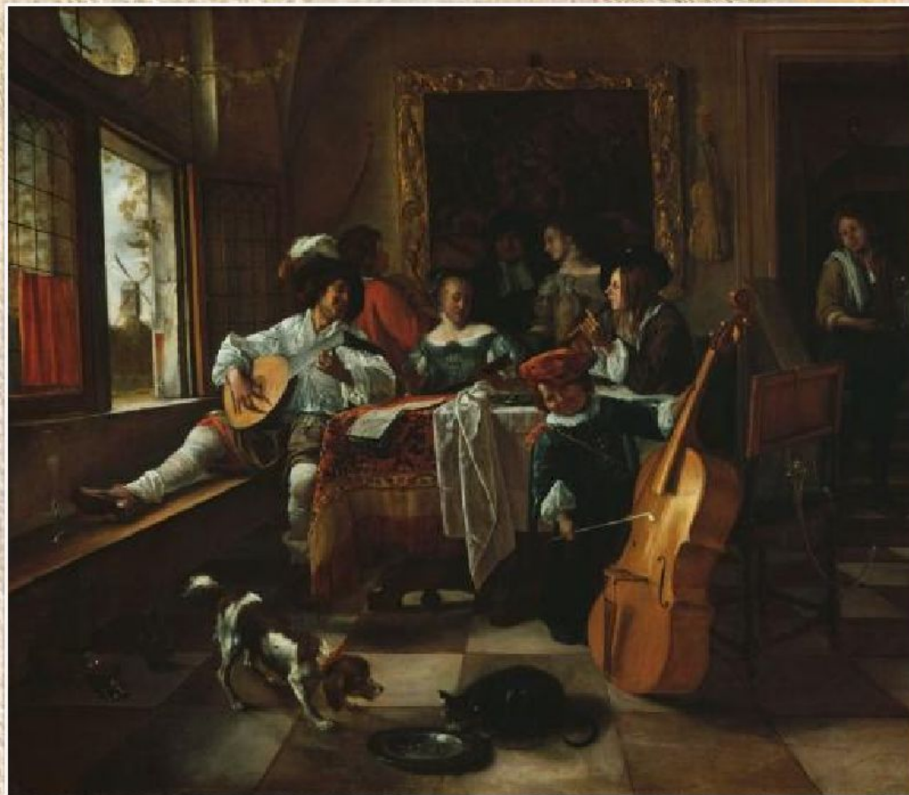
Ян Стен «Семейный концерт», 1666 (Академия художеств в жанровой живописи ориентировалась на наследие «малых голландцев»)