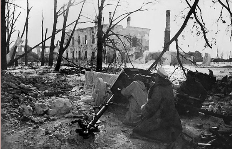
Немецкая противотанковая пушка на позиции в г. Холм