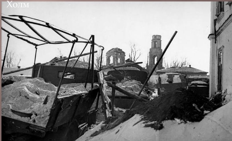
Разгромленная немецкая автоколонна в центре Холма