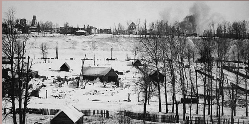
Вид на г. Холм с татиловской стороны

Номер Полевой почты дивизии известен – № 1420, но писем с фронта от прадеда не сохранилось 😞