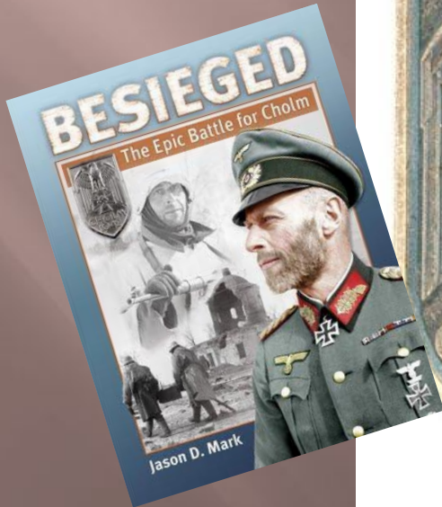
Почетный знак Вермахта «Холм 1942» так называемый «Щит за Холм»