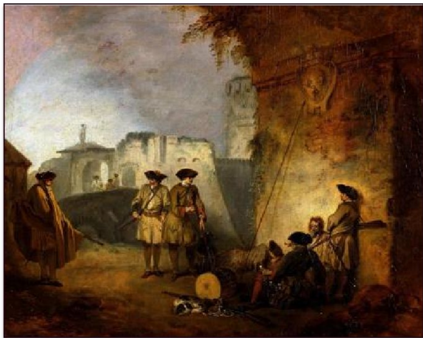
Антуан Ватто «Ворота Валансьена», ок. 1710

Клод Одран был хранителем художественной коллекции Люксембургского дворца, Ватто познакомился там с творчеством Рубенса и Пуссена.