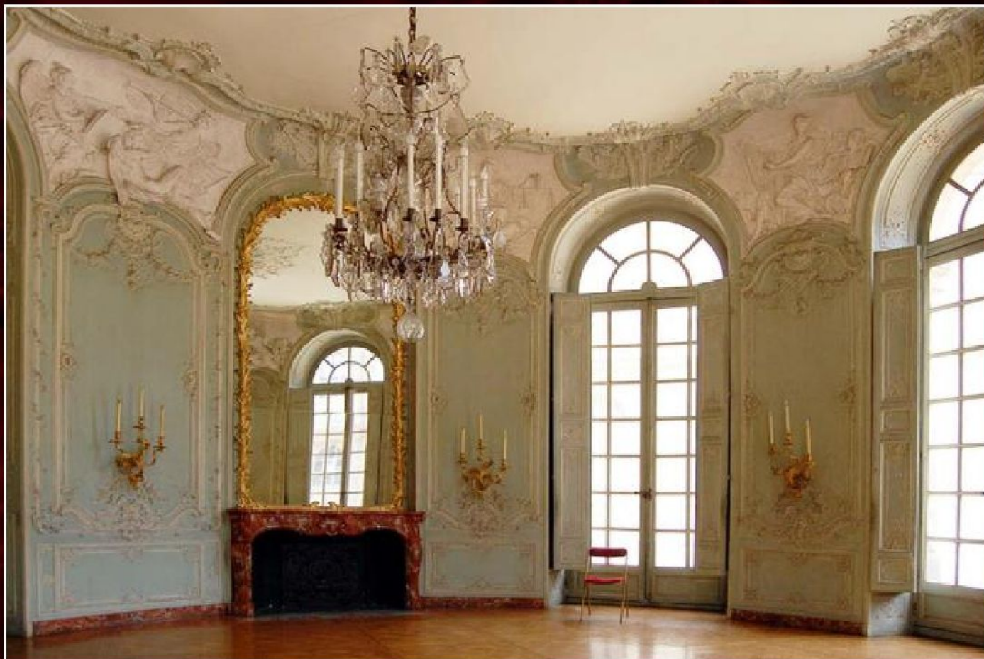
Жермен Боффран. «Салон Принца» отеля Субиз (Париж, Франция), 1735-1738