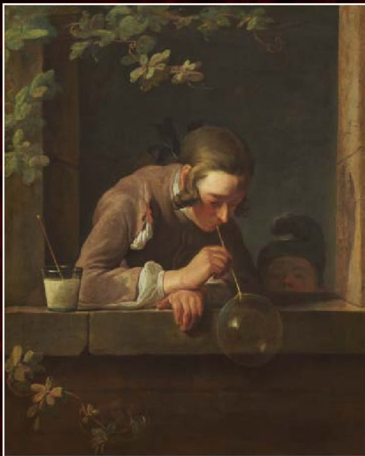
Жан Батист Симеон Шарден «Мыльные пузыри», ок. 1739