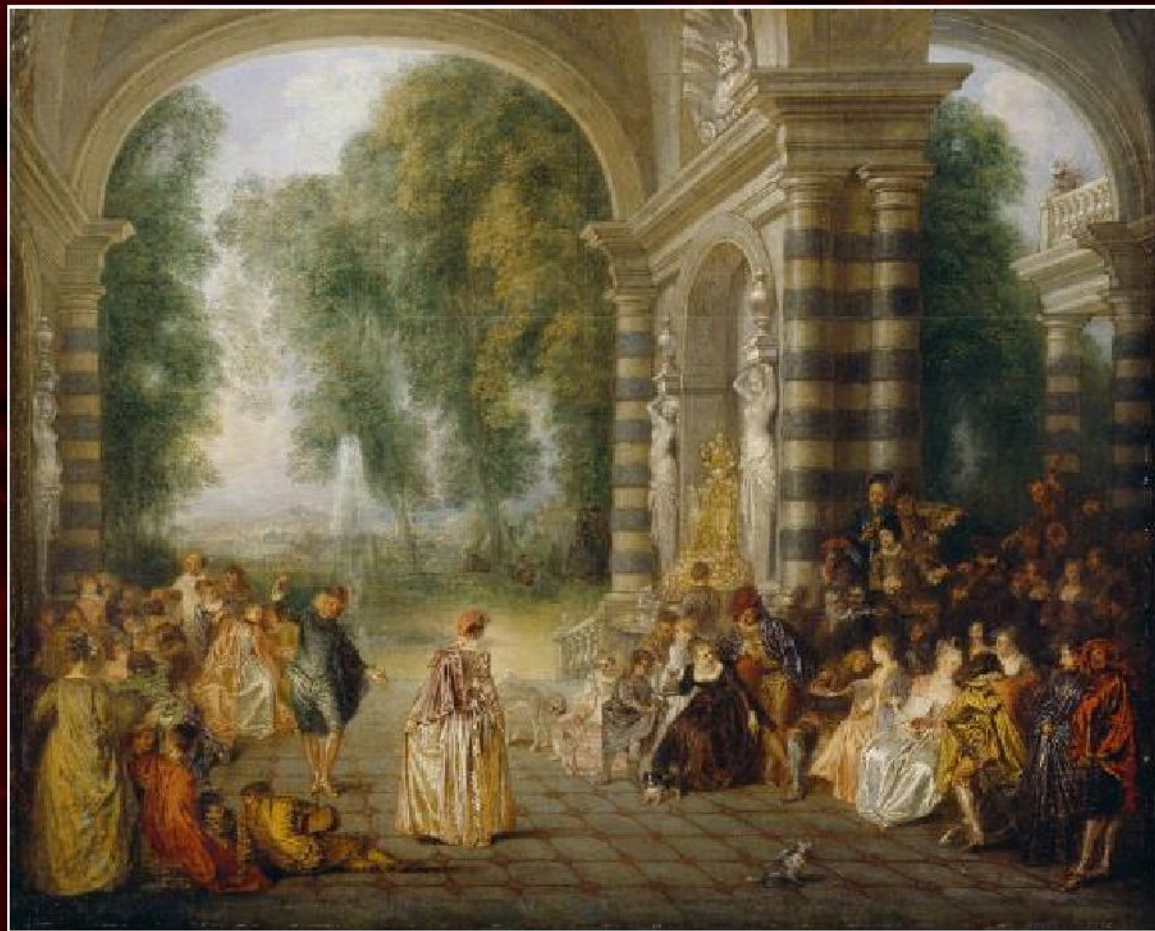
Антуан Ватто «Радости бала», 1715-1717