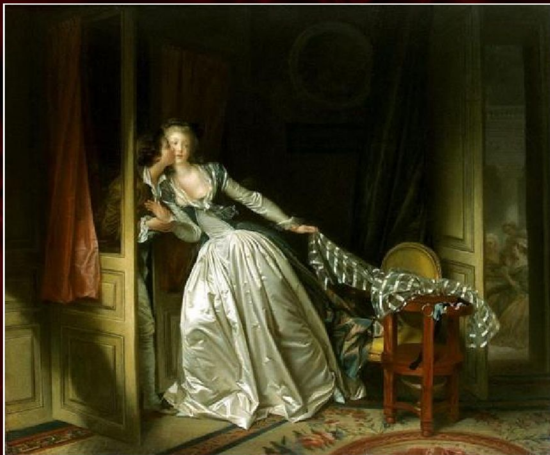
Жан-Оноре Фрагонар «Поцелуй украдкой», 1787-1789