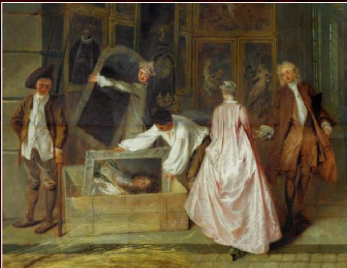
Антуан Ватто «Вывеска лавки Жерсена» (фрагмент), 1720-1721