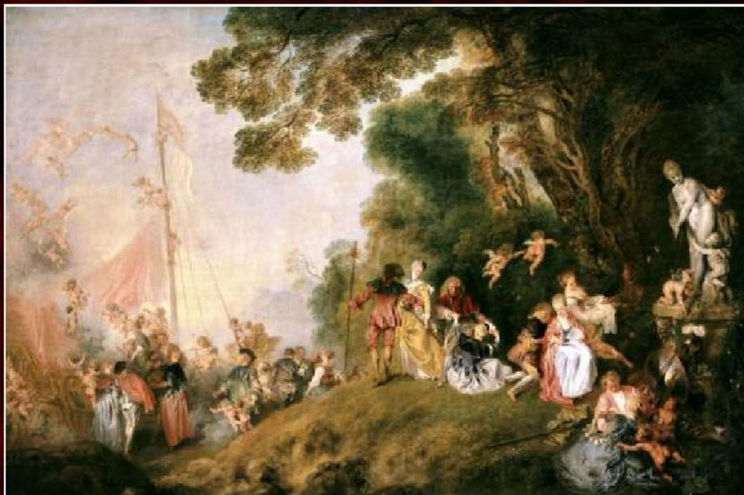
Антуан Ватто «Паломничество на остров Киферу», 1718

Выполнить в рабочей тетради описание одного из известнейших произведений художника Антуана Ватто.