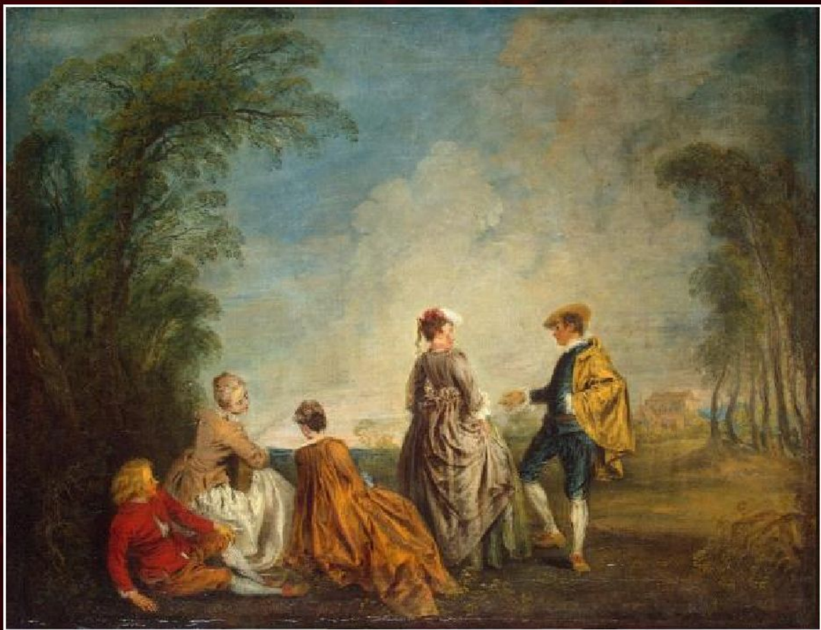
Антуан Ватто «Затруднительное положение», 1715-1716