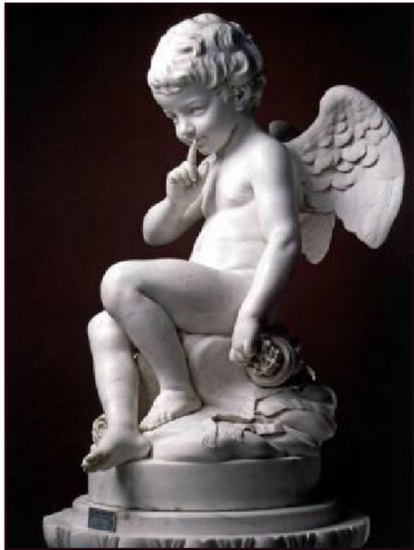
Этьен Морис Фальконе «Грозящий Амур», 1755

Французская скульптура XVIII в. эклектична. В монументальной скульптуре преобладает «большой стиль» прошлого века, а в скульптуре малых форм дает о себе знать стилистика рококо.