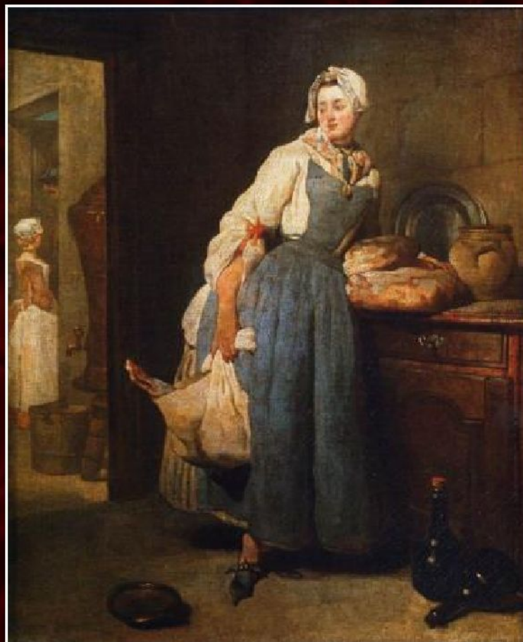
Жан Батист Симеон Шарден «Вернувшаяся с рынка», 1739