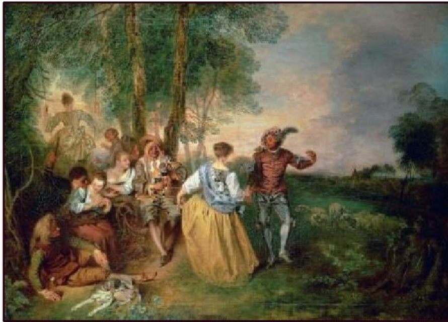
Антуан Ватто «Пастушки», 1717-1719

В это время была популярна философия неоэпикурейства, согласно которой в жизни нужно искать только счастья и наслаждения.