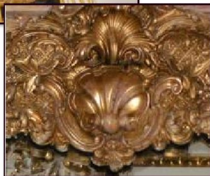
Орнаментальный элемент на мотив створки раковины

Рококо (от фр. rocaille -ракушка) - стиль европейского искусства, возникший во Франции в первой половине XVIII в. Во Франции его обычно называют «стилем Людовика XV».