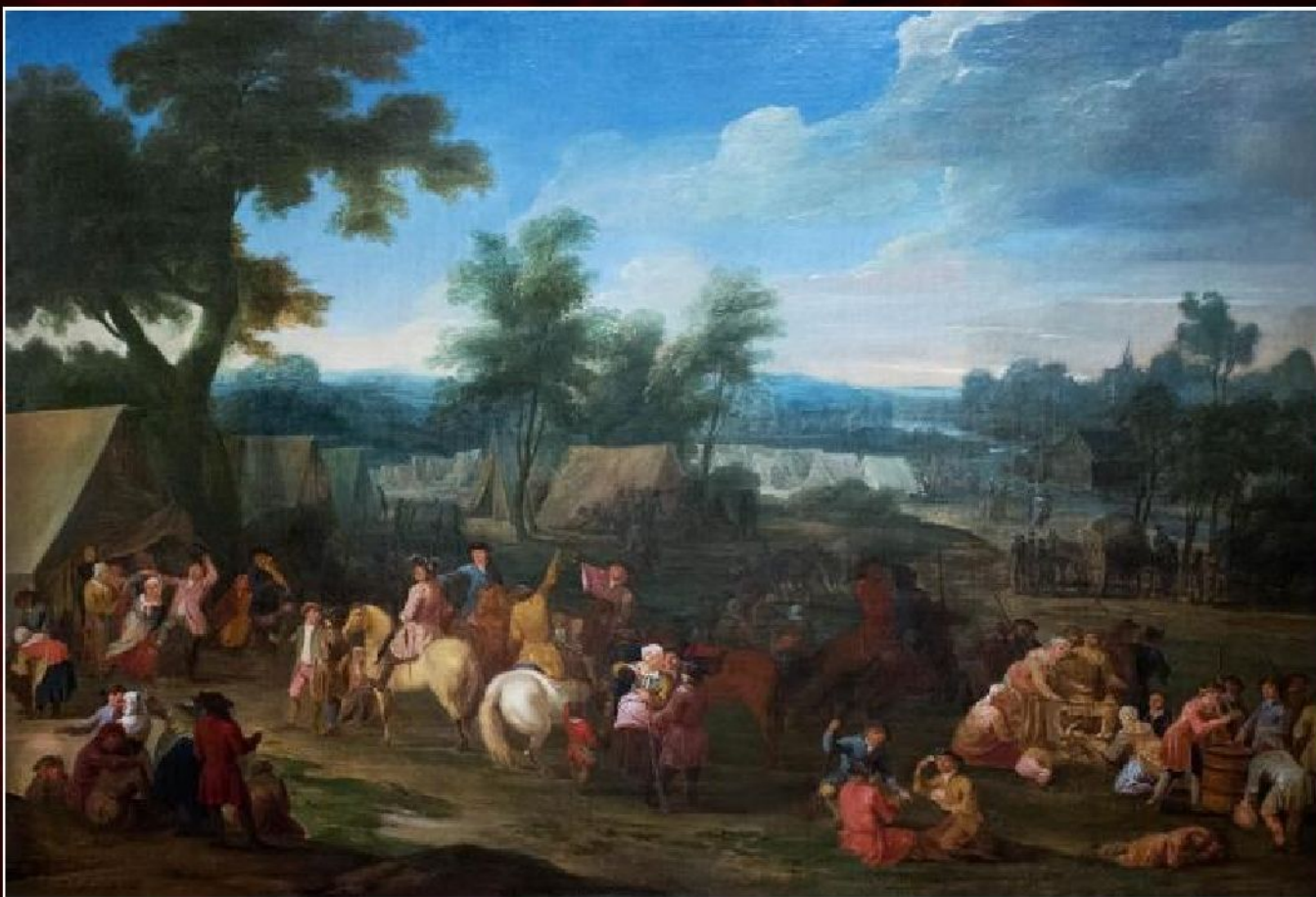
Антуан Ватто «Военный лагерь», 1715