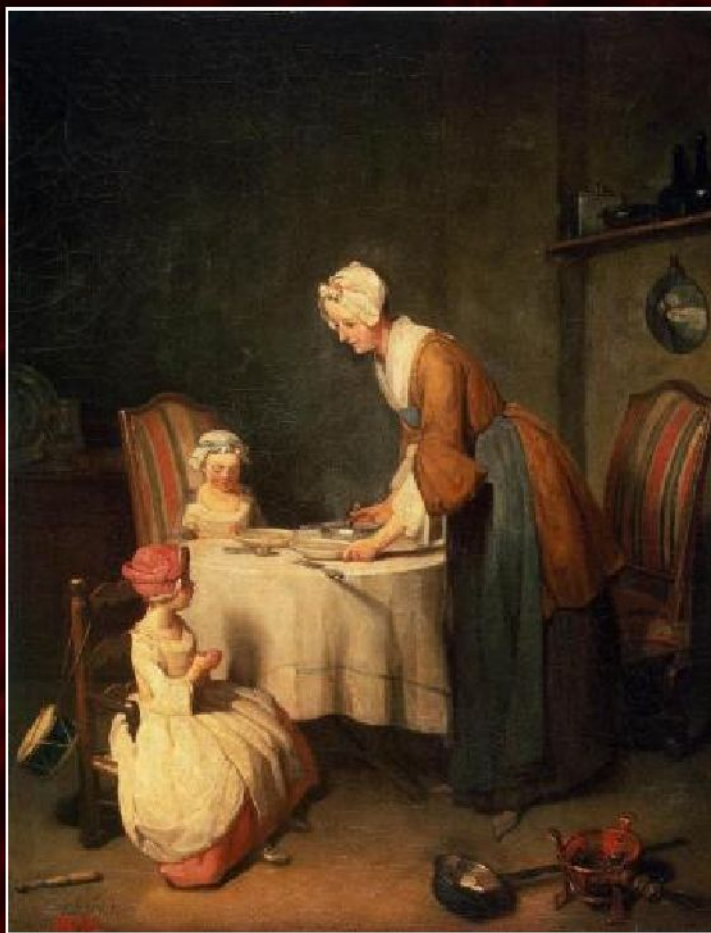
Жан Батист Симеон Шарден «Молитва перед обедом», 1744