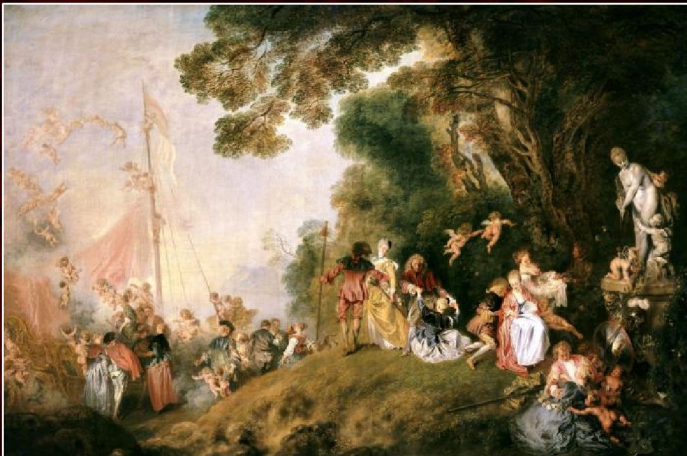
Антуан Ватто «Паломничество на остров Кифера» (2-й вариант), 1718