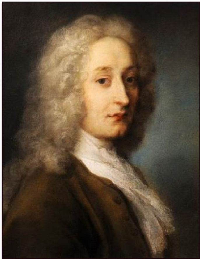
Розальба Каррьера «Портрет Ватто», 1721