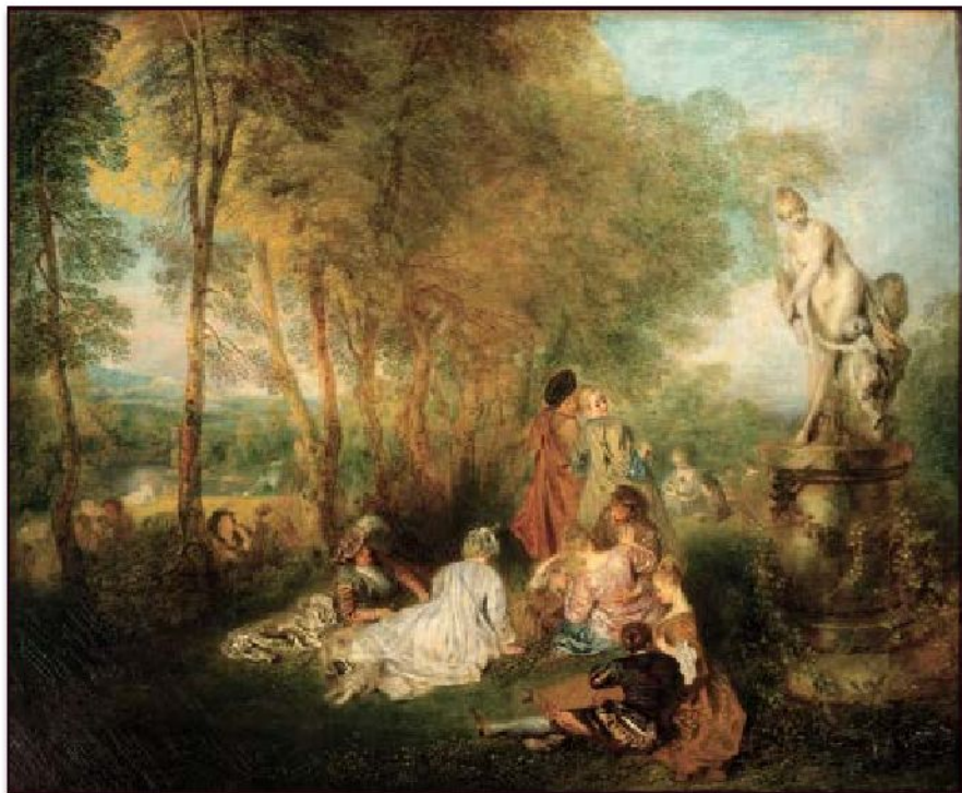
Антуан Ватто «Праздник любви», 1717

Ватто открыл художественную ценность хрупких нюансов чувств, едва уловимо сменяющих друг друга. Его картины содержат в себе богатую гамму эмоциональных оттенков, сущность которых раскрывается не столько в прямом сюжетном значении, сколько в тончайшей поэтичности. Его искусство впервые ощутило разлад мечты и реальности, и поэтому оно отмечено печалью меланхолической грусти.