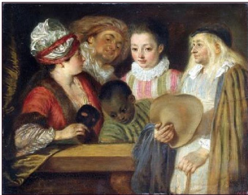
Антуан Ватто «Актеры Французско театра», ок.1712

С начала 1710-х годов в творчестве Ватто появляются темы связанные с жизнью театра и актеров.