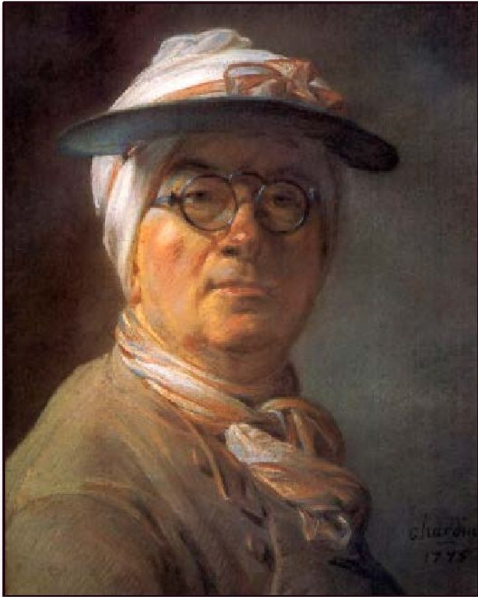
Жан Батист Симеон Шарден «Автопортрет с зеленым козырьком», 1775