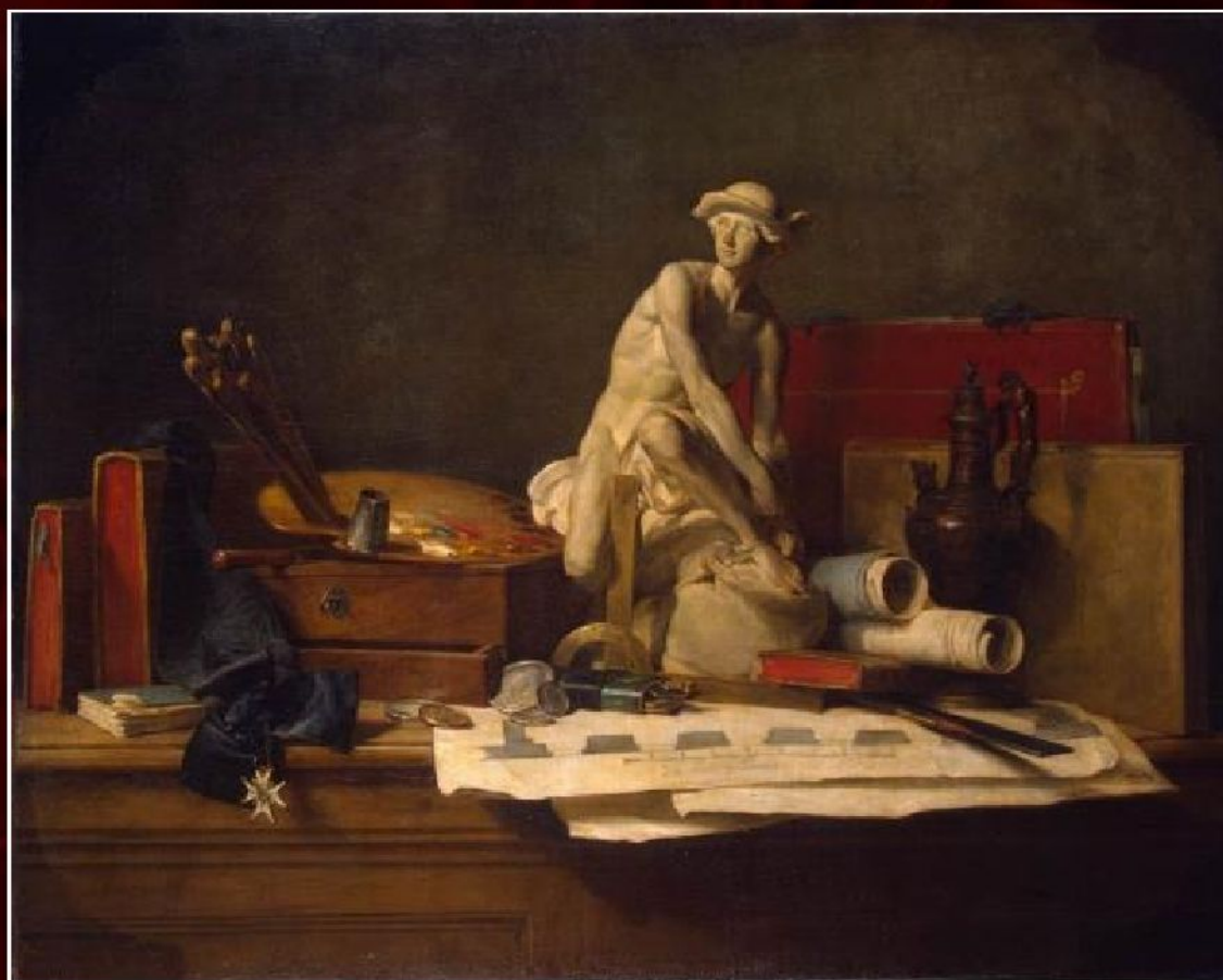
Жан Батист Симеон Шарден «Натюрморт с атрибутами искусств», 1766