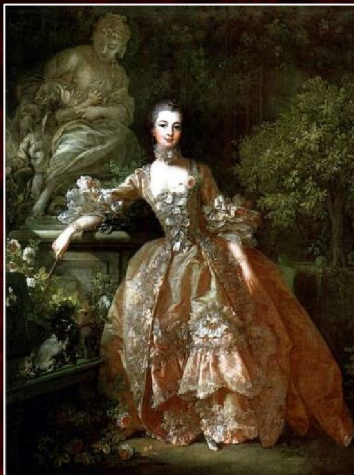
Франсуа Буше «Портрет маркизы де Помпадур» , 1759