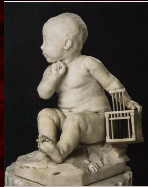
Жан-Батист Пигаль «Мальчик с клеткой», 1749

Работая в стиле, переходном от рококо к классицизму , выполнил ряд статуй и групп на мифологические и аллегорические темы ("Меркурий, завязывающий сандалию"; "Мальчик с клеткой", мрамор, 1749, Лувр, Париж)