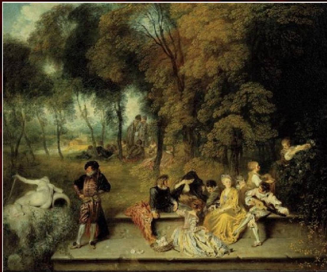
Антуан Ватто «Общество в парке», 1718-1719