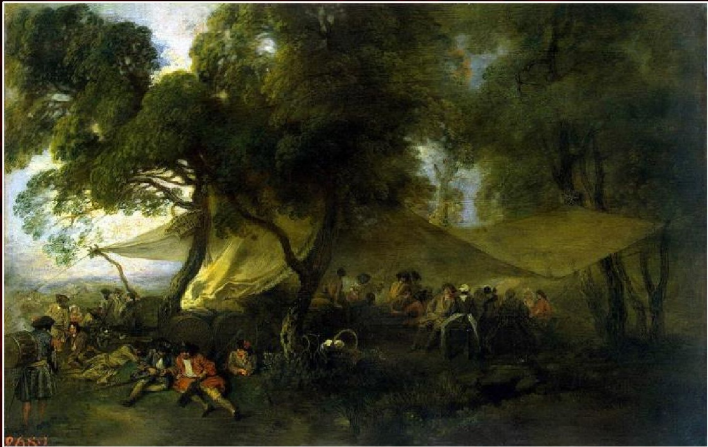
Антуан Ватто «Военный роздых», 1715