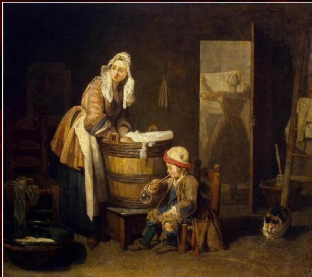
Жан Батист Симеон Шарден «Прачка», 1737