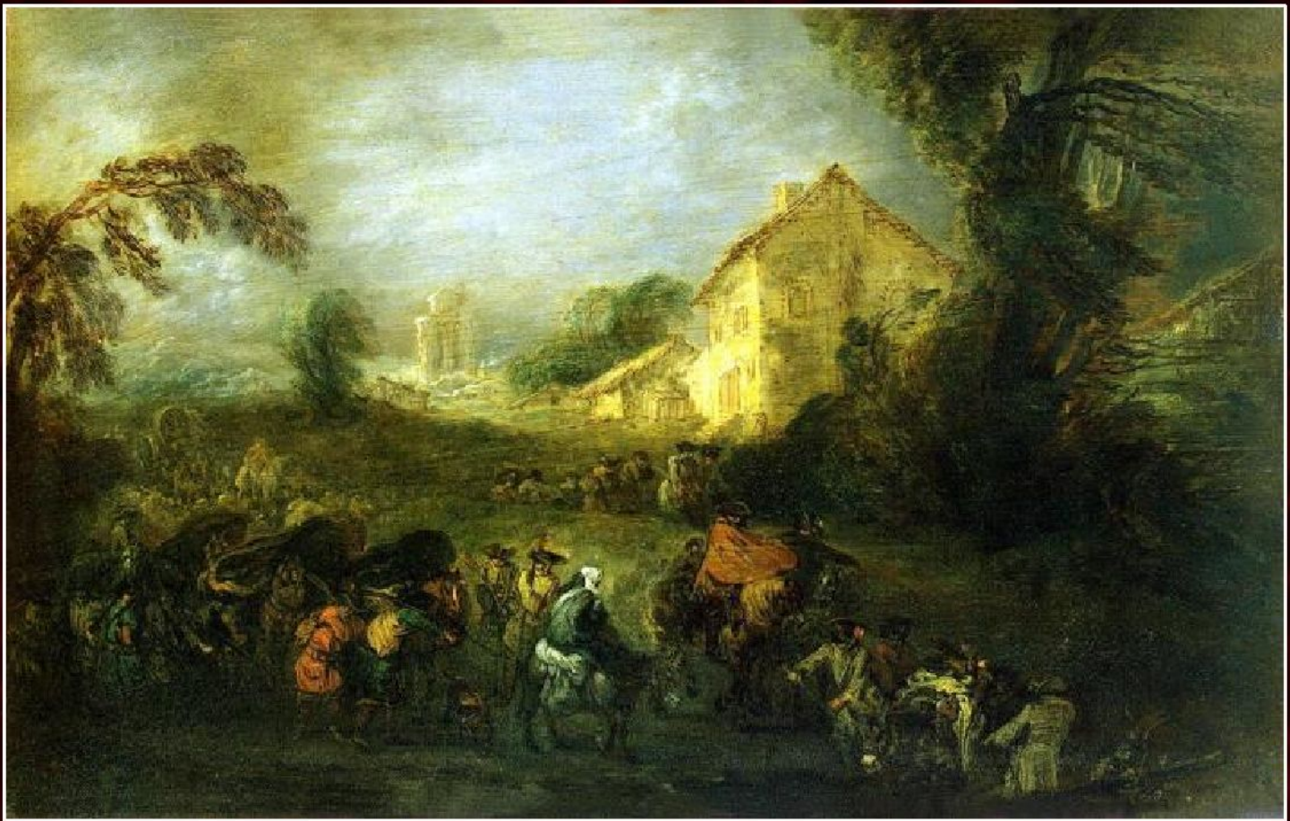
Антуан Ватто «Тяготы войны», 1715