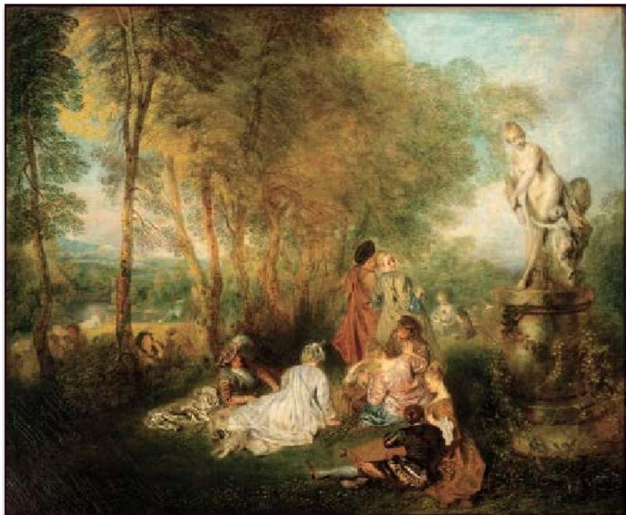
Антуан Ватто «Праздник любви», 1717

Ватто открыл художественную ценность хрупких нюансов чувств, едва уловимо сменяющих друг друга. Его картины содержат в себе богатую гамму эмоциональных оттенков, сущность которых раскрывается не столько в прямом сюжетном значении, сколько в тончайшей поэтичности. Его искусство впервые ощутило разлад мечты и реальности, и поэтому оно отмечено печалью меланхолической грусти.