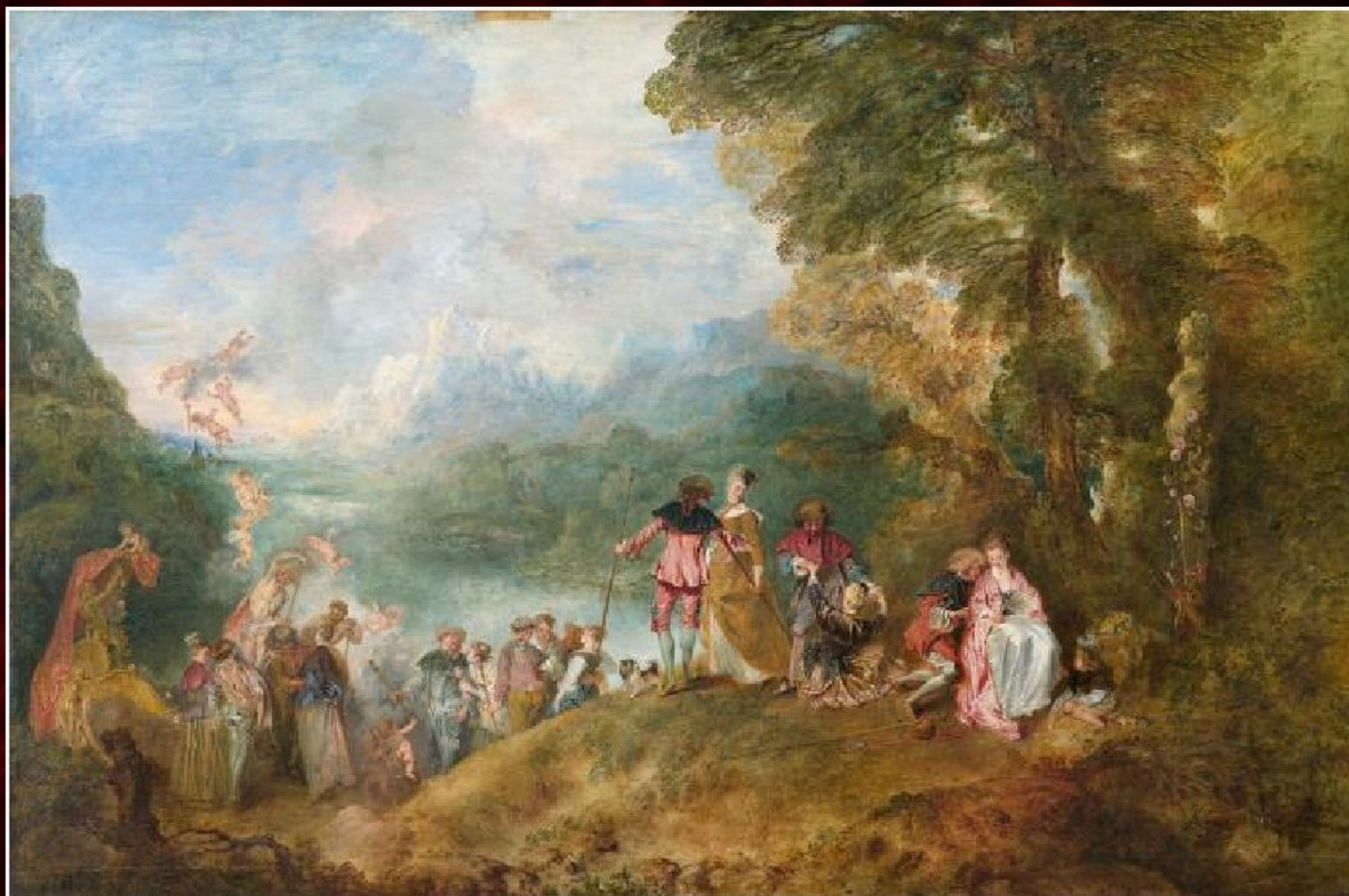
Антуан Ватто «Паломничество на остров Кифера» (1-й вариант), 1717