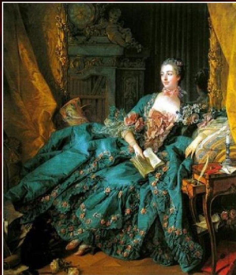
Франсуа Буше «Портрет маркизы де Помпадур», 1756