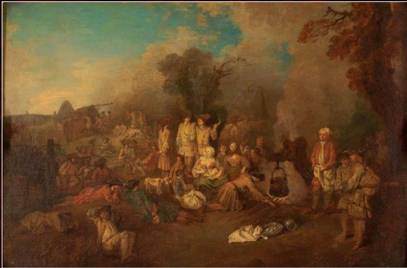
Антуан Ватто «Бивуак», 1709-1710