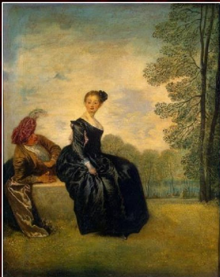
Антуан Ватто «Капризница», ок. 1718