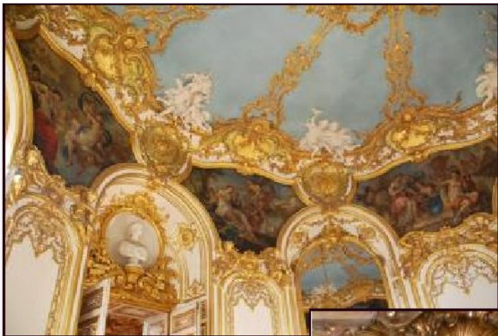
Овальный салон отеля Субиз (Париж, Франция), 1735-1738