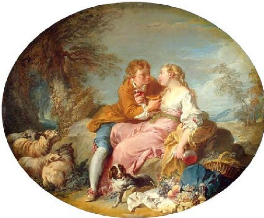
Франсуа Буше «Пастораль», 1740-е

В живописи появляется галантный жанр и пастораль (фр. pastorale — пастушеский, сельский). В этих картинах изображались беззаботные развлечения аристократов, стремившихся укрыться от реальности в пастушеской идиллии и сельских радостях.