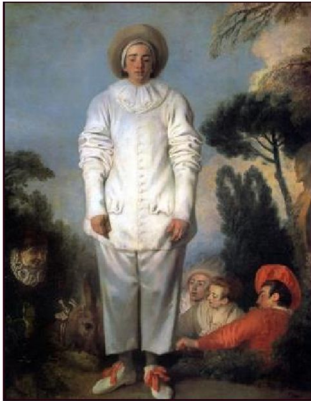
Антуан Ватто «Жиль», ок.1718-1719

В 1718 г. Ватто покинул гостеприимный дом своего покровителя. Независимый характер художника не дал ему долго оставаться у Пьера Кроза в столь обязывающих условиях.