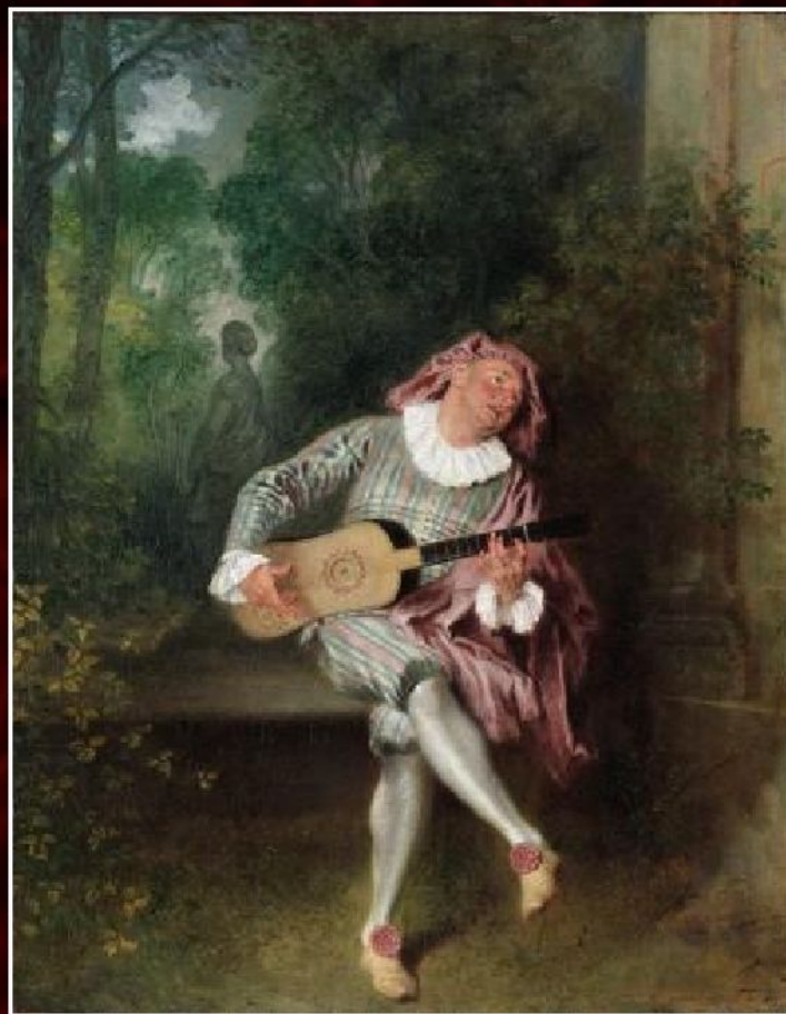
Антуан Ватто «Меццетен», 1717-1719