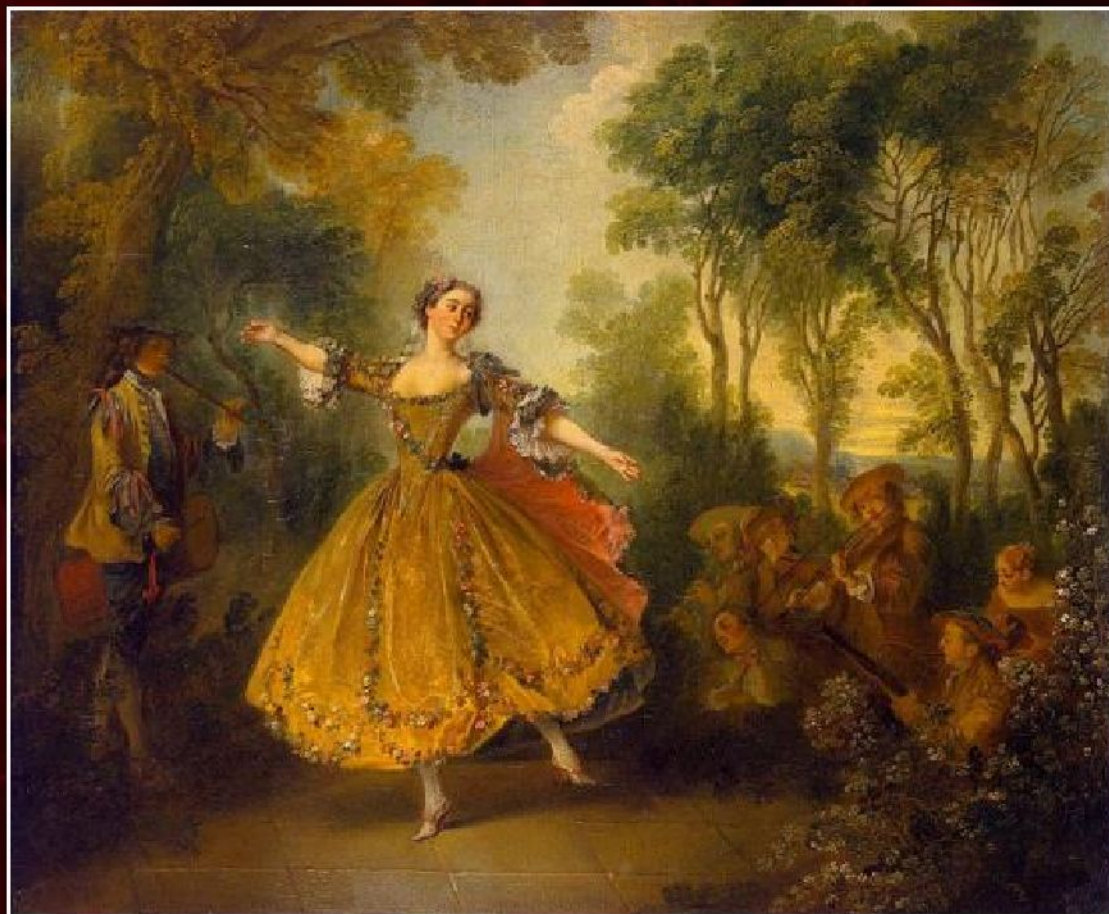
Никола Ланкре «Танцующая Камарго», ок. 1730