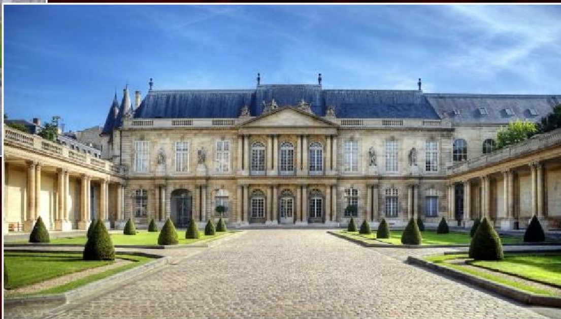
Пьер Деламер. Отель Субиз (Париж, Франция), 1735-1738

Отель Субиз — городской особняк, возведенный по проекту архитектора Пьера Деламера в 1705—1709 годах. Понятие «парижского отеля» не подразумевает под собой отель в привычном понимании этого слова. «Отелями» в Париже традиционно называли городские дворцы (особняки) с приусадебной территорией. Сегодня во дворце Субиз размещается Музей истории Франции.