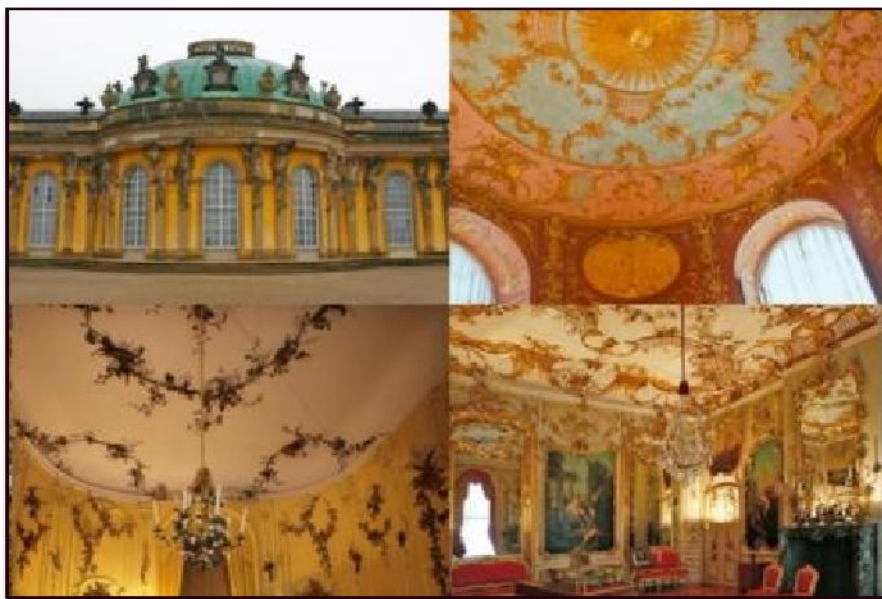
Георг Венцеслаус фон Кнобельсдорф. Дворец Сан-Суси (Германия), 1745-1747

Архитектура рококо ещё сильнее, чем барокко, стремилась сделать очертания сооружений более динамичными, а их убранство – декоративным, однако отвергается торжественность барокко и его тесная связь с Католической церковью.