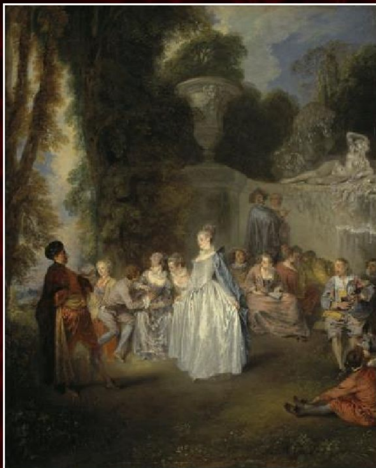
Антуан Ватто «Венецианский праздник», 1718-1719