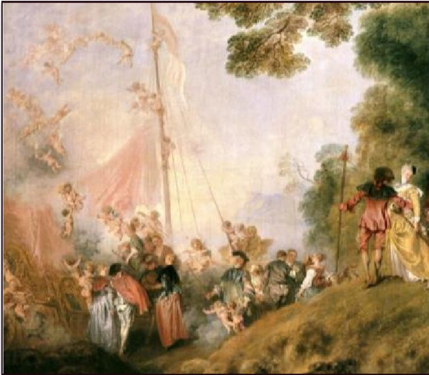
Антуан Ватто «Паломничество на остров Кифера» (фрагмент), 1718

В картинах рококо изображен очарованный мир, который дает возможность временного ухода от реальной жизни в мир мечты и грёз.