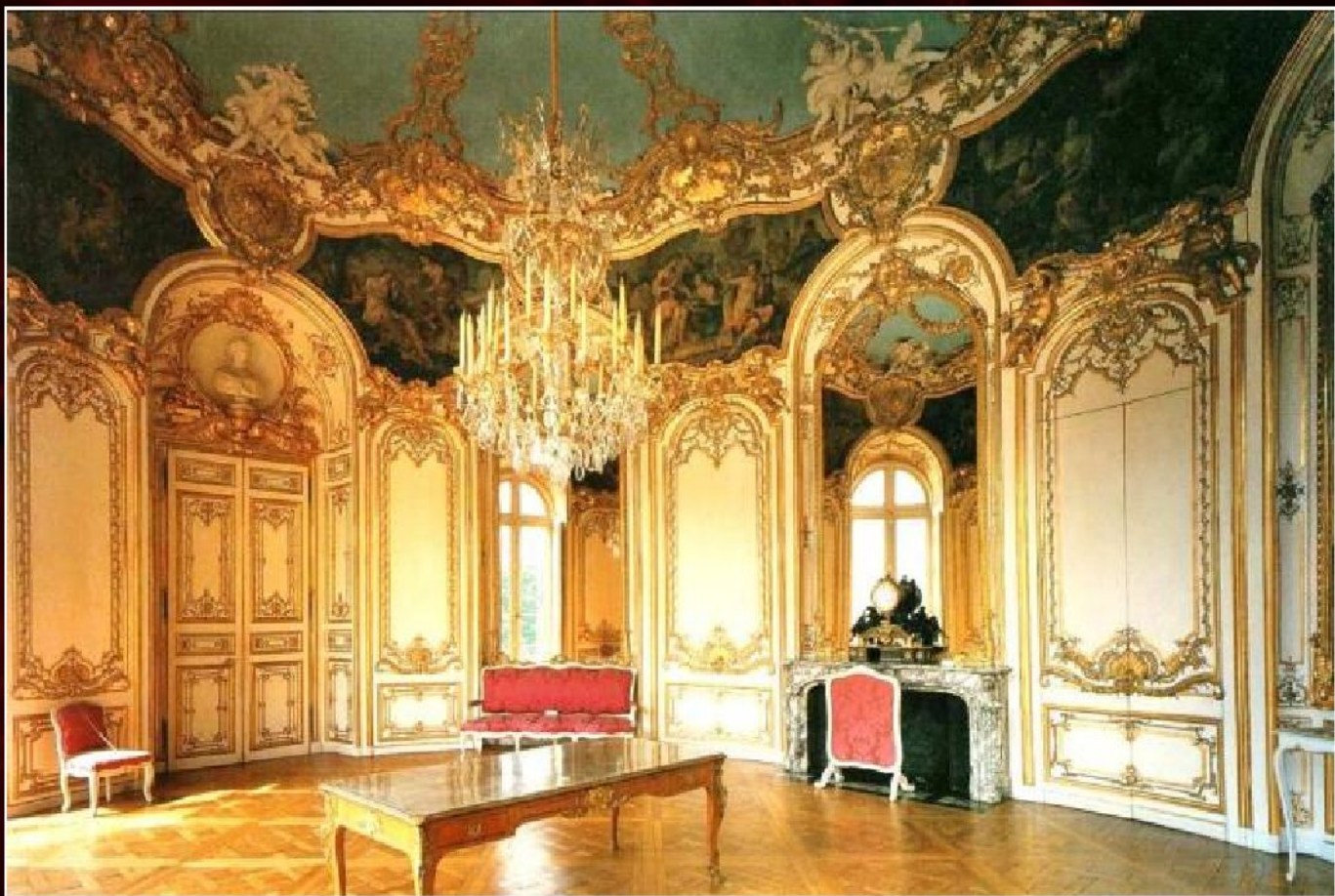
Жермен Боффран. «Салон Принцессы» отеля Субиз (Париж, Франция), 1735-1738