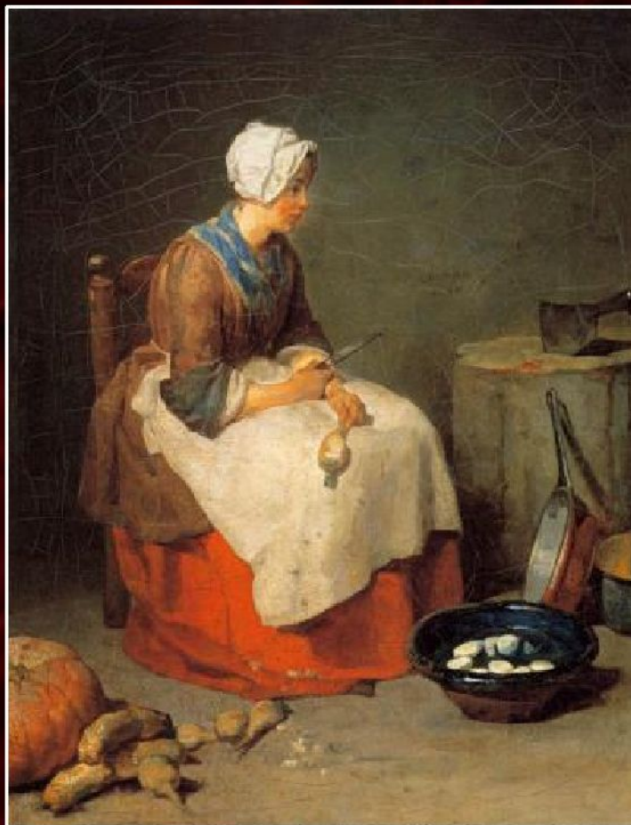
Жан Батист Симеон Шарден «Кухарка», 1738