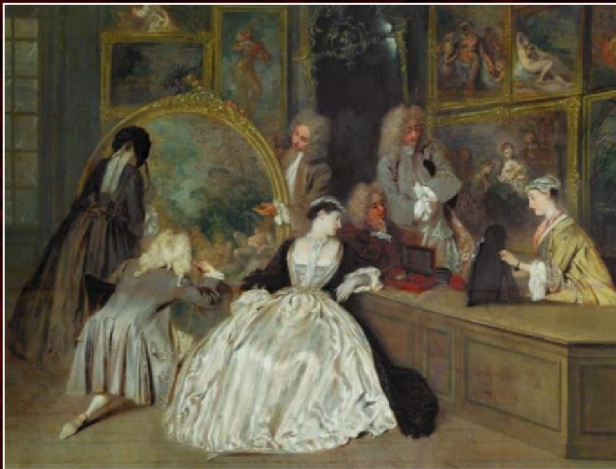
Антуан Ватто «Вывеска лавки Жерсена» (фрагмент), 1720-1721