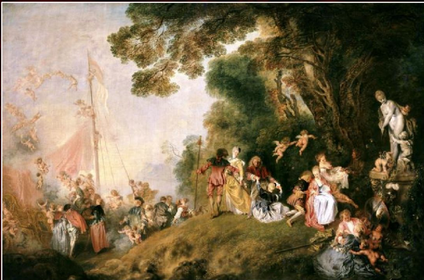
Антуан Ватто «Паломничество на остров Кифера» (2-й вариант), 1718