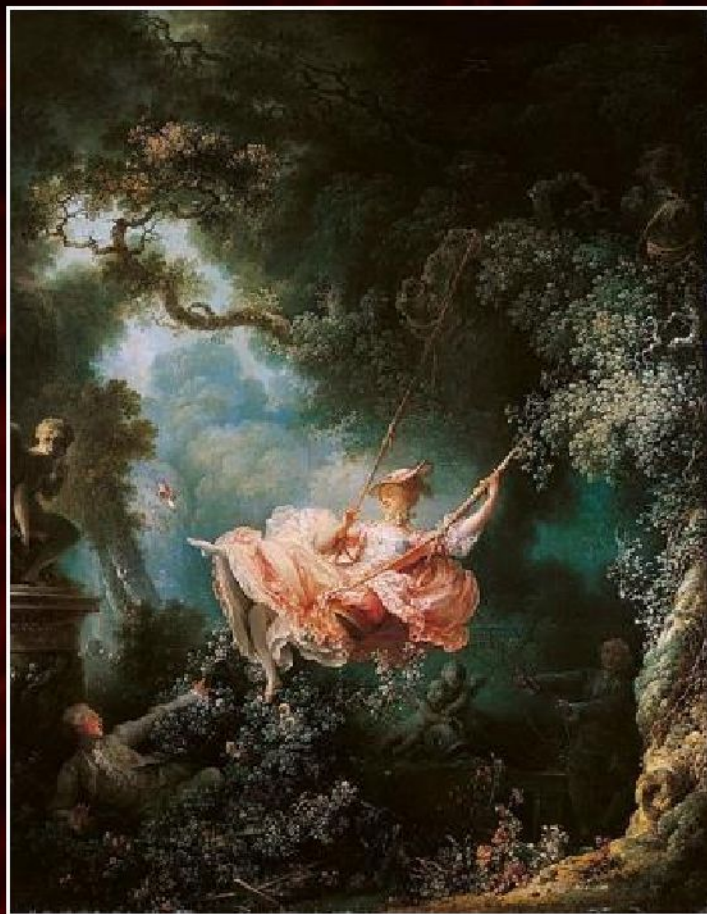
Жан-Оноре Фрагонар «Качели», 1767