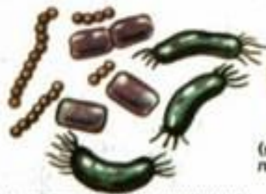
Бактерии: кокки, кишечная палочка, спириллы со жгутиками на концах.