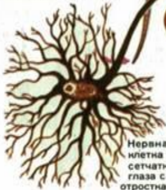
Нервная клетка сетчатки глаза с отростками