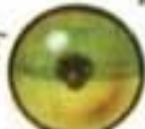
Икринка (яйцеклетка) лягушки