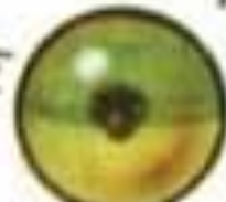
Икринка (яйцеклетка) лягушки