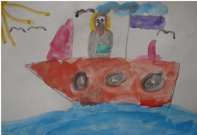
Коптелова М. «В Суру на кораблике»