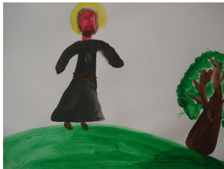
Павлов К. «На прогулке»