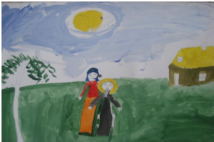
Васильева М. «Отец Иоанн и мама»

18 февраля мы ездили с классом в гости к Иоанну Кронштадтскому в г. Кронштадт.