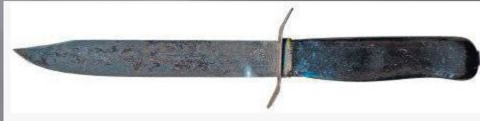
Армейский нож НА-40