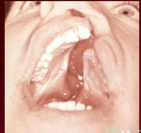
Рис 9, 10, 11, 12 – синдром Патау