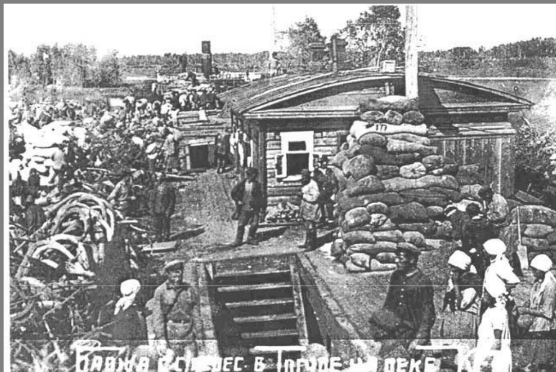
ПРАВЯ В СЛУЖБЕ В ТОРГОВЕ И ДЕКА