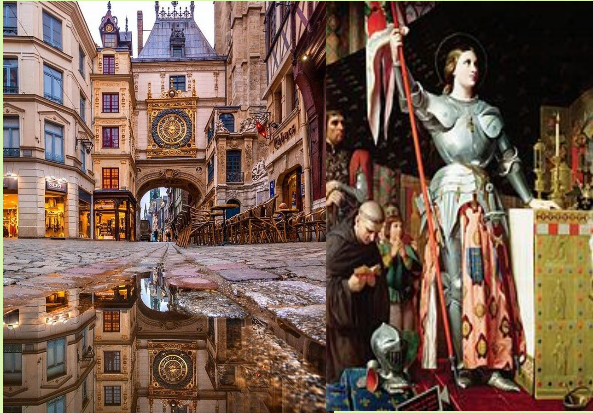
la capitale de la Haute-Normandie