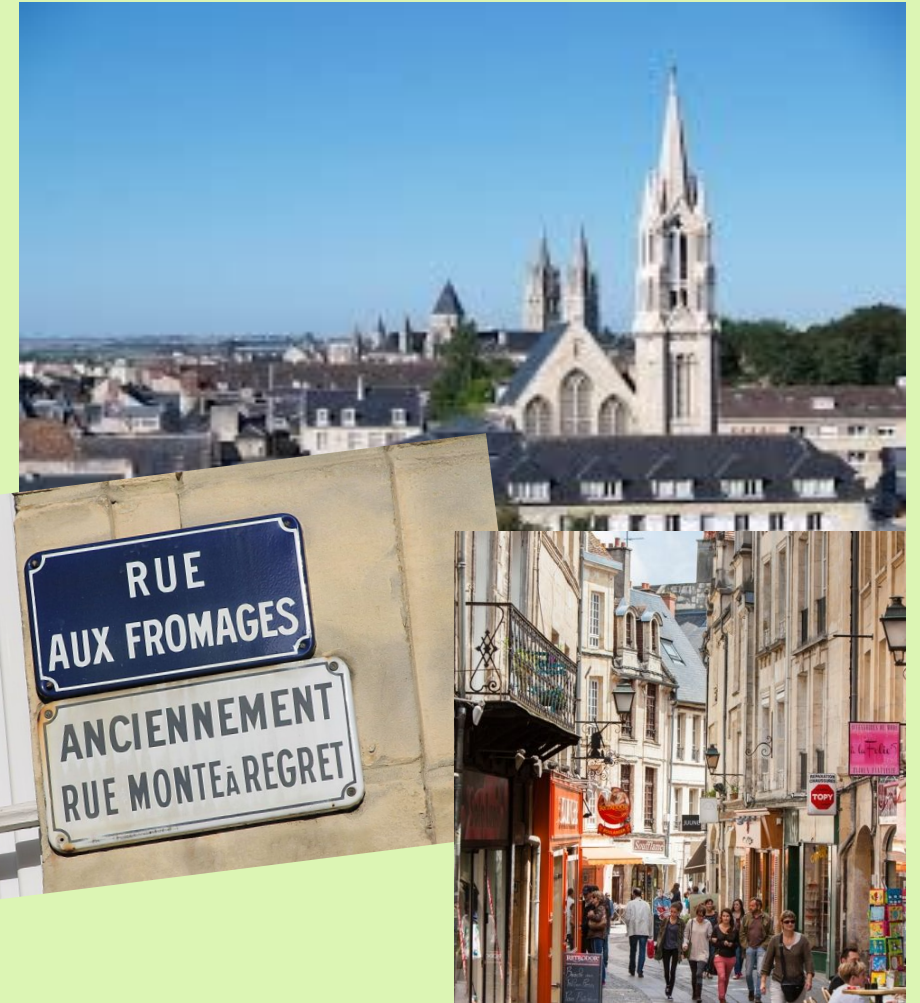
La capitale de la Basse-Normandie