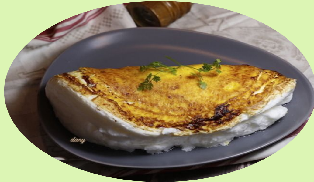
Omelette vallée d'Auge