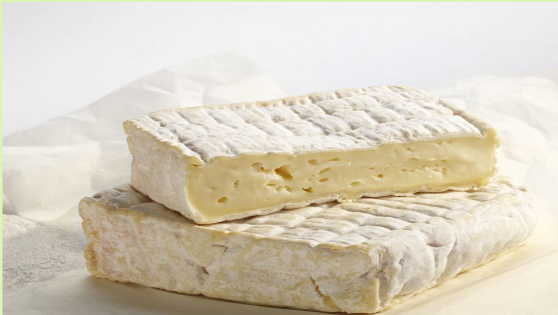
Le Pont L'Évêque,