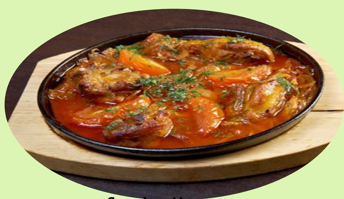
Canard au cidre