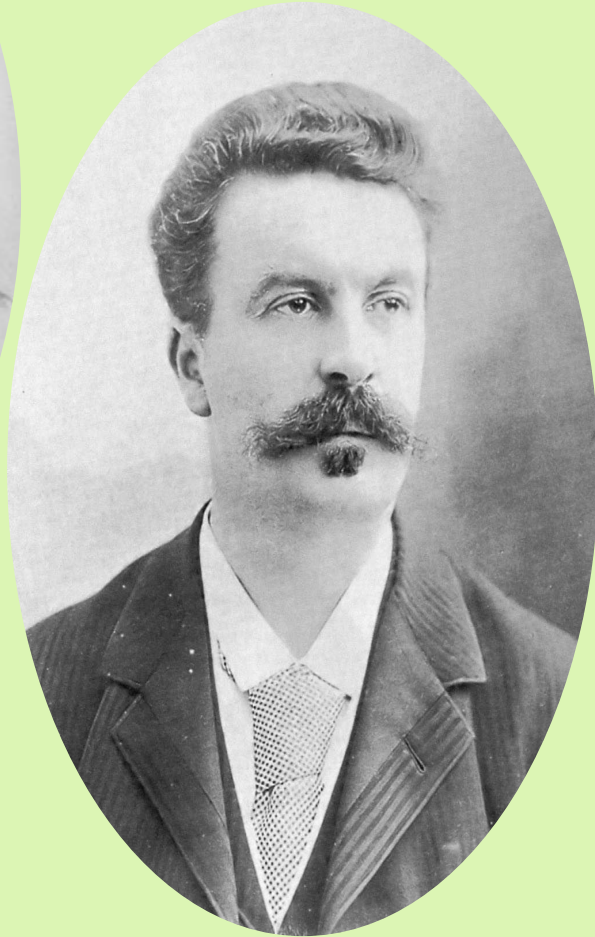
Guy de Maupassant