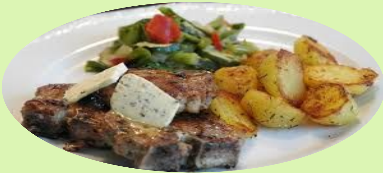
L'agneau de pré-salé