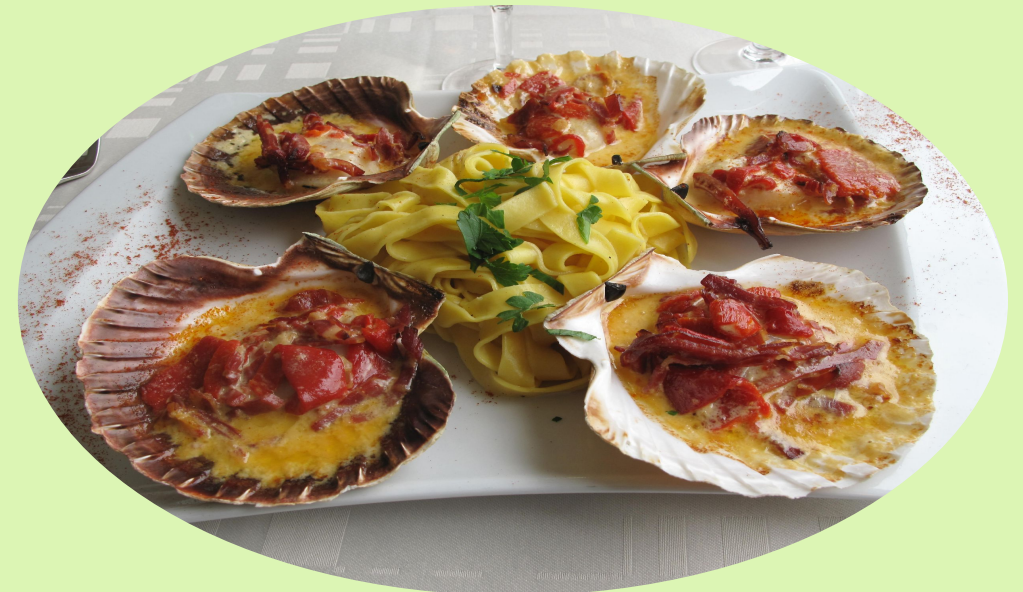
de coquilles Saint-Jacques de France