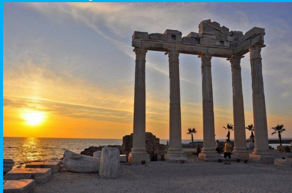
Древний город Сиде