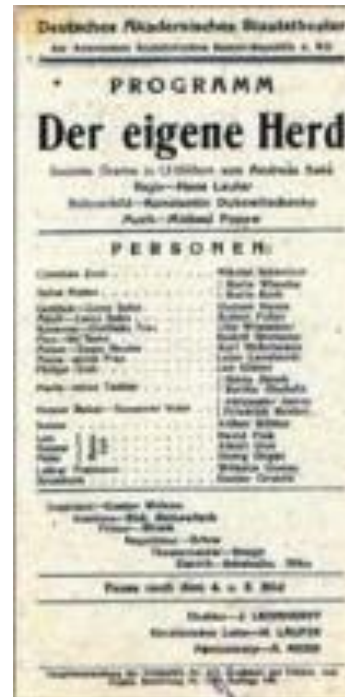
г. Энгельс Программка спектакля