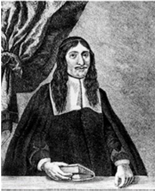
пастор Иоганн Грегори

Повествует книга не только о казахстанском периоде в жизни немецкого театра, а и о том, как лютеранский пастор Иоганн Грегори (Johann Gregory), известный талантом «составлять и представлять комедии», создал в Москве первую театральную труппу. Как ее дебютный спектакль «Деяния Артарксеса», поставленный 30 марта 1662 года по «высочайшему желанию» царя Алексея Михайловича стал фактически днем рождения не только немецкого театра на российской земле, но и днем рождения русского театра. Сюжет: библейская история любви персидского царя Артаксеркса ко второй жене Есфири.