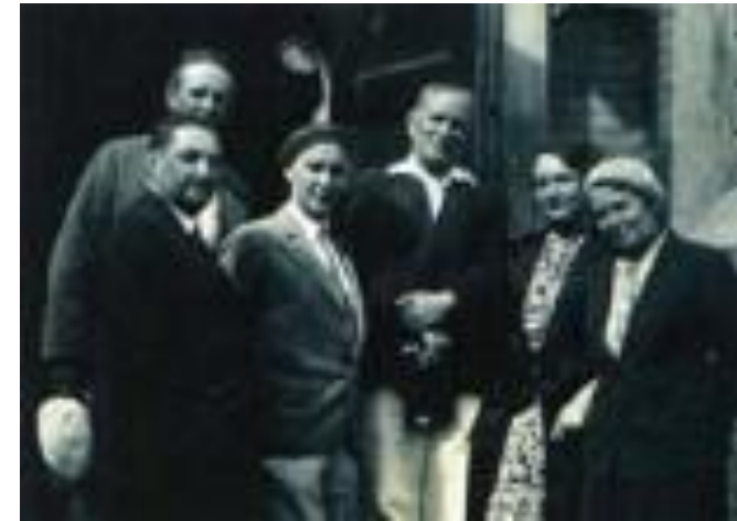
г. Энгельс Артисты Немгостеатра 1933 г.