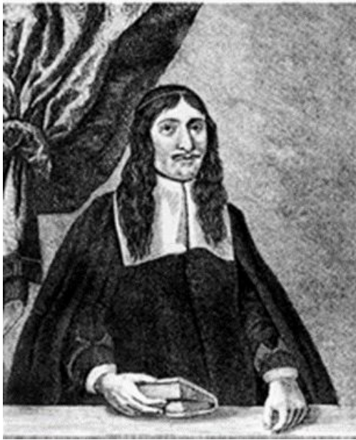
пастор Иоганн Грегори

Повествует книга не только о казахстанском периоде в жизни немецкого театра, а и о том, как лютеранский пастор Иоганн Грегори (Johann Gregory), известный талантом «составлять и представлять комедии», создал в Москве первую театральную труппу. Как ее дебютный спектакль «Деяния Артарксеса», поставленный 30 марта 1662 года по «высочайшему желанию» царя Алексея Михайловича стал фактически днем рождения не только немецкого театра на российской земле, но и днем рождения русского театра. Сюжет: библейская история любви персидского царя Артаксеркса ко второй жене Есфири.