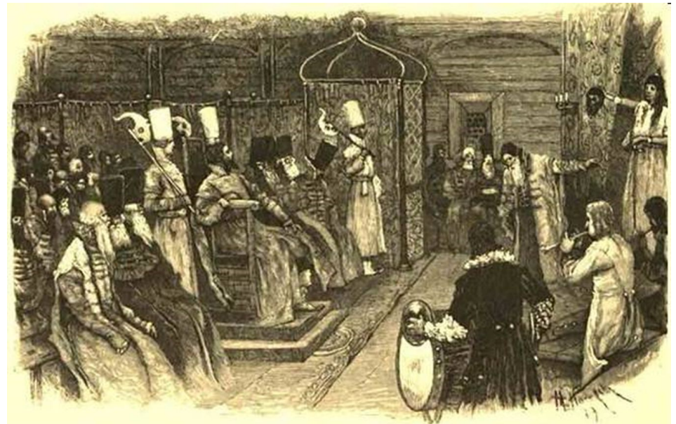
Представление «Юдифи» на сцене Преображенского театра 24 ноября 1674 г. Гравюра А.С.Янова с рисунка М.В. Нестерова. 1895 г