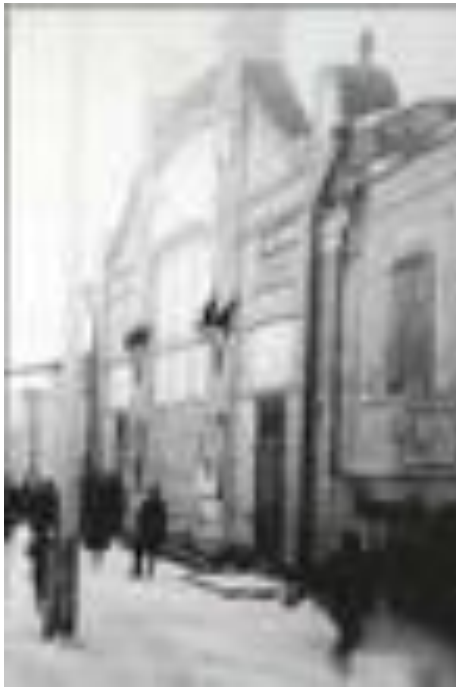
г. Энгельс Здание театра. 1928 г.

Увлекательно, с массой удивительных подробностей рассказывает Штейнмарк и о судьбе немецких театров, существовавших в различных городах империи от Одессы и Екатеринослава (ныне Днепр) до Саратова и Санкт-Петербурга, об Академическом немецком драматическом театре, созданном в 1931 г. в столице АССР Немцев Поволжья Энгельсе и закрытом 8 сентября 1941 г. Повествует она и о том, как вначале 90-х из Алма-Аты, куда незадолго перед этим театр перебрался из Темиртау, практически вся его труппа убыла на ПМЖ в Германию.